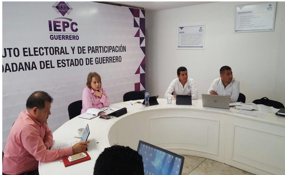
Fotografía 11. Asistencia a la Tercera Sesión Extraordinaria del Comité de Adquisiciones, Arrendamientos y Servicios del IEPC, celebrada el día diecinueve de abril de dos mil diecisiete, en la cual se desarrolló la invitación Restringida número IR-IEPC-006-2017 para la adquisición de uniformes para el personal del instituto Electoral y la invitación Restringida para la contratación de seguros de bienes patrimoniales para el parque vehicular del IEPC.