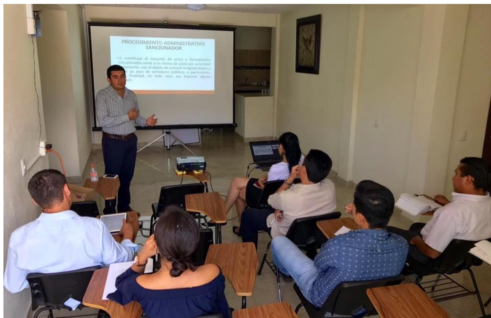
Fotografía 12. Capacitación interna celebrada el mes de marzo del dos mil diecisiete, impartida por el Contralor Interno, denominada "Sistema Nacional Anticorrupción" para el personal que integra la Contraloría Interna del IEPC Guerrero.