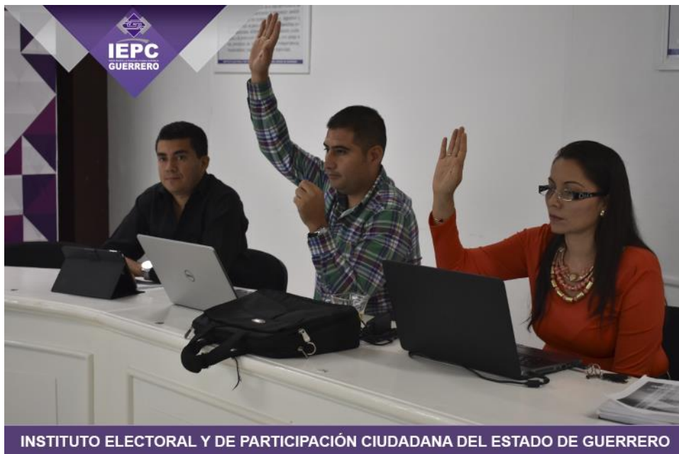
Fotografía 20. Sexta Sesión Ordinaria de la Junta Estatal del IEPC, celebrada el día siete de junio del dos mil diecisiete, en la cual se presentó el informe de la Contraloría Interna respecto de las resoluciones emitidas en los procedimientos de responsabilidades administrativas de los servidores públicos del Instituto Electoral y de Participación Ciudadana del Estado de Guerrero.