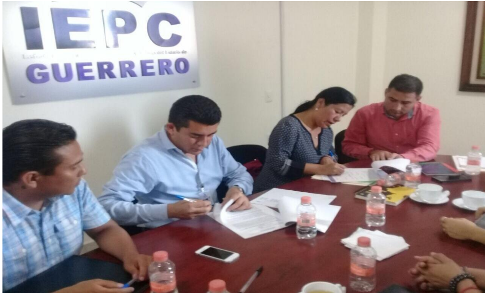
Fotografía 17. Acta parcial de observaciones identificadas en la Auditoría Integral al Ejercicio de los Recursos dos mil dieciséis, celebrada el día diecinueve de junio del dos mil diecisiete.