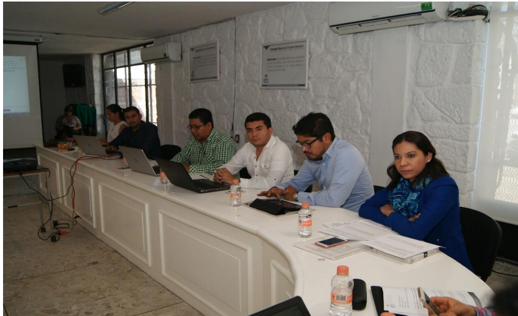
Fotografía 3. Primera Sesión Ordinaria del Comité de Adquisiciones, Arrendamientos y Servicios del IEPC, celebrada el veinticuatro de enero del dos mil diecisiete, en la cual se analizó el programa anual de Adquisidores 2017, así como la Adquisición de materiales y útiles de oficina del IEPC Guerrero.