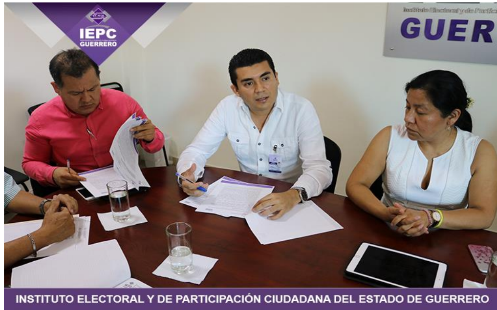
INSTITUTO ELECTORAL Y DE PARTICIPACIÓN CIUDADANA DEL ESTADO DE GUERRERO

Fotografía 5. En cumplimiento de las actividades contempladas en el Plan anual de trabajo, el día veintiuno de marzo del dos mil diecisiete, inicio de revisión del ejercicio de recursos de este órgano electoral con carácter de auditoría integral al ejercicio fiscal del IEPC Guerrero.