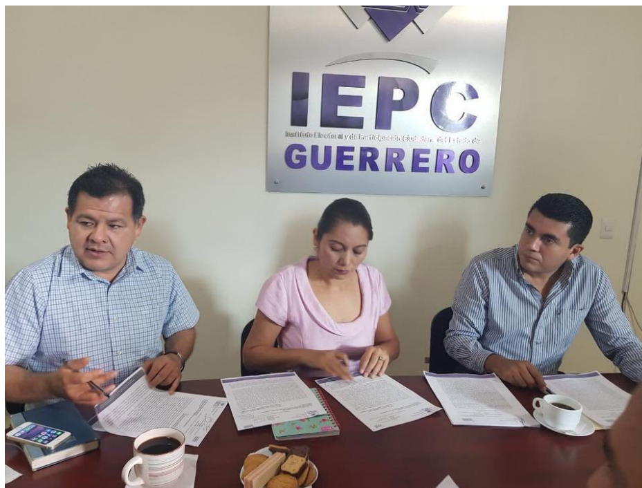
Fotografía 26. Inicio de la auditoría al ejercicio de recursos de este órgano electoral, con carácter de auditoría integral, al periodo enero - septiembre 2017, realizada el 11 de octubre de 2017.