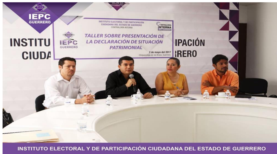
Fotografía 16. "Taller Sobre la Presentación de la Declaración de Situación Patrimonial" impartido por la Contraloría Interna del IEPC, celebra el día dos de mayo del dos mil diecisiete, para los Servidores Públicos Obligados del IEPC Guerrero.