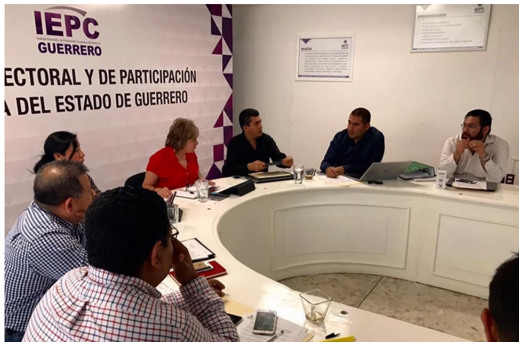
Fotografía 10. Cuarta Sesión Ordinaria del Comité de Adquisiciones, Arrendamientos y Servicios del IEPC, celebrada el cuatro de abril del dos mil diecisiete, en la cual se analizó y en su caso aprobación del acuerdo 004/CAAS/04-04-2017 por el que se modifica el Programa Anual de Adquisiciones; análisis de la propuesta y convocatoria del procedimiento de desincorporación y enajenación de bienes automotrices, equipo de oficina y de computo propiedad del IEPC.