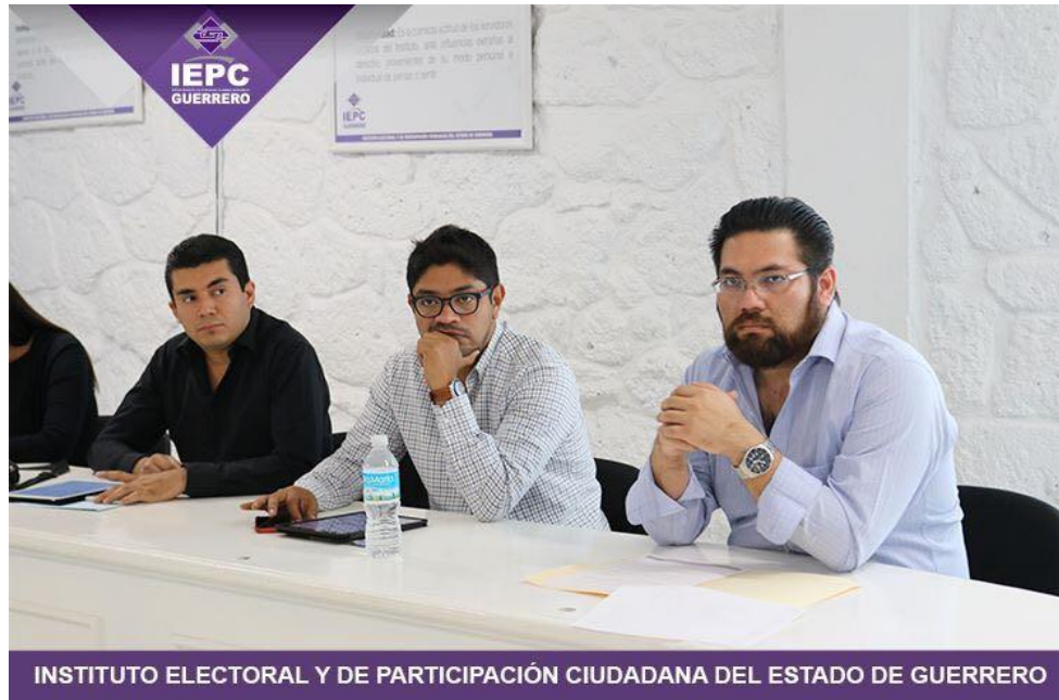
Fotografía 15. Asistencia a la Quinta Sesión Extraordinaria del Comité de Adquisiciones, Arrendamientos y Servicios del IEPC, celebrada el día veinticuatro de abril del dos mil diecisiete, en el cual se llevó a cabo el desarrollo de las declaraciones de la Licitación Pública Nacional número LPN-IEPC-002-17 para la adquisición de tarjetas de regalo, certificados, monederos electrónicos o vales para el personal del IEPC.