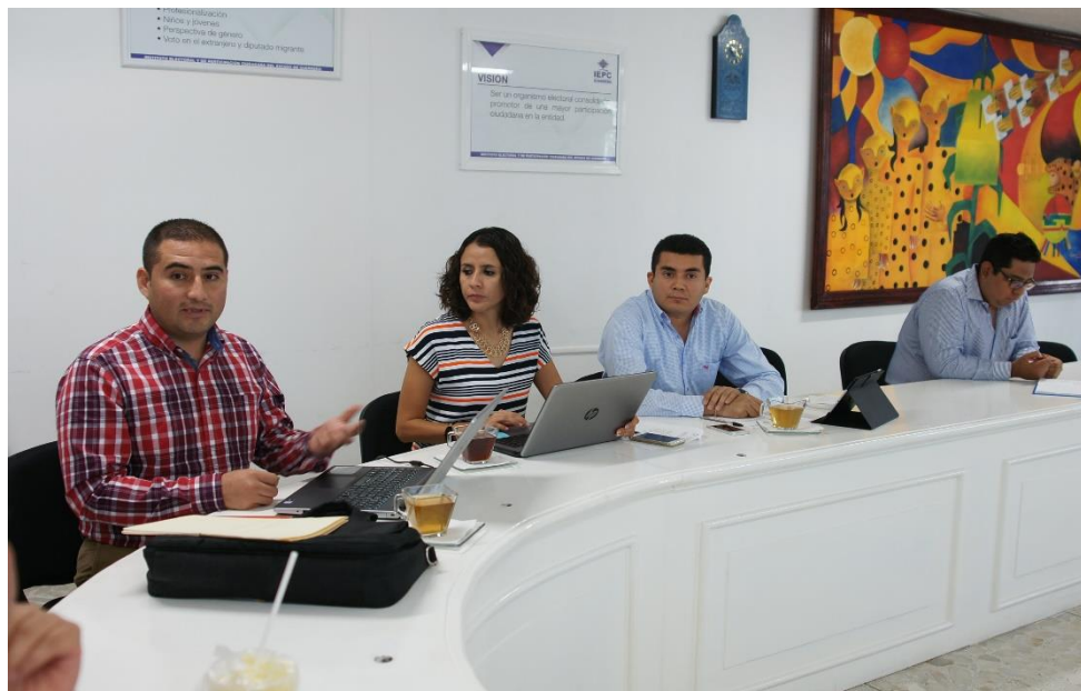
Fotografía 2. Segunda Sesión Ordinaria de la Junta Estatal del IEPC, celebrada el día veintiocho de febrero del dos mil diecisiete, en la cual se analizó el Informe del estado de alta de trabajadores en el seguro de separación individual contratado por la empresa GNP seguros, así como el informe de propuesta de medidas de austeridad y racionalidad del gasto del ejercicio 2017 del IEPC Guerrero