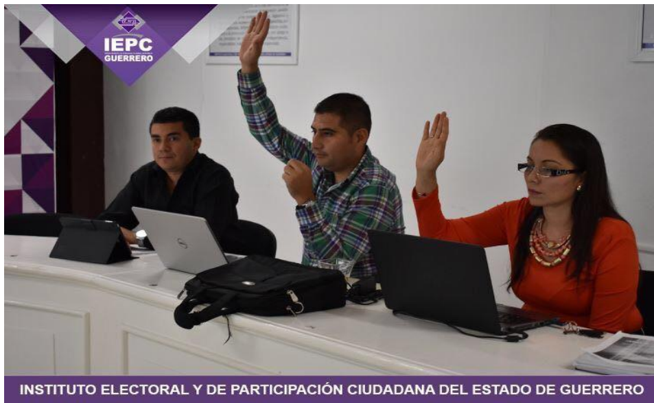
Fotografía 13. Asistencia a la Sexta Sesión Ordinaria de la Junta Estatal celebrada el día siete de junio del dos mil diecisiete, en la cual se dio el informe que presenta la Contraloría Interna respecto de las resoluciones emitidas en los procedimientos de responsabilidades administrativas de los servidores públicos del Instituto Electoral y de Participación Ciudadana del Estado de Guerrero.