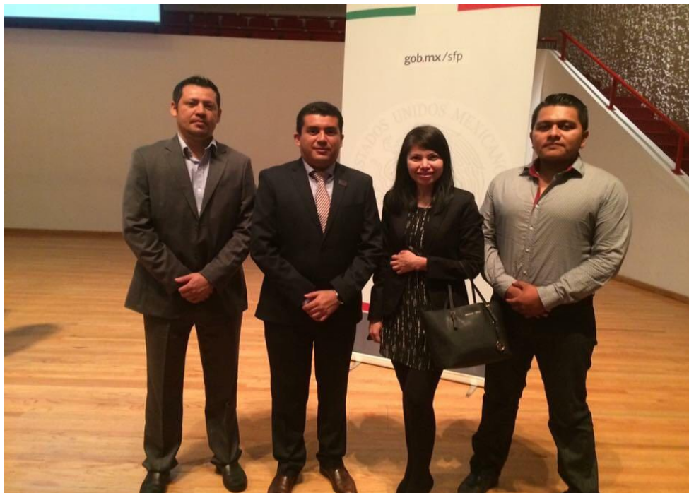
Fotografía 18. Asistencia del Contralor Interno y personal de la Unidad Técnica de Procedimientos y Responsabilidades Administrativas Adscrita a la Contraloría Interna, al curso denominado "Obligaciones y Responsabilidades de los Servidores Públicos bajo el esquema del Sistema Nacional Anticorrupción" celebrado durante los días 30 y 31 de mayo del dos mil diecisiete, en la Ciudad de México.