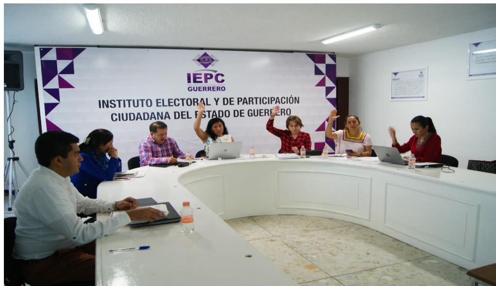
Fotografía 4. Primera Sesión de Trabajo del Comité de Transparencia y Acceso a la Información Pública del IEPC, celebrada el veinticuatro de enero del dos mil diecisiete, en la cual se hizo la presentación del 2° Informe Semestral de Solicitudes de Información del periodo julio-diciembre de 2016, así como el calendario de actividades del Comité de Transparencia.