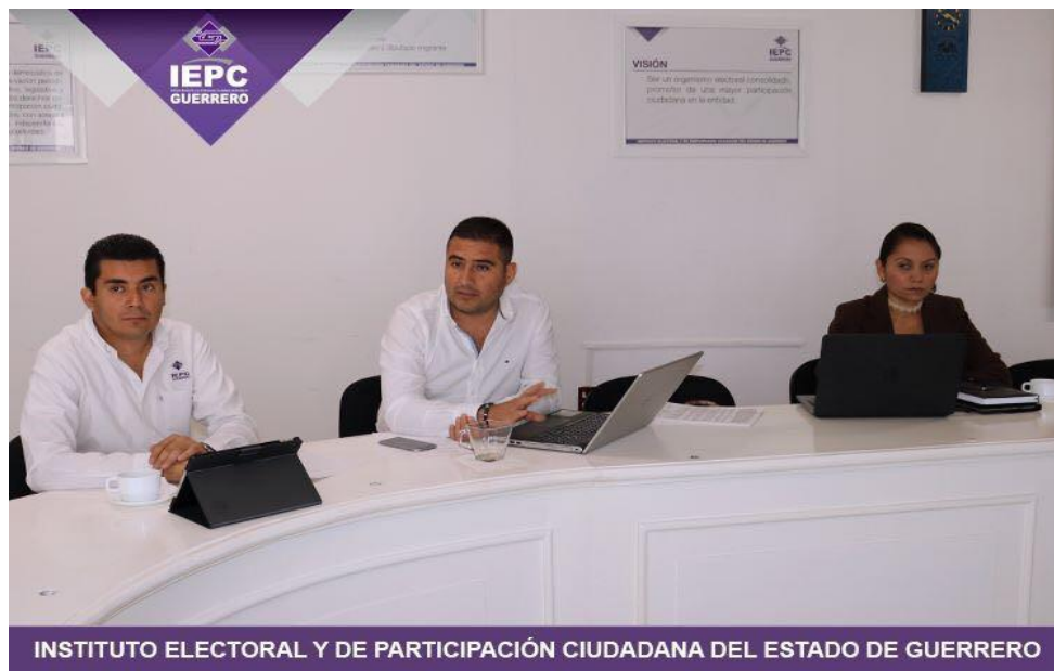
Fotografía 8. Asistencia a la Sesión Ordinaria de la Junta Estatal celebrada el día diecinueve de abril del dos mil diecisiete, en la cual se dio el informe que presenta la Contraloría Interna respecto del estado que guardan los procedimientos administrativas de los servidores públicos del IEPC.