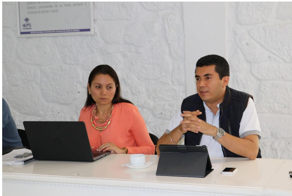
Fotografía 21. Asistencia a la Séptima Sesión Ordinaria del Comité de Transparencia y Acceso a la Información Pública del IEPC, celebrada el día doce de julio de dos mil diecisiete, en el cual se presentó el Informe mensual de solicitudes de información correspondientes al mes de junio de 2017 y la presentación del Informe semestral de solicitudes de información, correspondiente al mes de enero a junio de 2017.