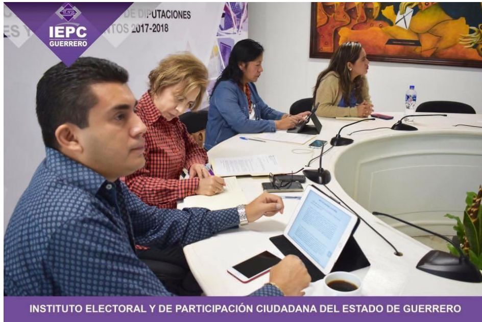
Fotografía 25. Decima Primera Sesión Extraordinaria del Comité de Adquisiciones, Arrendamientos y Servicios del IEPC, celebrada el veintiséis de septiembre del 2017, en la cual se Desarrolló la segunda subasta pública para la desincorporación y enajenación de bienes muebles propiedad del IEPC Guerrero.