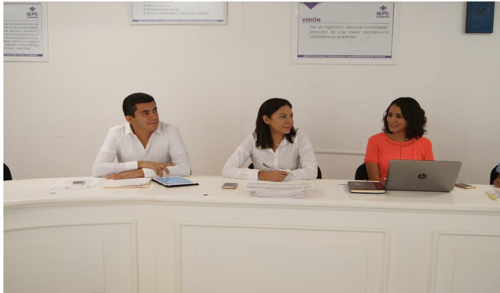
Fotografía 9. Segunda Sesión Ordinaria del Comité de Transparencia y Acceso a la Información del IEPC, celebrada el quince de febrero del dos mil diecisiete, en la cual se analizó la Revisión de las Obligaciones de Transparencia que deben ser difundidas en la PNT y la página web Oficial del IEPC-GRO.