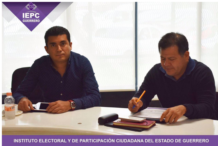
Fotografía 22. Octava Sesión Ordinaria del Comité de Adquisiciones, Arrendamientos y Servicios del IEPC, celebrada el treinta de agosto del dos mil diecisiete en la cual se analizó el acuerdo 014/CAAS/30-08-2017, relativo a la adjudicación directa para la contratación del servicio de marketing online para la difusión del Informe Guerrero del IEPC, Guerrero el programa anual de Adquisidores 2017, así como la Adquisición de materiales y útiles de oficina del IEPC Guerrero.