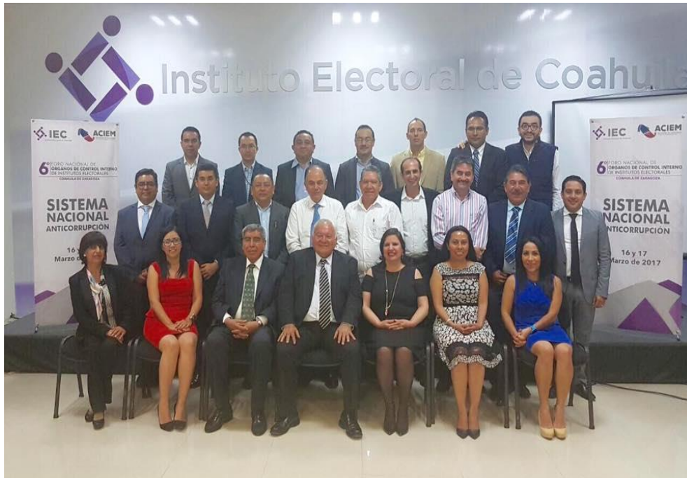
Fotografía 7. Asistencia del Contralor Interno del IEPC Guerrero al 6º Foro Nacional de Órganos del Control Interno de Institutos Electorales, se ofreció la Conferencia “Sistema Nacional Anticorrupción” invitación por el Instituto Electoral de Coahuila y la Asociación de Contralores de Institutos Electorales de México, A.C, celebrada el día 16 de marzo del dos mil diecisiete, realizado en la Ciudad de Coahuila de Zaragoza.