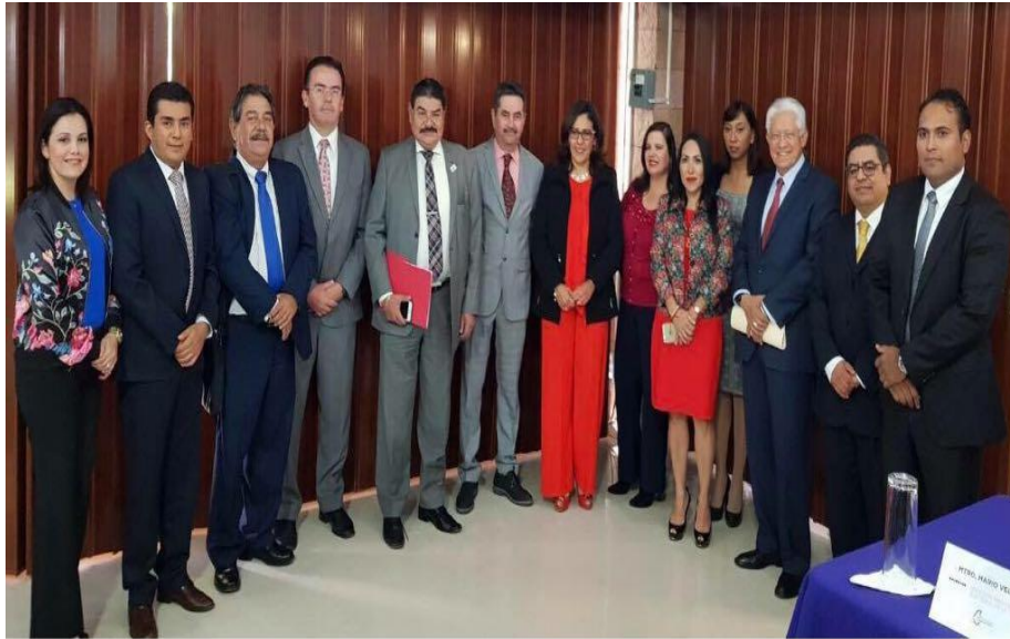
Fotografía 23. Asistencia del Contralor Interno del IEPC Guerrero a la Mesa de Dialogo “El Reto que Representa el Sistema Nacional Anticorrupción para los Institutos” con la Asociación de Contralores de Institutos Electorales de México, A.C, celebrada el día 13 de noviembre del dos mil diecisiete, en el Instituto Electoral de la Ciudad de México.