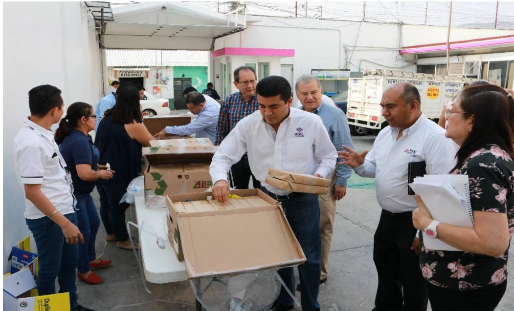
Fotografía 9. Asistencia a la Recepción de Exámenes para los CAES locales, celebrado el día veintiséis de abril del presente año.