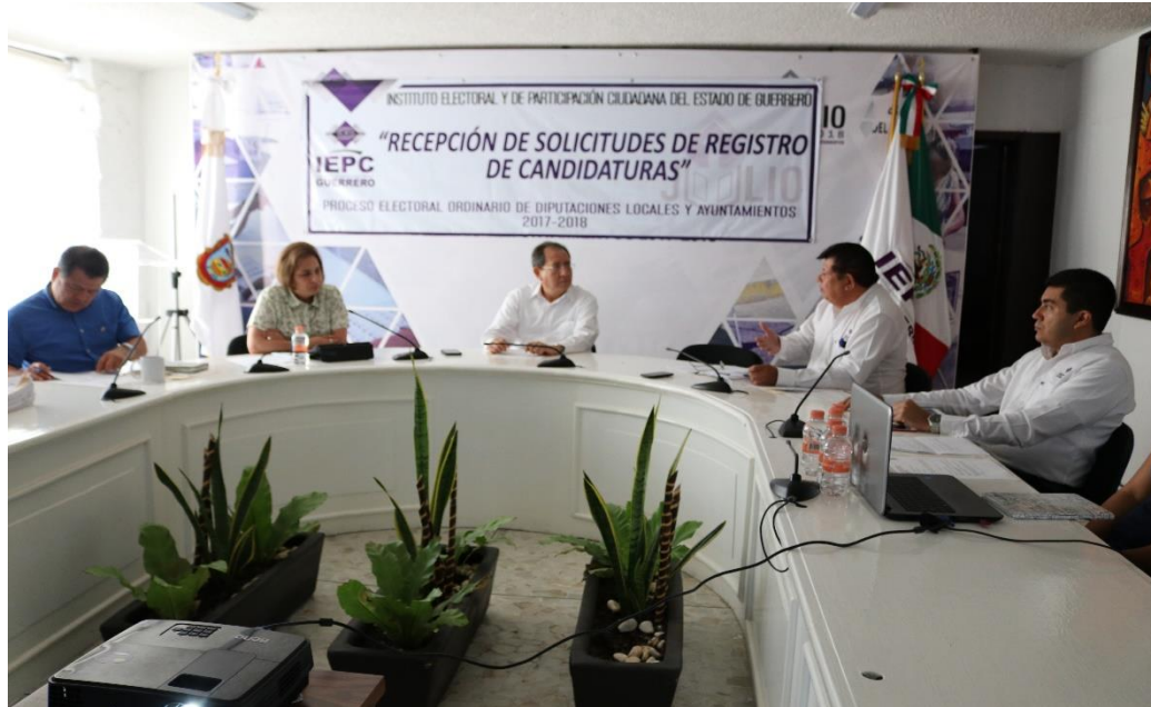
Fotografía 3. Cuarta sesión Ordinaria del Comité de Transparencia y Acceso a la Información Pública del IEPC, celebrada el día trece de abril de dos mil dieciocho, en el cual se informó sobre los Acuerdos y Lineamientos remitidos por el ITAIGRO, sobre el programa anual de verificación 2018; así el informe sobre el curso de capacitación y/o actualización a los enlaces de las obligaciones de transparencia sobre la nueva interfaz de la PNT, y los formatos de publicación de la información a partir del 2018