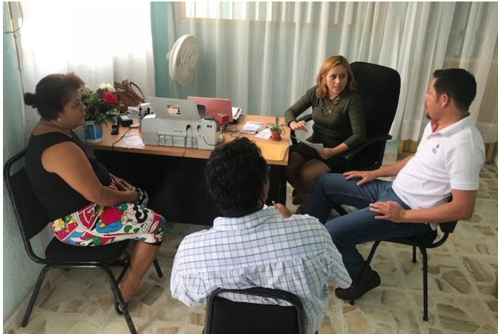
Fotografía 23. Visita a los 28 Consejos Distritales Electorales del IEPC Guerrero, para llevar a cabo la Revisión de los Recursos asignados y taller para dar cumplimiento con la presentación de las declaraciones.