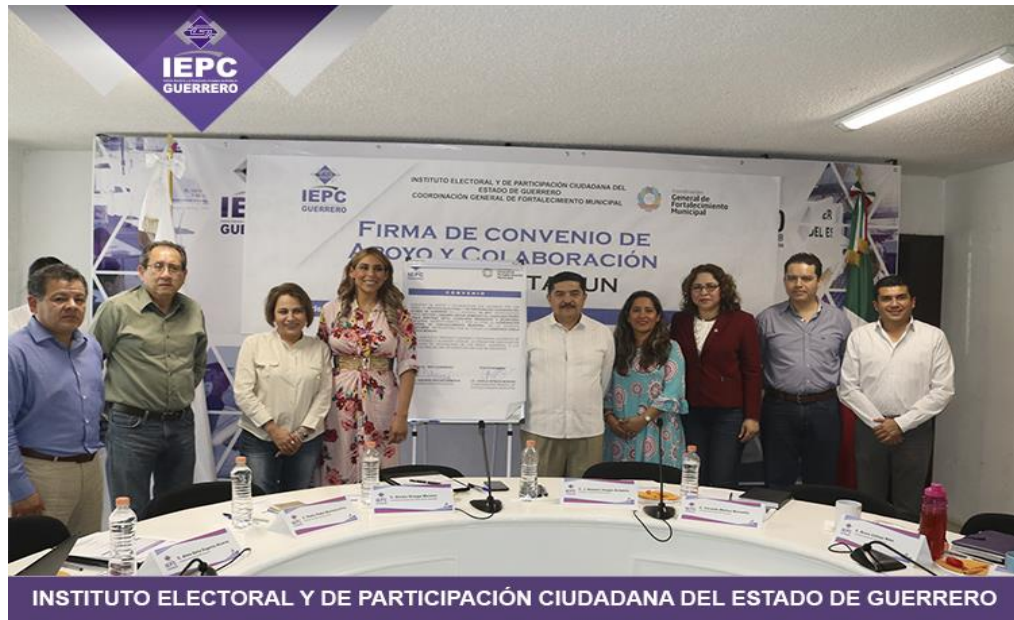
Fotografía 11. Asistencia a la firma de Convenio de Apoyo y Colaboración entre el IEPC Guerrero y el FORTAMUN, con el objetivo de mejorar las condiciones para el desarrollo del Proceso Electoral para Diputados locales y Ayuntamientos 2017-2018, celebrado el día veintiuno de marzo del presente año.