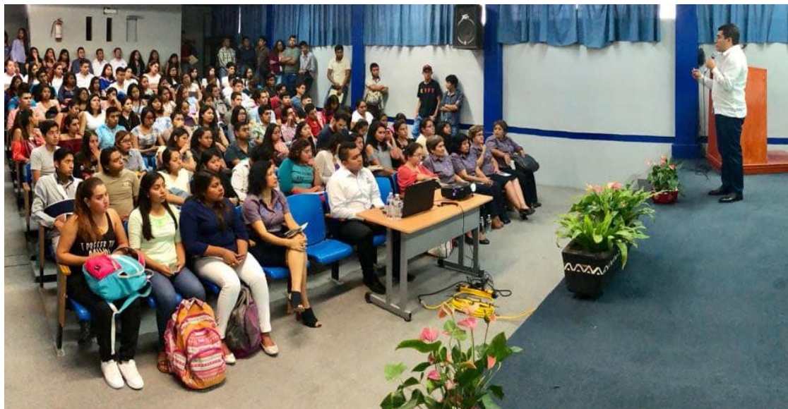
Fotografía 16. En el marco de la Jornada Tecnológica del Contador Público 2018, participo el Contralor Interno el IEPC, Guerrero, en la ponencia "Función del Órgano Interno de Control en el Sistema Nacional Anticorrupción", celebrada el día veinticuatro de mayo del presente año.