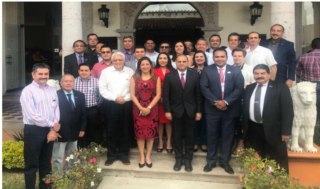
Fotografía 4. Asistencia al Séptimo Foro Nacional de Nominado "Los Órganos Internos de Control de los Institutos Electorales en el Sistema Nacional Anticorrupción" organizado por la Contraloría General y la Asociación de Contralores de Institutos electorales de México, A.C. (ACIEM), llevado a cabo los días 22 y 23 de febrero del presente año, en la Ciudad de Xalapa, Veracruz, México.