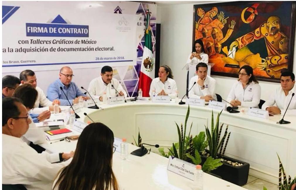
Fotografía 13. Asistencia a la firma de contrato con Talleres Gráficos de México, para la adquisición de documentación electoral, para el Proceso Ordinario 2017-2018, celebrado el día veintiocho de marzo del presente año.