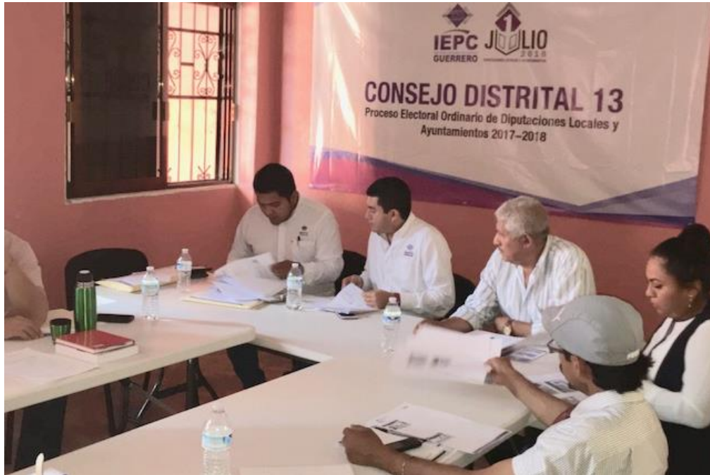
Fotografía 21. Visita a los 28 Consejos Distritales Electorales del IEPC Guerrero, para llevar a cabo la Revisión de los Recursos asignados y taller para dar cumplimiento con la presentación de las declaraciones.