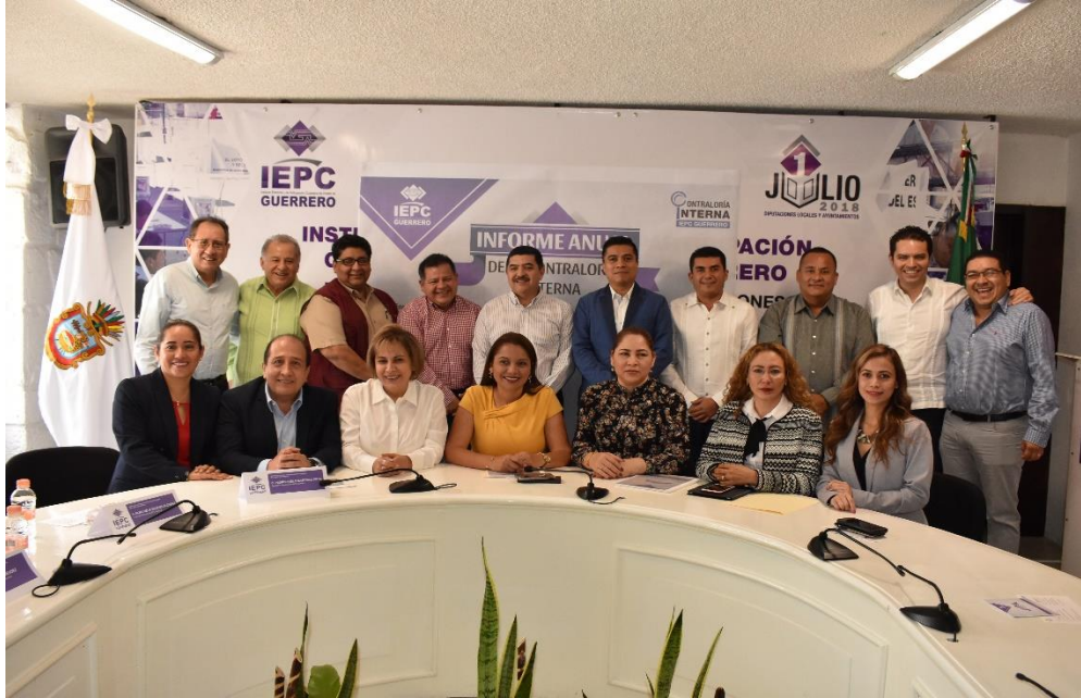
Fotografía 7. Presentación del informe anual de resultados de gestión de la Contraloría Interna, celebrado el día 12 de febrero de año en curso. Como invitados especiales el Auditor Superior del Estado, el Delegado del INE en Guerrero, Auditores Especiales y Directores de la ASE, además del cuerpo Directivo del IEPC, Guerrero