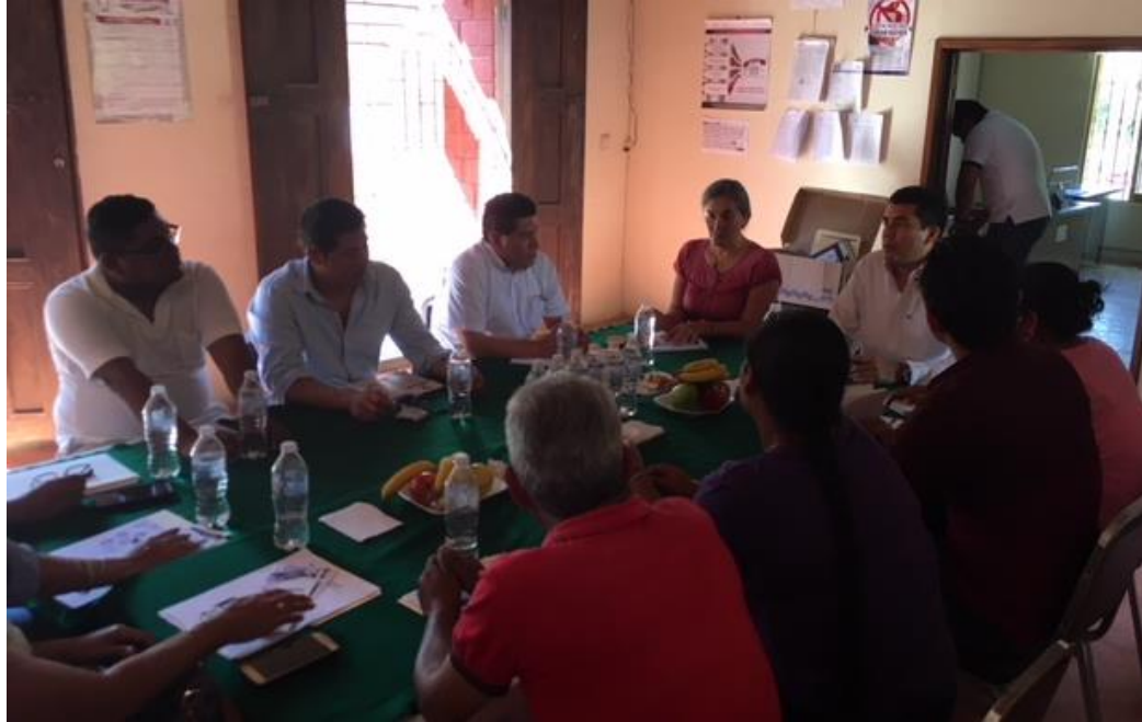
Fotografía 19. Visita a los 28 Consejos Distritales Electorales del IEPC Guerrero, para llevar a cabo la Revisión de los Recursos asignados y taller para dar cumplimiento con la presentación de las declaraciones.