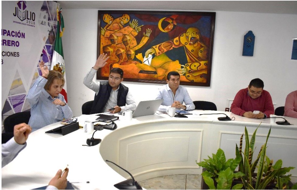
Fotografía 1. Primera Sesión Ordinaria del Comité de Adquisiciones, Arrendamientos y Servicios del IEPC, celebrada el once de enero del presente año, en la cual se realizó la Junta de Aclaraciones de la Licitación Pública Nacional LPN-IEPC-005-2017 para la adquisición de materiales didácticos y educativos para la capacitación electoral en el proceso electoral ordinario 2017-2018.

En el presente apartado se agregan diversas fotografías correspondientes a las actividades institucionales en las que la Contraloría Interna ha participado durante este periodo.