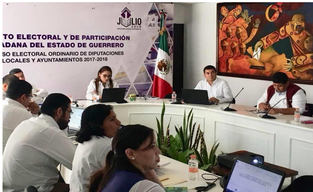
Fotografía 12. Décima Séptima Sesión Extraordinaria del Comité de Adquisiciones, Arrendamientos y Servicios del IEPC, celebrada el veintiocho de marzo del presente año, en la cual se realizó el Análisis del proyecto de dictamen 07/CAAS/28-03-2018 por el que aprueba la excepción al procedimiento de Licitación Pública Nacional para la elaboración del Cancel Electoral para ser utilizado el día de la jornada electoral ordinario 2017-2018 en el Estado de Guerrero., y adjudicación directa a favor de la Paraestatal Talleres Gráficos de México Junta de Aclaraciones de la Licitación Pública Nacional LPN-IEPC-005-2017 para la adquisición de materiales didácticos y educativos para la capacitación electoral en el proceso electoral ordinario 2017-2018.