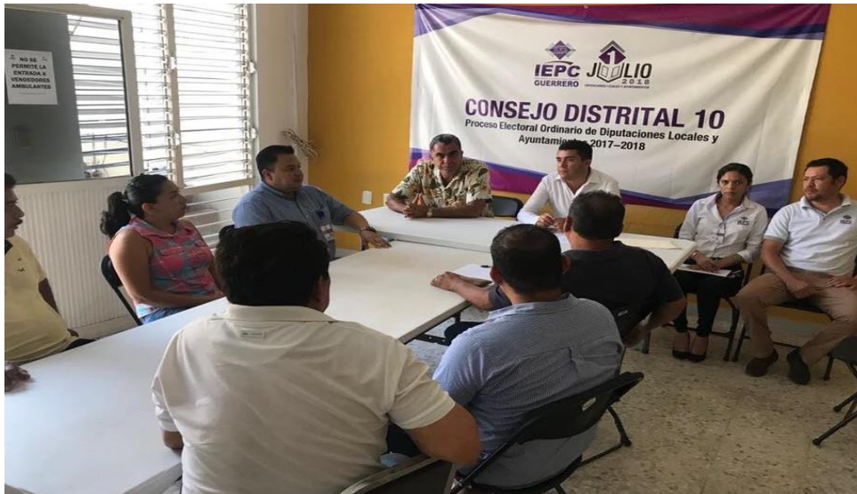
Fotografía 18. Visita a los 28 Consejos Distritales Electorales del IEPC Guerrero, para llevar a cabo la Revisión de los Recursos asignados y taller para dar cumplimiento con la presentación de las declaraciones.