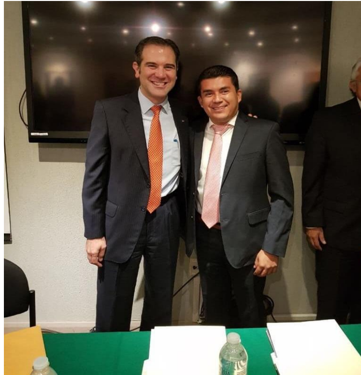
Fotografía 15. Con el Dr. Lorenzo Córdova Vianello, Consejero Presidente del Instituto Nacional Electoral, en el curso-taller denominado "Modelo Normativo y Tecnológico para la Implementación del Sistema de Información de Auditoría del Órgano del Instituto Nacional Electoral" organizado por el Órgano de Control del Instituto Nacional Electoral, en coordinación con la Asociación de Contralores de Institutos electorales de México, A.C. (ACIEM), llevado a cabo los días 3 y 4 de mayo del presente año, en la Ciudad de México.