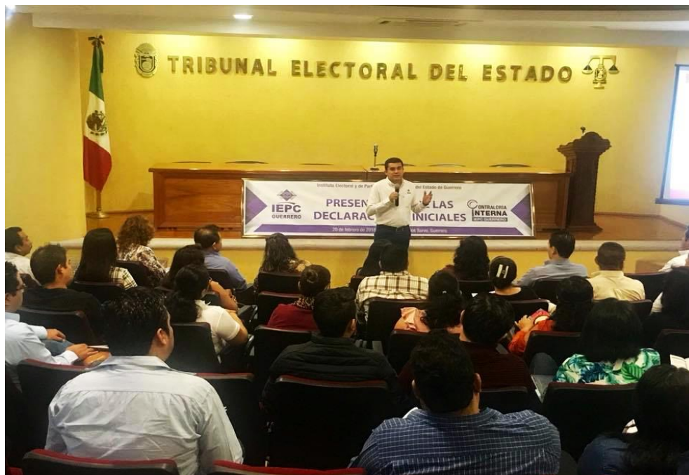
Fotografía 8. Taller sobre la obligación para presentación de declaraciones 3 de 3 a Servidores Públicos del IEPC, Guerrero, celebrado el día 20 de febrero del presente año.