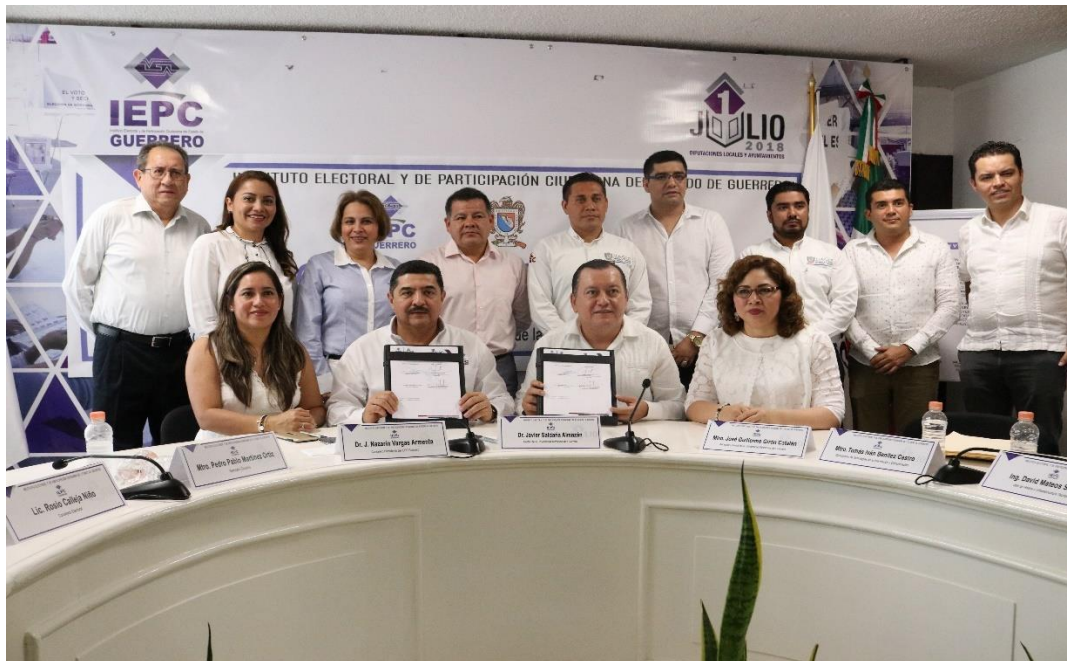
Fotografía 10. Asistencia a la firma de Convenio de Colaboración entre el IEPC Guerrero y la UAGro, para facilitar infraestructura tecnológica en las pruebas de auditoría al PREP, celebrado el día dos de abril del presente año.