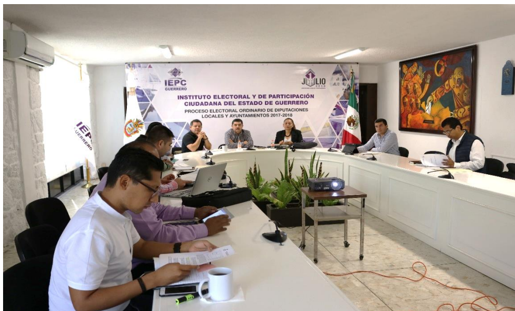
Fotografía 2. Segunda Sesión Ordinaria de la Junta Estatal del IEPC, celebrada el día dieciséis de enero del presente año, en la cual se analizó el Acuerdo 002/JE/16-02-2018, relativo a la aprobación de criterios para la ocupación de vacantes en los puestos de analistas de organización, analistas jurídicos y auxiliares administrativos, de los Consejos Distritales Electorales del IEPC Guerrero.