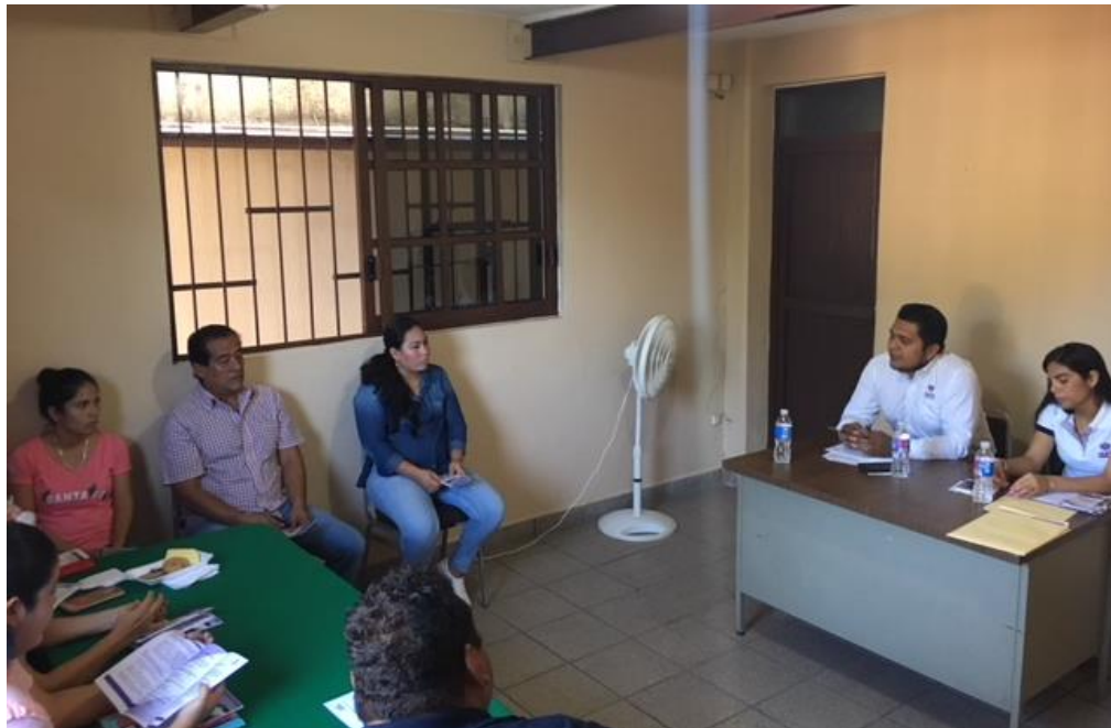
Fotografía 22. Visita a los 28 Consejos Distritales Electorales del IEPC Guerrero, para llevar a cabo la Revisión de los Recursos asignados y taller para dar cumplimiento con la presentación de las declaraciones.