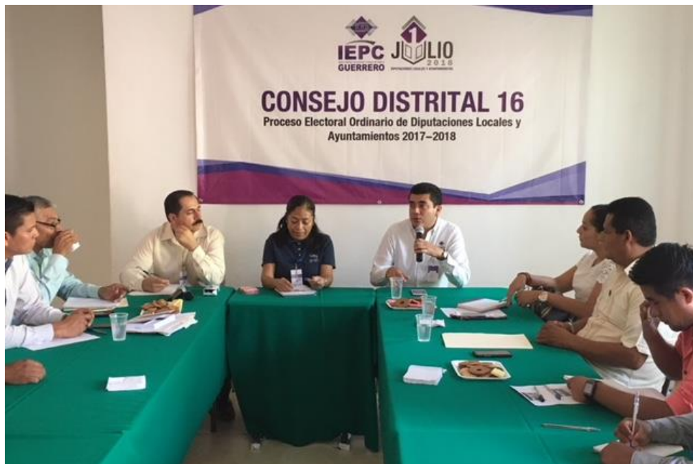
Fotografía 20. Visita a los 28 Consejos Distritales Electorales del IEPC Guerrero, para llevar a cabo la Revisión de los Recursos asignados y taller para dar cumplimiento con la presentación de las declaraciones.