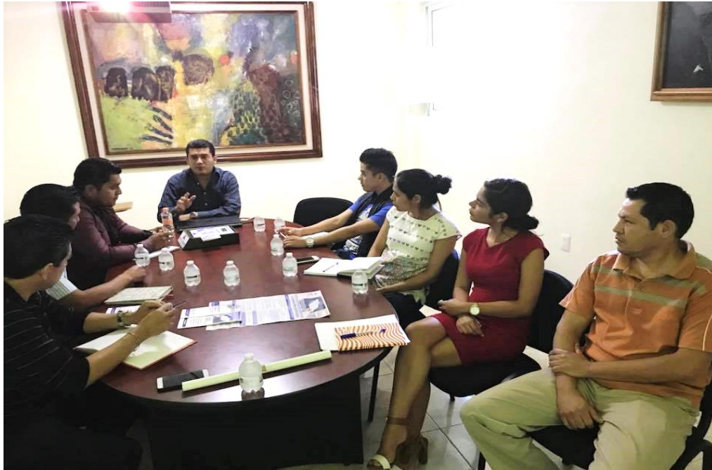
Fotografía 5. Jornada de capacitación celebrada en el mes de enero, al personal del Órgano Interno de Control para el desarrollo de actividades institucionales.