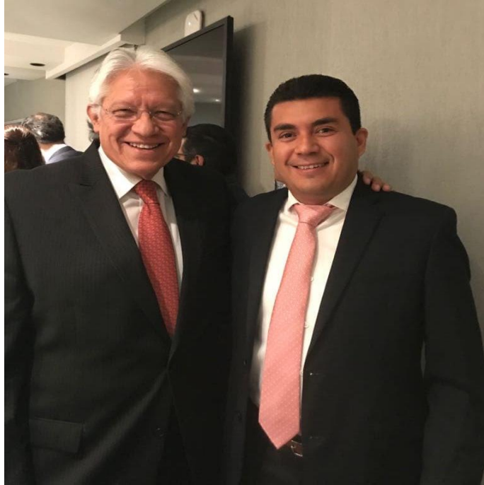
Fotografía 17. Con el C.P. Gregorio Guerrero Pozas, Contralor General del INE, en el curso-taller denominado “Modelo Normativo y Tecnológico para la Implementación del Sistema de Información de Auditoría del Órgano del Instituto Nacional Electoral” organizado por el Órgano de Control del Instituto Nacional Electoral, en coordinación con la Asociación de Contralores de Institutos electorales de México, A.C. (ACIEM), llevado a cabo los días 3 y 4 de mayo del presente año, en la Ciudad de México.