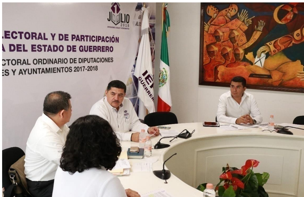
Fotografía 14. Sexta Sesión Ordinaria de la Junta Estatal del IEPC, celebrada el día quince de mayo del presente año, en la cual se analizó el Acuerdo 003/JE/15-05-2018 por el que aprueban los Criterios y montos para el otorgamiento de la fianza de los servidores públicos del Instituto Electoral y de Participación Ciudadana del Estado de Guerrero, que tienen a su cargo la custodia y administración de los recursos públicos.