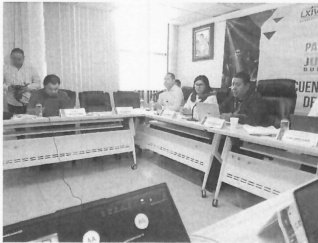
Encuentro Regional Costa Grande Parlamento Juvenil 2025, 23 de octubre de 2025.