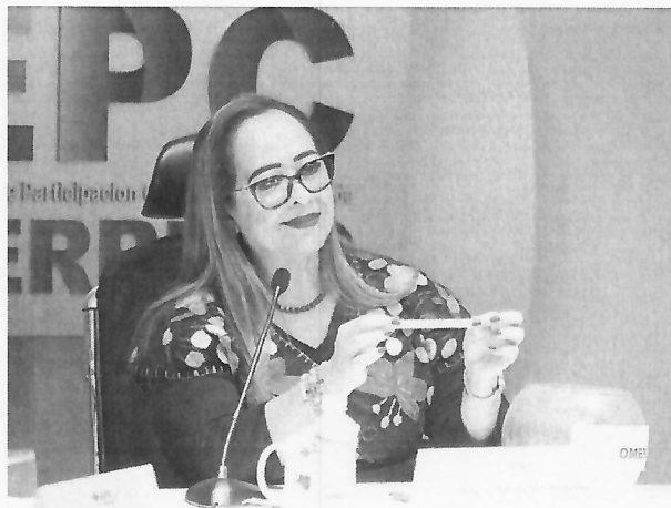
Sorteo del Parlamento Juvenil 2025, 06 de noviembre de 2025.