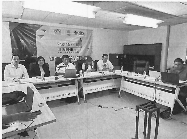
Encuentro Regional Centro Parlamento Juvenil 2025, 24 de octubre de 2025