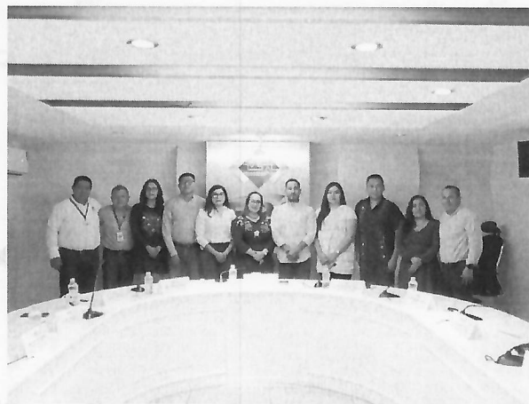
Sorteo del Parlamento Juvenil 2025, 06 de noviembre de 2025.