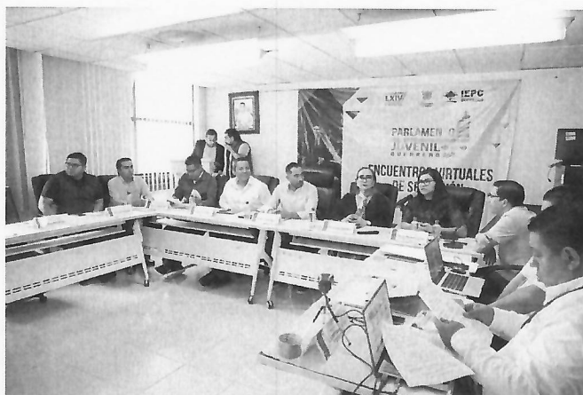
Inauguración del Parlamento Juvenil 2025, 09 de octubre de 2025.