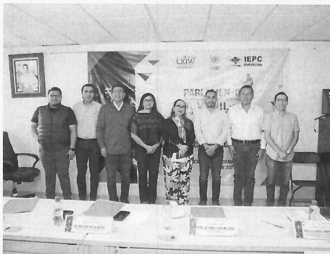
Inauguración del Parlamento Juvenil 2025, 09 de octubre de 2025.