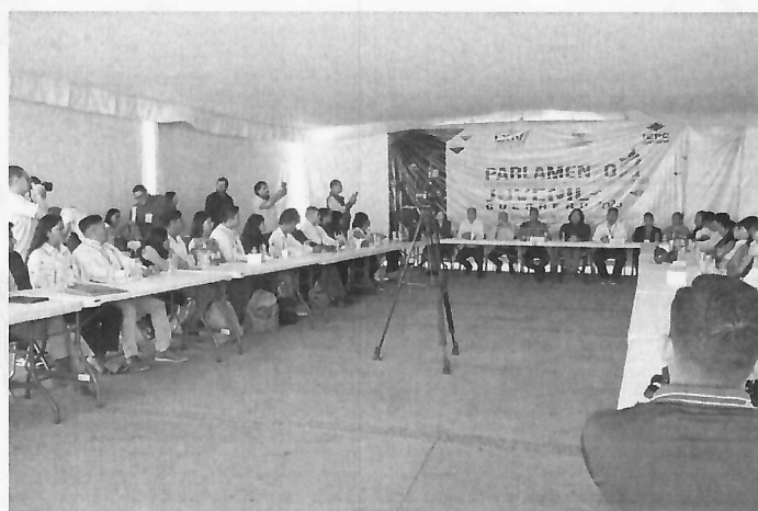
Recepción de las y los jóvenes del Parlamento Juvenil 2025, 06 de noviembre de 2025.