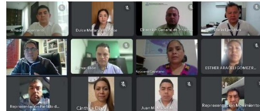
2ª Sesión Ordinaria / 17-02-2023