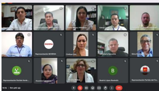
5ª Sesión Ordinaria / 17-05-2023