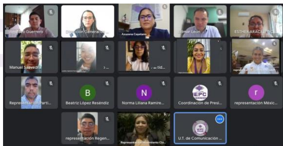
11ª Sesión Ordinaria / 29-11-2023