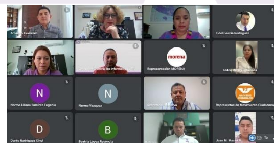
6ª Sesión Ordinaria / 21-06-2023