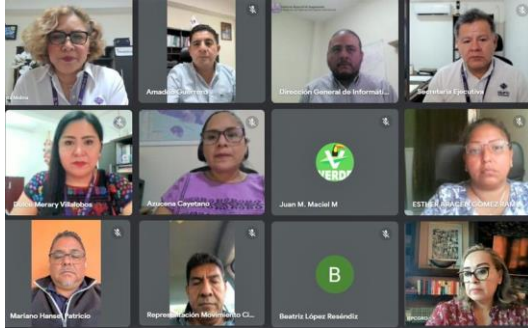
1ª Sesión Ordinaria / 20-01-2023