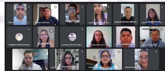
12ª Sesión Ordinaria / 07-12-2023