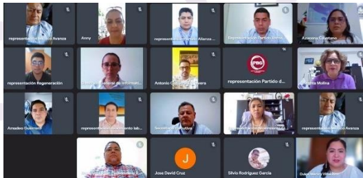
9ª Sesión Ordinaria / 20-09-2023