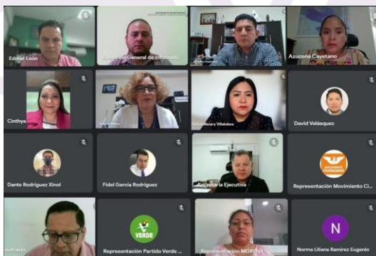
3ª Sesión Ordinaria / 17-03-2023