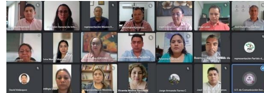
8ª Sesión Ordinaria / 23-08-2023