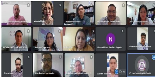
7ª Sesión Ordinaria / 14-07-2023