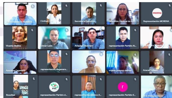
10ª Sesión Ordinaria / 20-10-2023