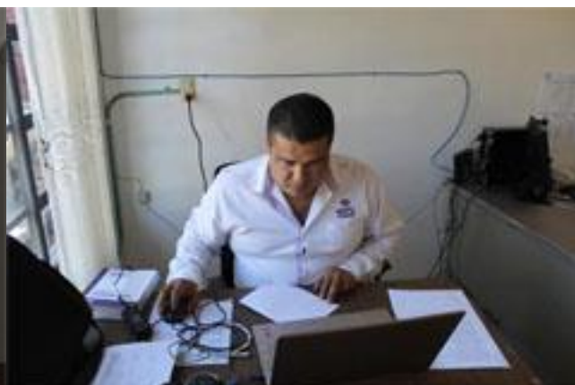
Consejo Distrital Electoral 23, participando en la primera etapa de capacitación.