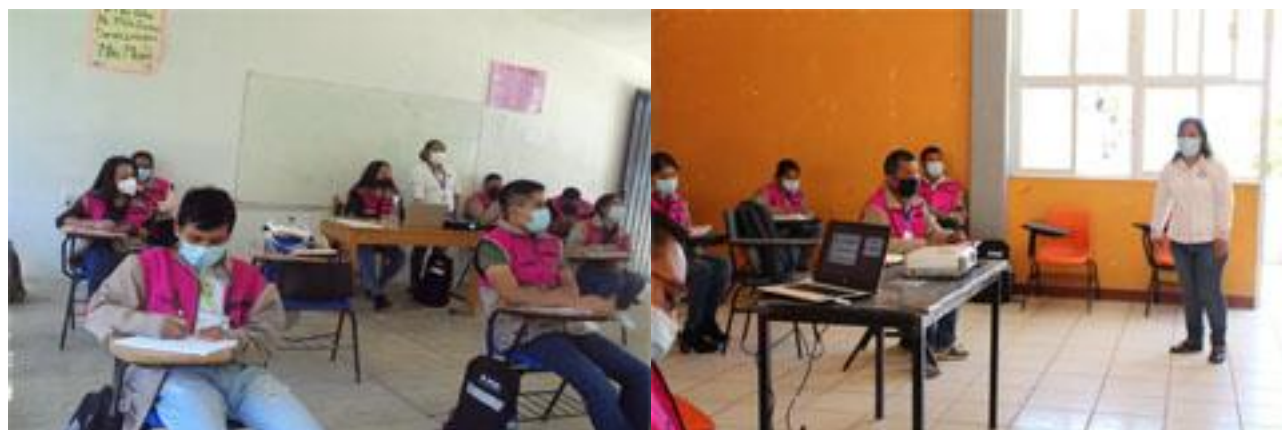
Consejo Distrital Electoral 26, participando en la primera etapa de capacitación.