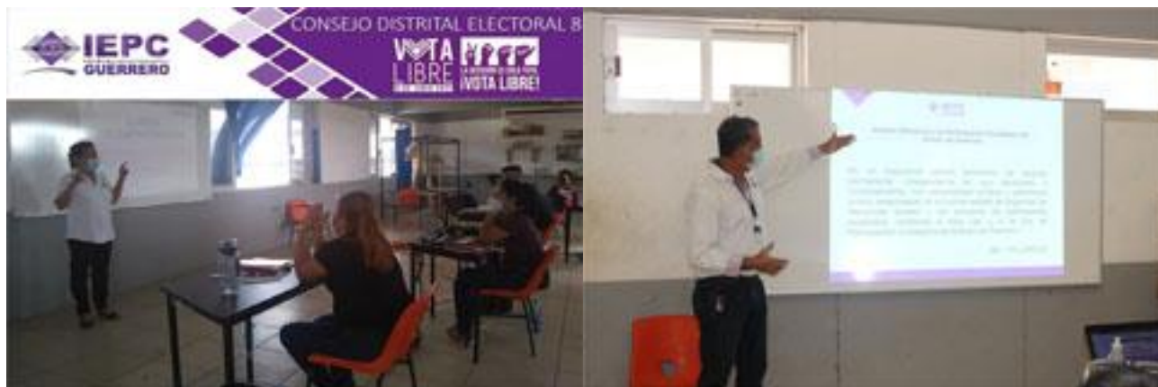
Consejo Distrital Electoral 8 y 10, participando en la primera etapa de capacitación.