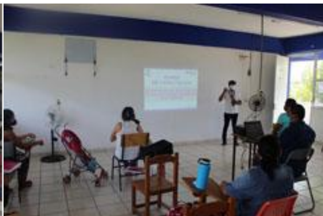
Consejo Distrital Electoral 13, participando en la primera etapa de capacitación.