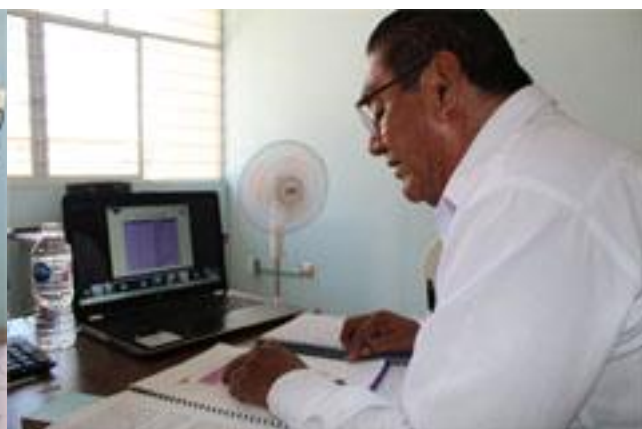
Consejo Distrital Electoral 22, participando en la primera etapa de capacitación.