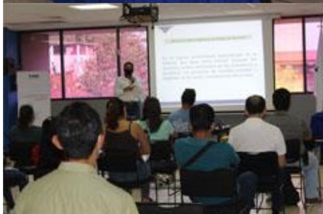
Consejos Distritales Electorales 6, 7 y 9, participando en la primera etapa de capacitación