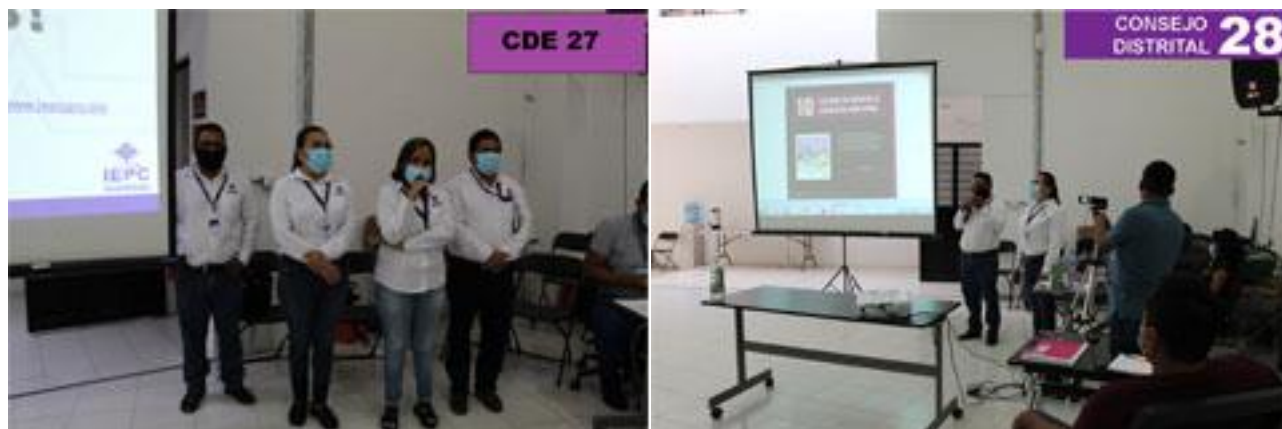
Consejos Distritales Electorales 27 y 28, participando en la primera etapa de capacitación.