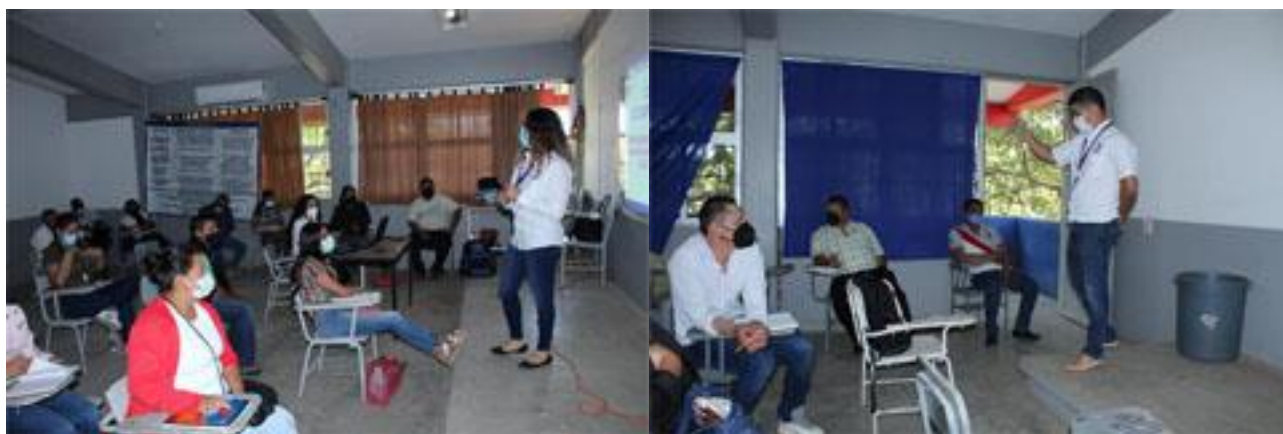
Consejo Distrital Electoral 18, participando en la primera etapa de capacitación.