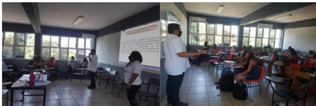
Consejo Distrital Electoral 11, participando en la primera etapa de capacitación