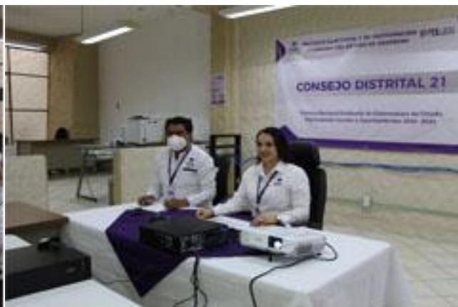
Consejo Distrital Electoral 21, participando en la primera etapa de capacitación.