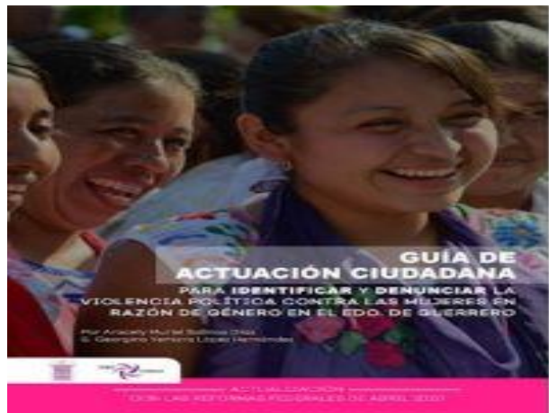
GUÍA DE ACTUACIÓN CIUDADANA PARA IDENTIFICAR Y DENUNCIAR LA VIOLENCIA POLÍTICA CONTRA LAS MUJERES EN RAZÓN DE GÉNERO EN EL ESTADO DE GUERRERO.

En la instalación de los 4 Nodos Regionales se presentaron las herramientas para instrumentar el proyecto.