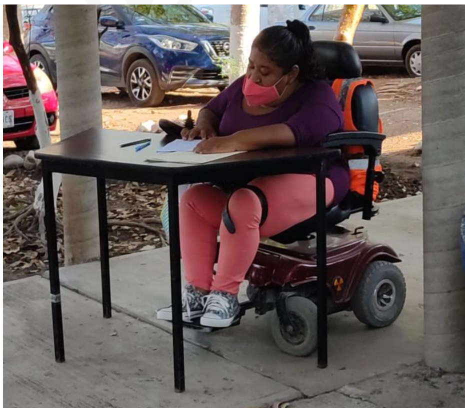
Fotografías correspondientes a la aplicación de los exámenes.