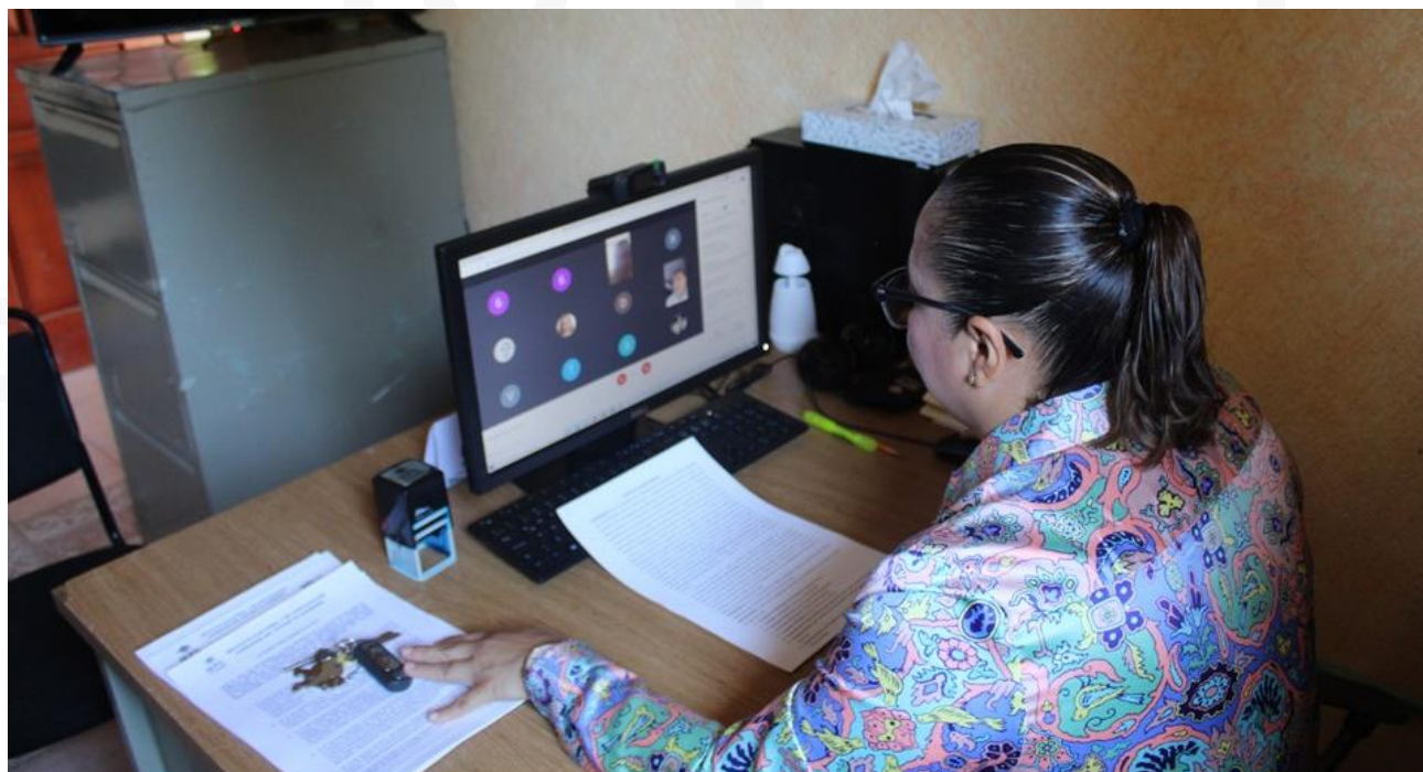
Fotografías correspondientes a las entrevistas.