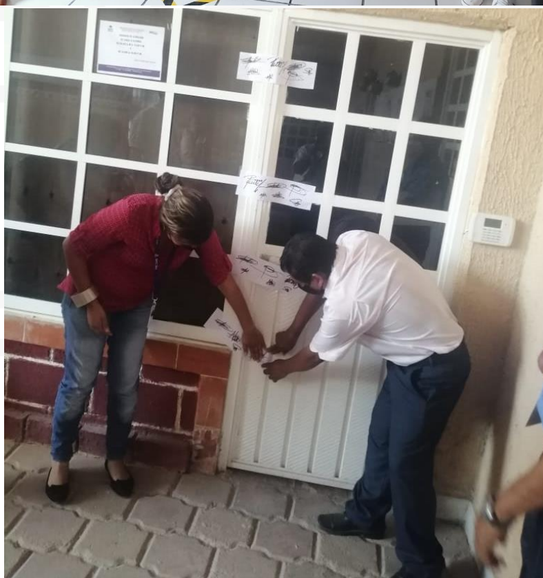
Fotografías correspondientes a la entrega y resguardo de los exámenes.