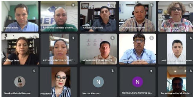
1ª Sesión Ordinaria / 19-07-2023