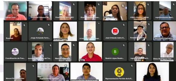
3ª Sesión Ordinaria / 27-09-2023