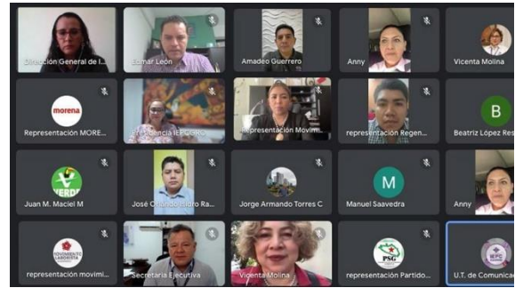
2ª Sesión Ordinaria / 22-08-2023