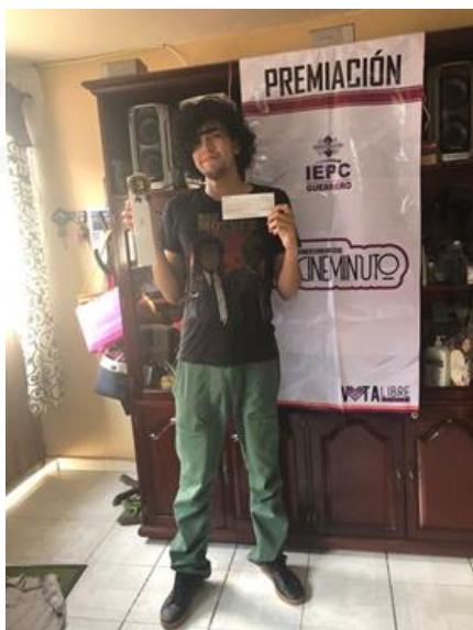
Imagen correspondiente a la entrega del premio al tercer lugar del Concurso de Cineminuto.