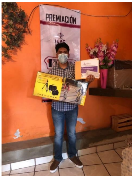
Imagen correspondiente a la entrega del premio al primer lugar del Concurso de Cineminuto.

Sin voto no hay democracia y, ¿sin democracia?... ¡piénsalo! La decisión es solo tuya, ¡Vota libre!