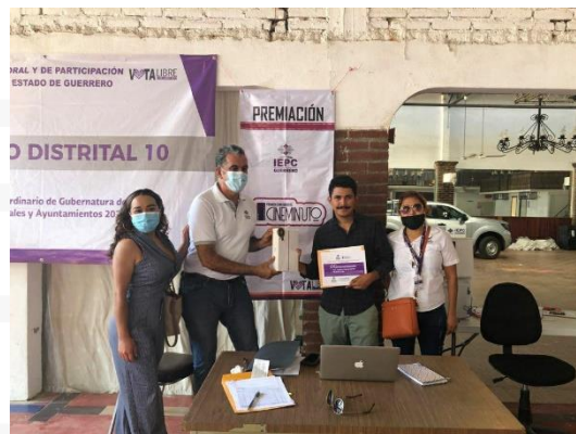
Imagen correspondiente a la entrega del premio al segundo lugar del Concurso de Cineminuto.