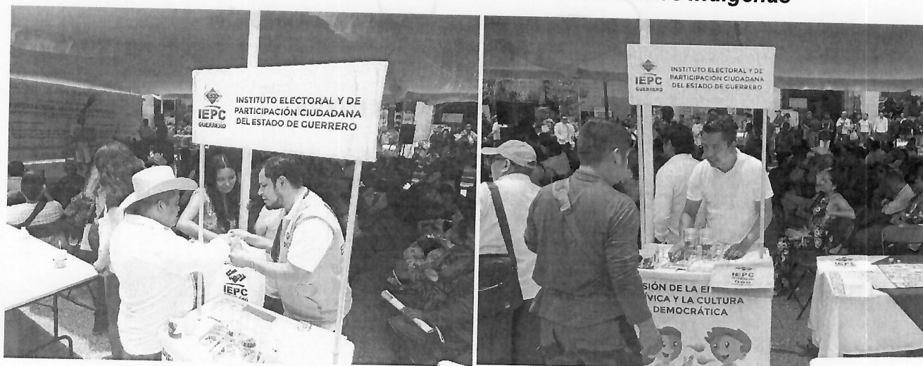
Explicación de las actividades implementadas por el IEPCGro a la ciudadanía interesada, el día 7 de agosto.