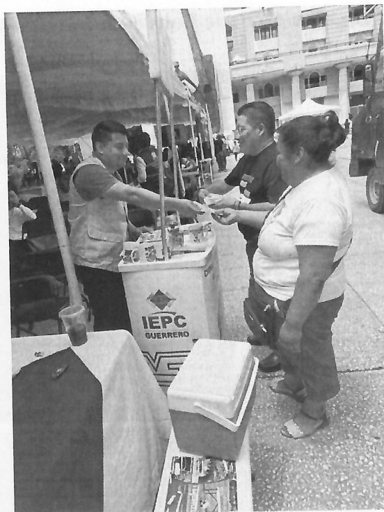
Explicación de las actividades implementadas por el IEPCGro a la ciudadanía interesada, el día 8 de agosto.