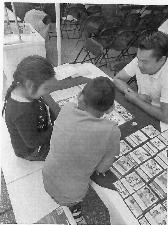
Implementación de juegos didácticos por el IEPCGro a la niñez asistente, el día 7 de agosto.