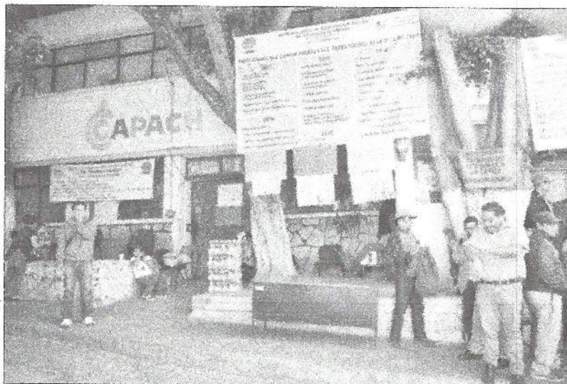
Protesta en Chilpancingo de trabajadores de Capach aglutinados en el Suspeg