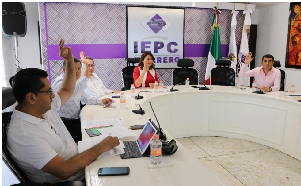
Fotografía 6. Tercera Sesión Ordinaria del Comité de Transparencia y Acceso a la Información del IEPC, celebrada el doce de marzo del dos mil diecinueve, en la cual se presentó el Informe mensual de las solicitudes de información recibidas en el mes de febrero del dos mil diecinueve.