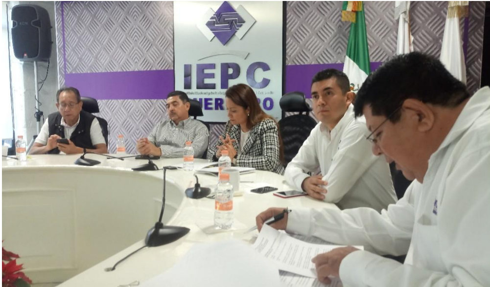
Fotografía 1. Primera Sesión Ordinaria del Comité de Transparencia y Acceso a la Información del IEPC, celebrada el once de enero del dos mil diecinueve, en la cual se presentó el Informe mensual de solicitudes de información, correspondiente al mes de diciembre dos mil dieciocho, que presentó la Unidad Técnica de Transparencia y Acceso a la Información.

En el presente apartado se agregan diversas fotografías correspondientes a las actividades institucionales en las que la Contraloría Interna ha participado durante este periodo.