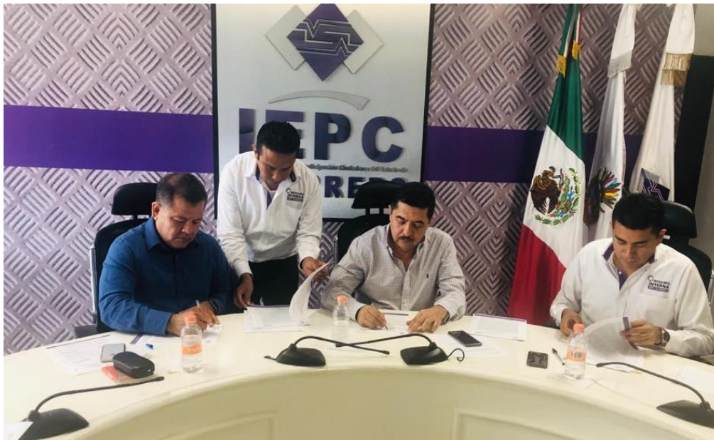
Fotografía 4. Acto protocolario de inicio de la Auditoría al segundo semestre 2018, celebrado el día veintiocho de febrero del dos mil diecinueve.