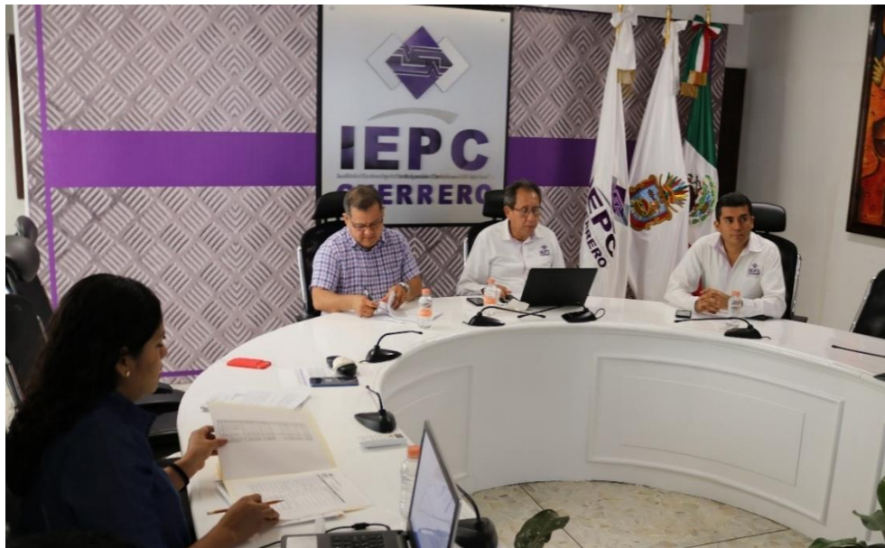
Fotografía 8. Cuarta Sesión Extraordinaria del Comité de Adquisiciones, Arrendamientos y Servicios del IEPC, celebrada el veintinueve de abril del dos mil diecinueve, en la cual se analizó el Acuerdo 005/CAAS/29-04-2019, por el que se aprueba la adjudicación directa para la adquisición de vales, tarjetas electrónicas, monederos electrónicos o certificados de despensa y tarjetas de regalo.