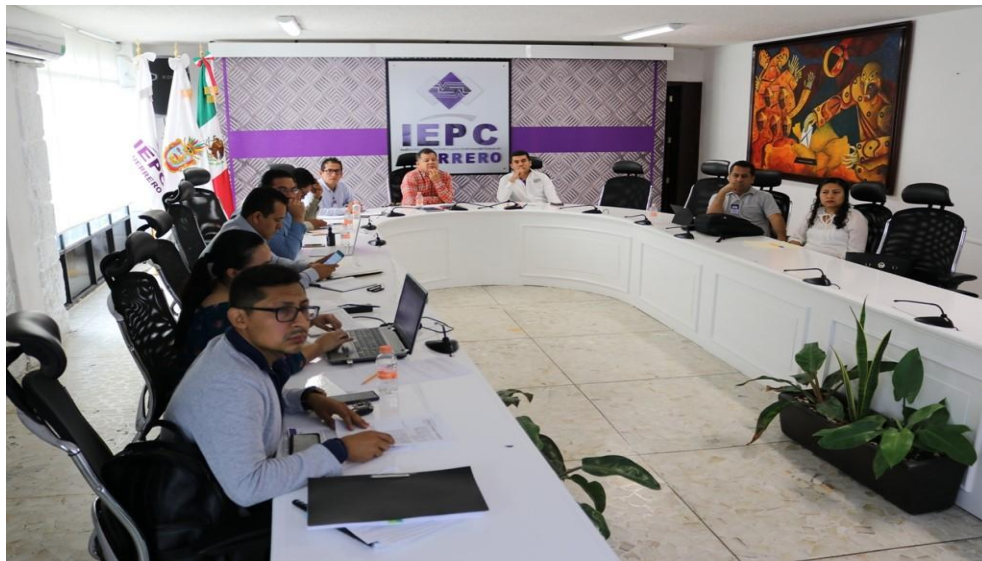
Fotografía 12. Segunda Sesión Ordinaria del Comité Técnico de Archivo del IEPC, celebrada el veinticuatro de junio del dos mil diecinueve, en la cual se presentó el informe 002/SO/17-06-2019, relativo a la gestión del Curso-Taller "Prevención de incendios y uso de extintores" dirigida a los integrantes del Comité Técnico de Archivo, responsables del archivo de trámite, concentración e histórico del IEPC Guerrero.