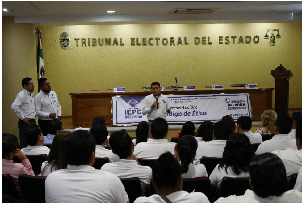
Fotografía 7. La Contraloría Interna presentó el Código de Ética del Instituto Electoral y de Participación Ciudadana del Estado de Guerrero, que tiene como objetivo incidir con el comportamiento y desempeño de las y los servidores públicos de este Instituto Electoral, el día veintiséis de marzo del dos mil diecinueve.