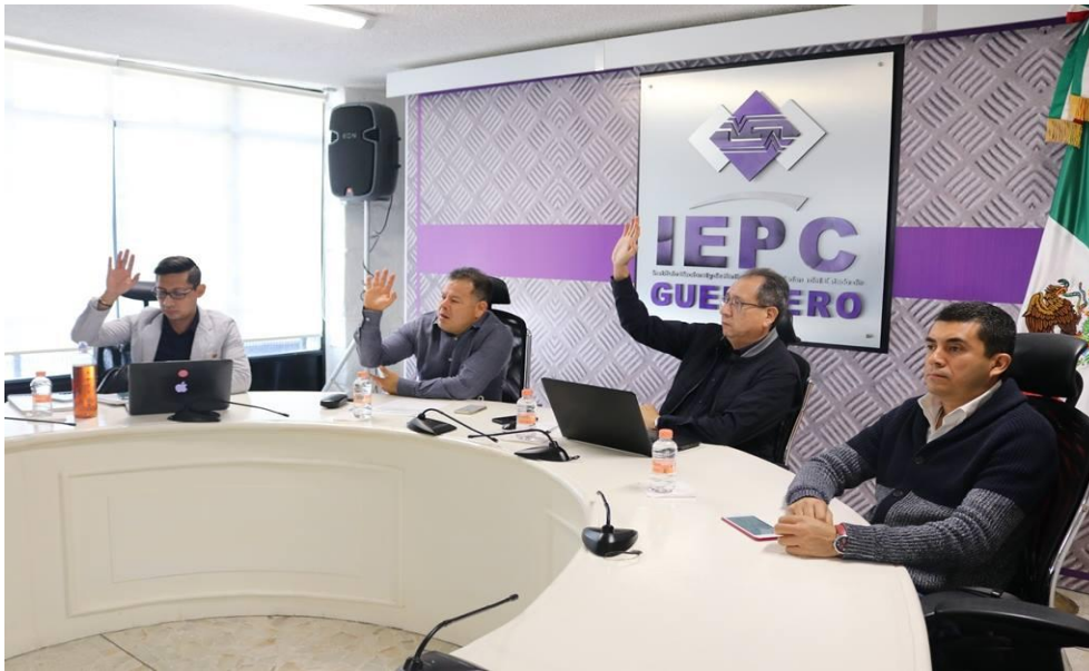
Fotografía 3. Primera Sesión Ordinaria del Comité de Adquisiciones, Arrendamientos y Servicios del IEPC, celebrada el treinta de enero del dos mil diecinueve, en la cual se analizó el Acuerdo 001/CAAS/30-01-2019 por el que se aprobó el Programa Anual de Adquisiciones del IEPC Guerrero.