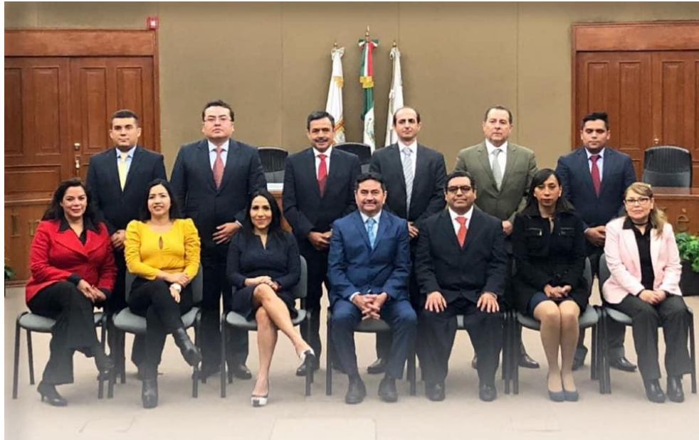
Fotografía 22. Asistencia al evento denominado “Combate a la Corrupción desde la Justicia Administrativa y la Plataforma Digital Nacional” celebrado el día nueve de diciembre del dos mil diecinueve, evento que realizó la Asociación de Contralores de Institutos Electorales de México A.C.