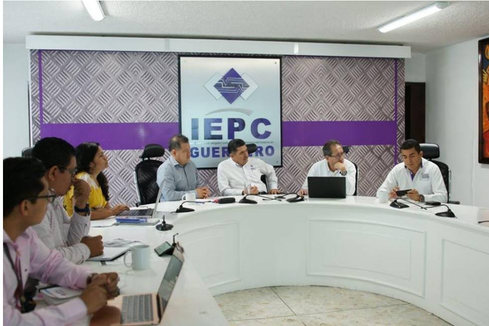
Fotografía 11. Reunión de la Junta Estatal en la que se analizó la modificación al Programa Operativo Anual y al Presupuesto de Ingresos y Egresos del Instituto Electoral para el ejercicio fiscal, celebrada el día dieciséis de octubre de dos mil diecinueve.