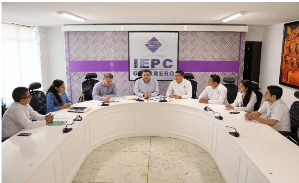
Fotografía 19. Reunión de trabajo en la que se levantó el acta con la que da inicio la revisión de la Contraloría Interna, a efecto de verificar los recursos ingresados y ejercidos correspondientes al periodo de enero a junio de dos mil diecinueve, celebrado el día veinticinco de noviembre del dos mil diecinueve.