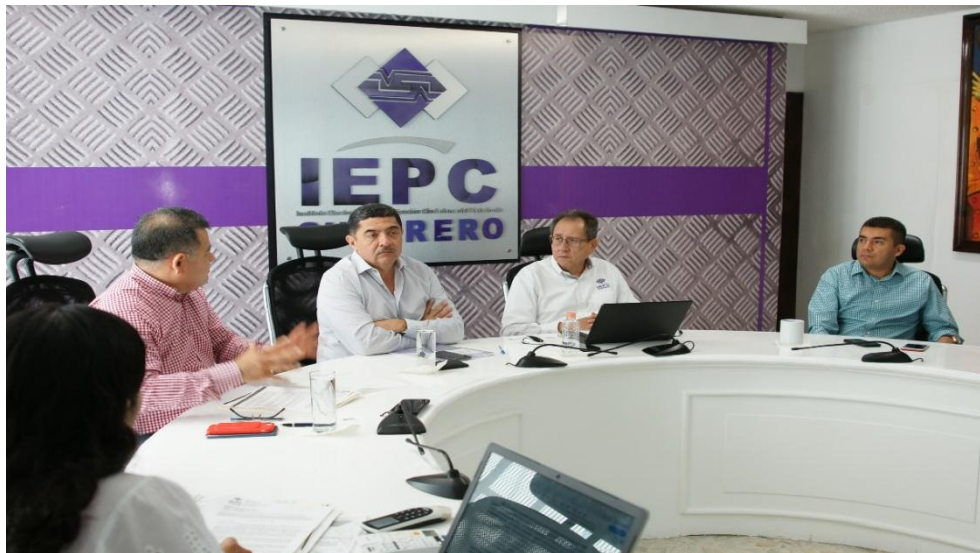
Fotografía 14. Séptima Sesión Ordinaria del Comité de Adquisiciones, Arrendamientos y Servicios del IEPC, celebrada el quince de agosto del dos mil diecinueve, en la cual se analizó el acuerdo 011/CAAS/00-08-2019, por el que no se aprobó la donación a título gratuito de la documentación electoral sujeta para su destrucción a la Comisión Nacional de libros de texto gratuitos para su reciclamiento.