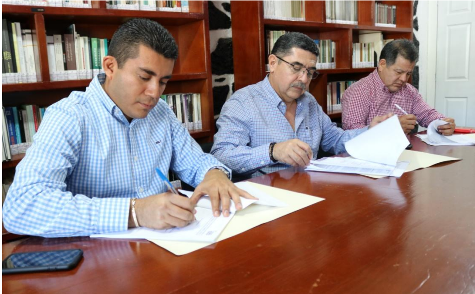
Fotografía 23. Reunión de trabajo de la Contraloría Interna para notificar las observaciones con motivo de la revisión de los ingresos y egresos, correspondientes al periodo julio-diciembre 2018, celebrada el día diecisiete de diciembre del dos mil diecinueve.