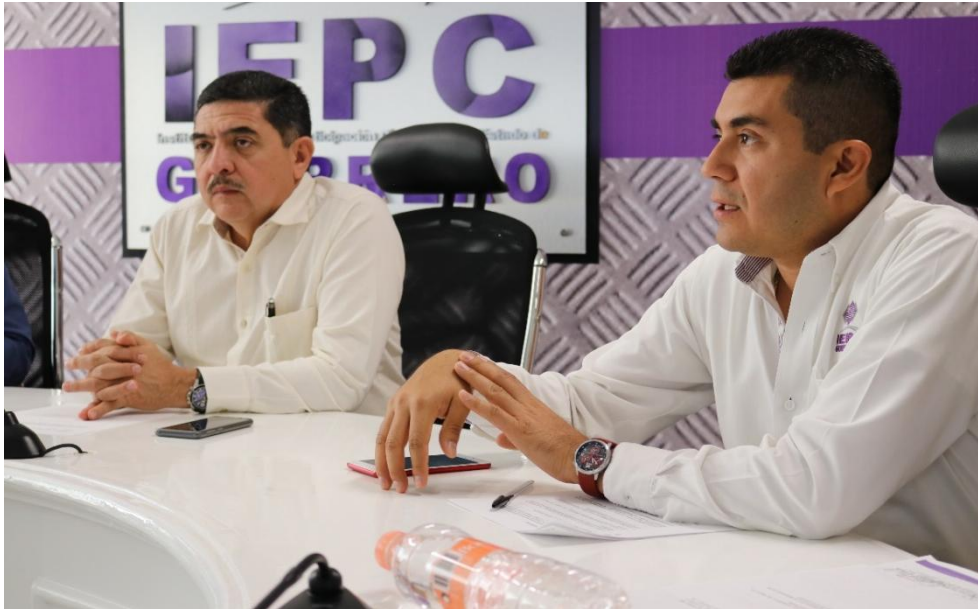
Fotografía 9. Quinta Sesión Ordinaria de la Junta Estatal del IEPC, celebrada el día veintidós de mayo del dos mil diecinueve, en la que se Informó lo relativo al seguimiento del convenio modificador del Seguro de Separación Individualizado, contratado con la empresa MetLife.