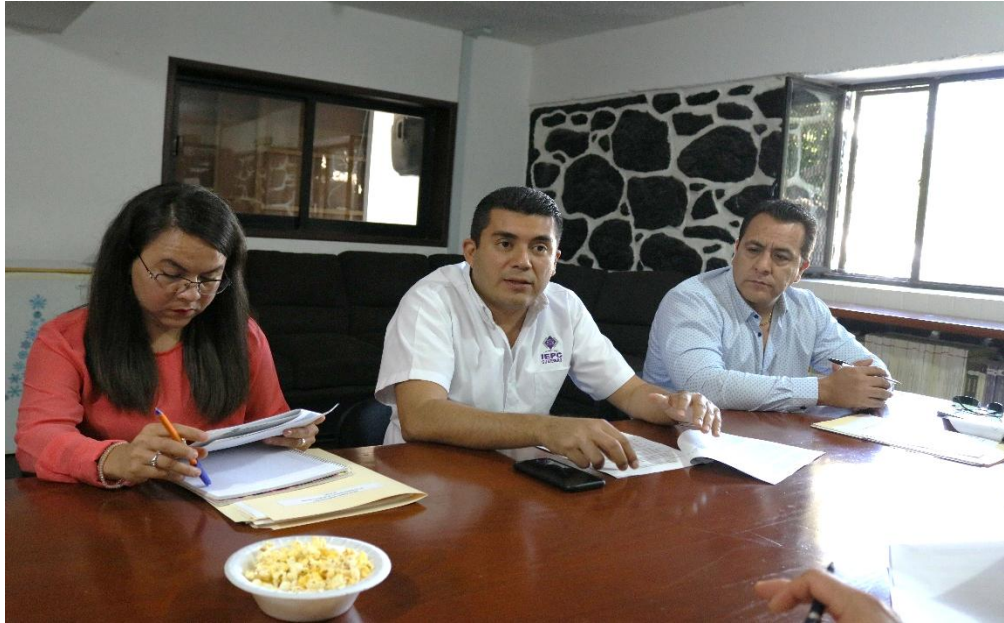
Fotografía 20. Tercera Sesión Ordinaria del Comité Técnico de Archivo del IEPC, celebrada el veintiséis de noviembre del dos mil diecinueve, en el que se presentó el informe 004/SO/CTA/22-11-2019, relativo a las acciones implementadas en el cumplimiento de la Ley General de Archivo.