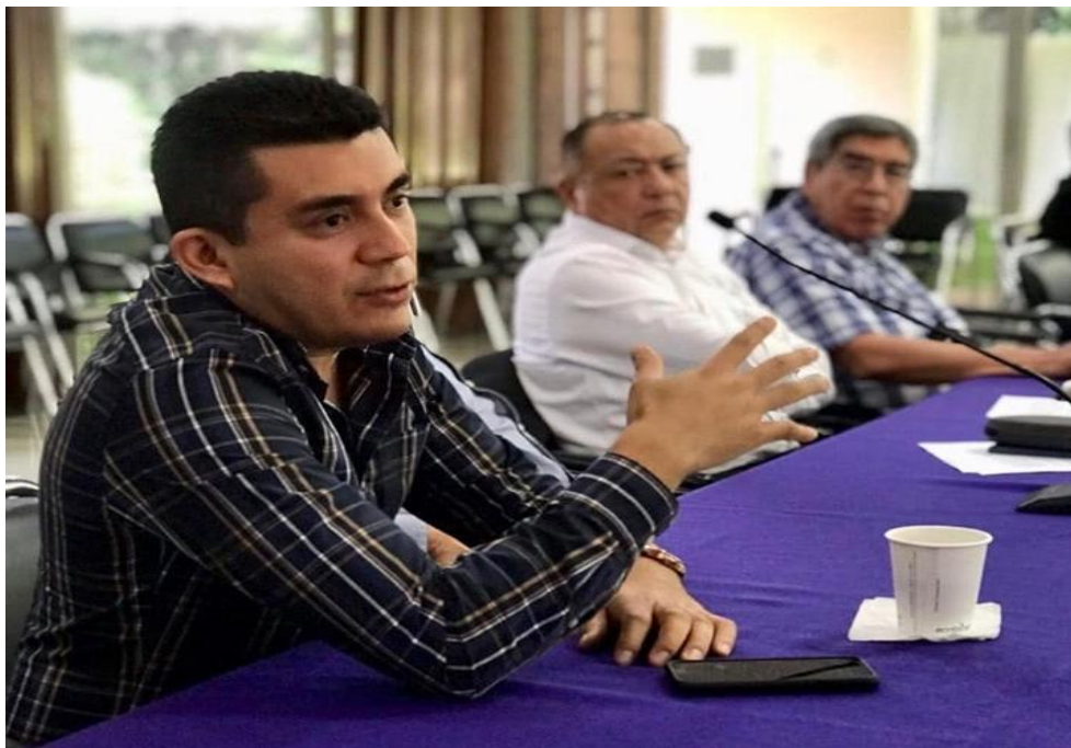
Fotografía 10. Asistencia a la Reunión de trabajo de la Asociación de Contralores Internos de Institutos Electorales de México, A.C. (ACIEM) para definir un posicionamiento en torno a las iniciativas de reforma electoral, Celebrado el día diecisiete de junio del dos mil diecinueve, en las instalaciones del Instituto Electoral de la Ciudad de México.