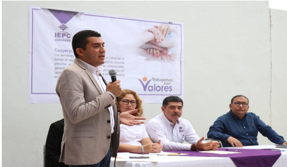
Fotografía 18. En la presentación del arranque de la campaña interna denominada “Trabajemos con Valores”, celebrado el dieciséis de octubre del dos mil diecinueve, con el objetivo de concientizar e invitar al personal a ser parte de una cultura laboral que tenga bases sólidas con valores para generar ambientes laborales sanos y libres de violencia en este Instituto Electoral.