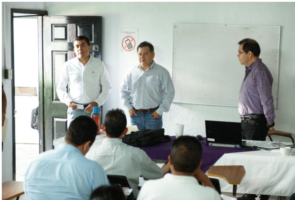
Fotografía 21. Presentación del Curso-Taller denominado “Archivística Y Elaboración de los Instrumentos de Control Archivístico” celebrado el día tres de diciembre del dos mil diecinueve.