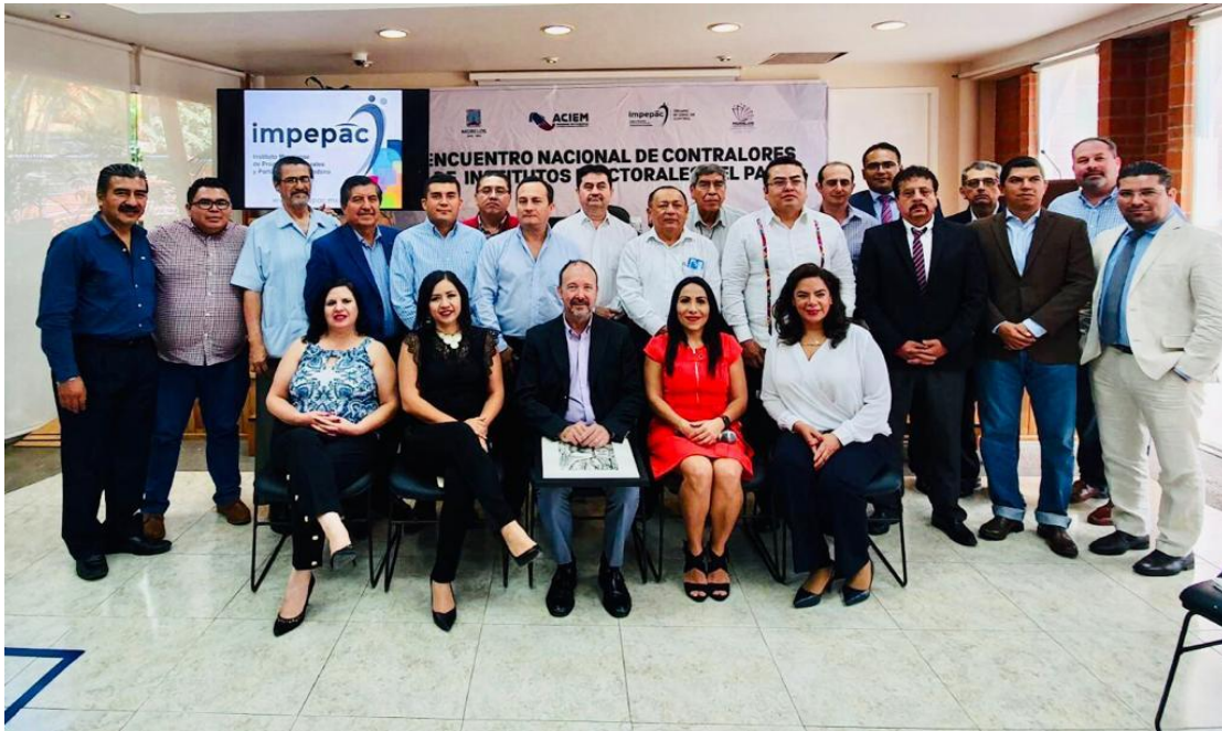
Fotografía 16. Asistencia al Taller denominado “Responsabilidades en el Servicio Público conforme al Sistema Nacional Anticorrupción”, los días tres y cuatro de octubre del dos mil diecinueve, organizado por la Asociación de Contralores de los Institutos Electorales de México (ACIEM A.C.).