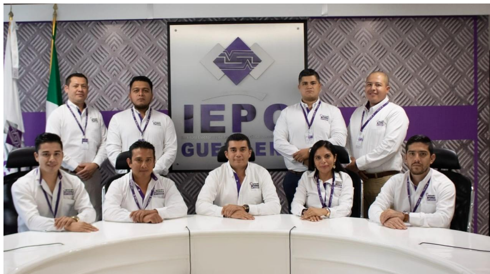
Fotografía 24. Personal adscrito a la Contraloría Interna del Instituto Electoral y de Participación Ciudadana del Estado de Guerrero.