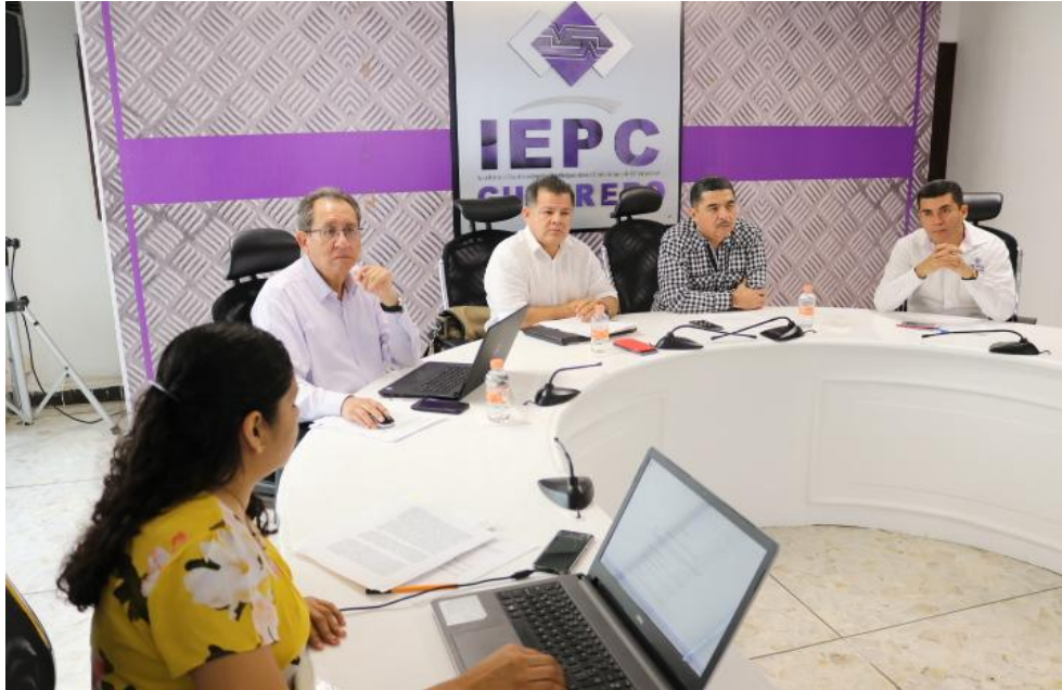
Fotografía 13. Séptima Sesión Ordinaria de la Junta Estatal del IEPC, celebrada el día nueve de julio del dos mil diecinueve, en la cual se presentó propuesta de modificación al Programa Operativo Anual, así como al Presupuesto de Ingresos y Egresos del IEPC Guerrero.