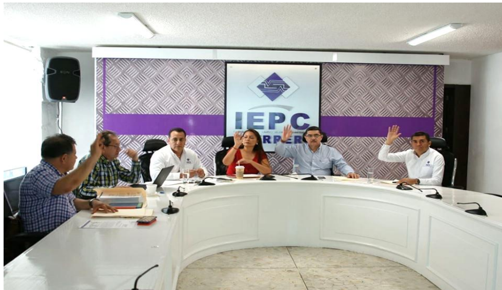
Fotografía 17. Décima Sesión Ordinaria del Comité de Transparencia y Acceso a la Información del IEPC, celebrada el ocho de octubre del dos mil diecinueve, en la cual se presentó el Informe mensual de las solicitudes de información recibidas en el mes de septiembre de dos mil diecinueve.