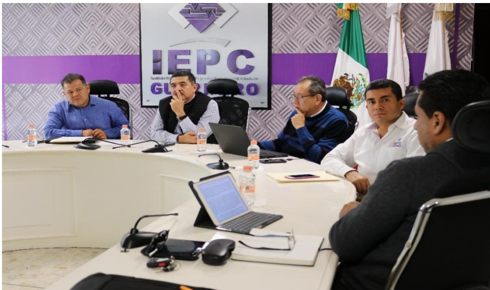
Fotografía 2. Primera Sesión Ordinaria de la Junta Estatal del IEPC, celebrada el día veintinueve de enero del dos mil diecinueve, en la cual se analizó la propuesta de Lineamientos para la integración y presentación de los informes Financieros Semestrales y el anual del IEPC Guerrero.