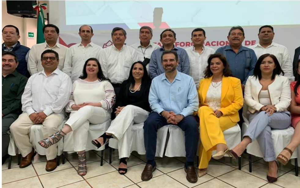
Fotografía 5. Con el Dr. Lorenzo Córdova Vianello, Presidente del Instituto Nacional Electoral y Contralores de Institutos Electorales de México, en el Octavo Foro Nacional denominado “Ética y Responsabilidad en la Observancia del Sistema Nacional Anticorrupción” celebrado los días siete y ocho de marzo del dos mil diecinueve, en las instalaciones del Instituto Estatal Electoral de Baja California Sur, organizado por la Asociación de Contralores de Institutos Electorales de México (ACIEM, A.C.).