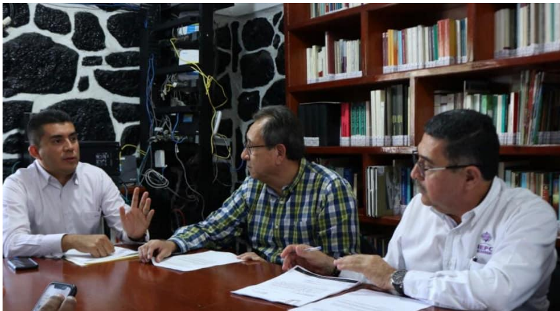
Fotografía 15. Reunión de la Junta Estatal en la cual se aprobó el acuerdo 002/JE/11-12-2019, por el que se aprobó el calendario de días de descanso obligatorio y periodos vacacionales del Instituto Electoral para el ejercicio fiscal 2020, celebrada el once de diciembre de dos mil diecinueve.