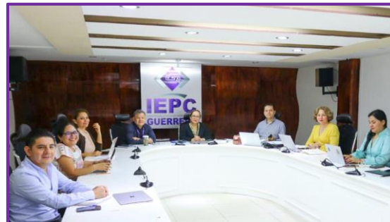
Reunión de trabajo de Consejeras y Consejeros Electorales del IEPC Guerrero.