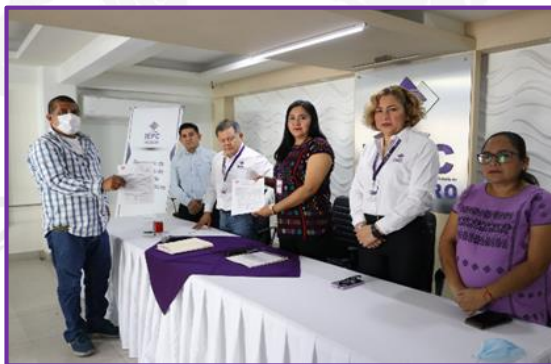
Entrega de solicitud para constituirse como partido político de la organización ciudadana Guerrero Pobre, A.C.