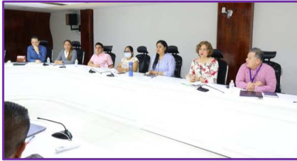
Reunión de trabajo con integrantes del Consejo Municipal Comunitario de Ayutla de los Libres, Guerrero.