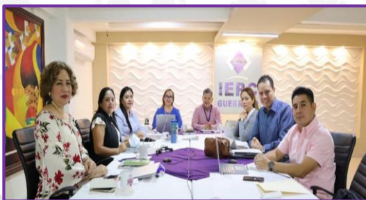
Reunión de trabajo de Consejeras y Consejeros Electorales del IEPC Guerrero.