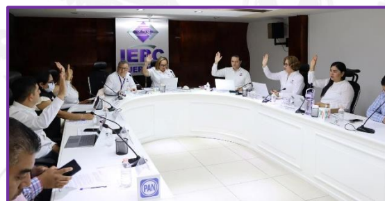
Décima Primera Sesión Ordinaria del Consejo General del IEPC Guerrero.