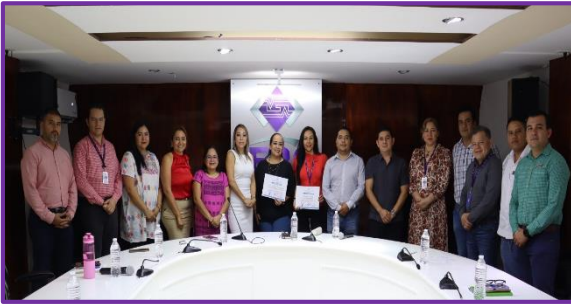
Entrega de reconocimiento del Instituto de Transparencia y Acceso a la Información y Protección de Datos Personales al IEPC Guerrero, por haber obtenido un porcentaje de cumplimiento del 94.23.