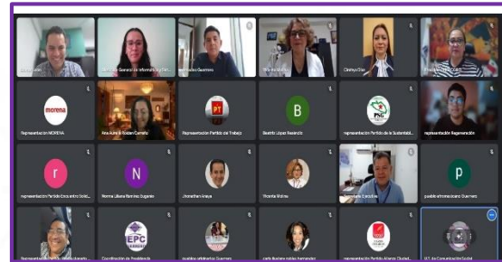
Décima Segunda Sesión Ordinaria de la Comisión Especial de Seguimiento, Implementación y Operación del Programa de Resultados Electorales Preliminares. PREP.