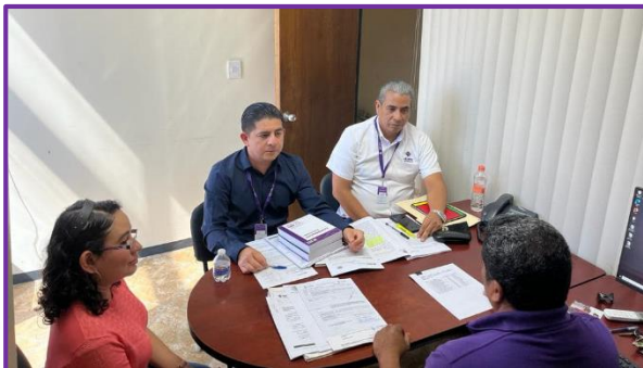
Curso: Avisos de Privacidad y Verificación de la Información en la Plataforma Nacional de Transparencia