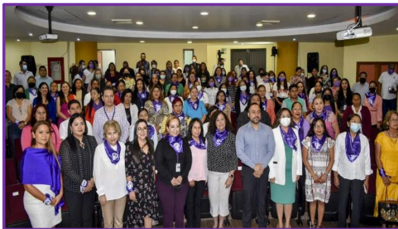
Conferencia: Avances, obstáculos y Desafíos de la participación política de las Mujeres en Guerrero.