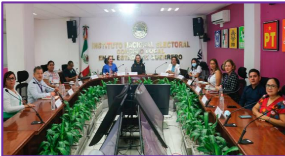
Reunión de trabajo con el Vocal Ejecutivo del Instituto Nacional Electoral en Guerrero