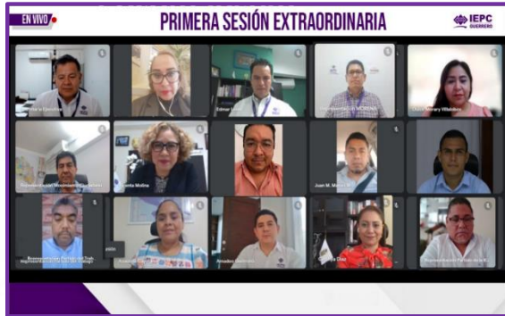
Primera Sesión Extraordinaria del Consejo General del IEPC Guerrero

Finalmente, se insertan diversas fotos que dan cuenta de mi asistencia a diferentes reuniones de trabajo, actividades y eventos institucionales.