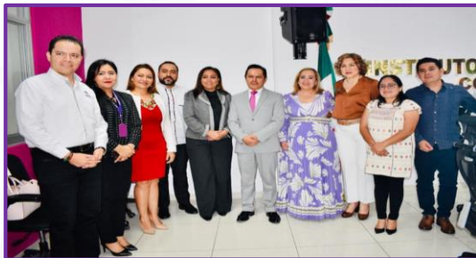
Instalación del Consejo Local del Instituto Nacional Electoral en Guerrero.