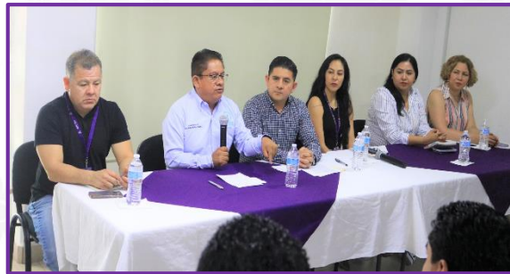
Cabildo Infantil realizado en el Ayuntamiento del Municipio de Chilpancingo de los Bravo, Guerrero.