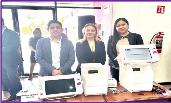
Exposición: Tecnología aplicada para procesos electorales y de participación ciudadana, desarrollado por el Instituto Nacional Electoral.