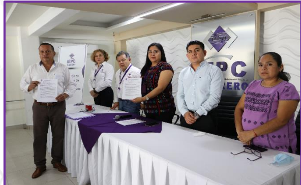
Entrega de solicitud para constituirse como partido político de la organización ciudadana Encuentro Solidario Guerrero, A.C.