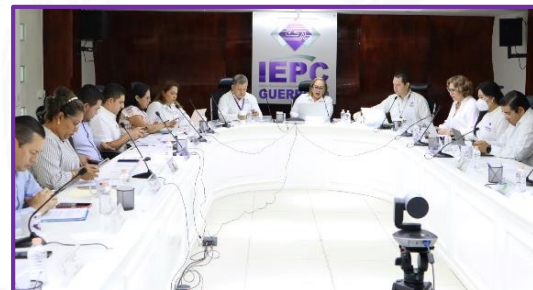
Décima Sesión Ordinaria del Consejo General del IEPC Guerrero.