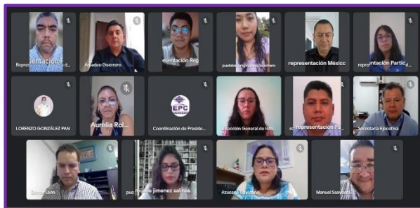
Décima Segunda Sesión Ordinaria de la Comisión Especial de Seguimiento al Desarrollo de Sistemas Informáticos Institucionales.