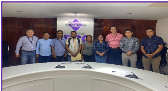
Reunión de trabajo con ciudadanía del Municipio Ñuu Savi, Guerrero.