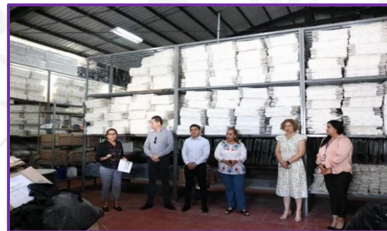
Asistencia a la bodega del IEPC Guerrero