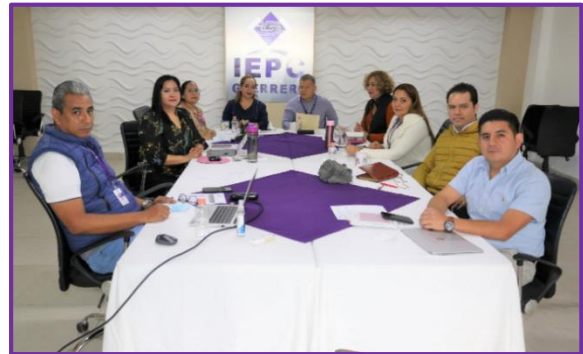
Reunión de trabajo de Consejeras y Consejeros Electorales.