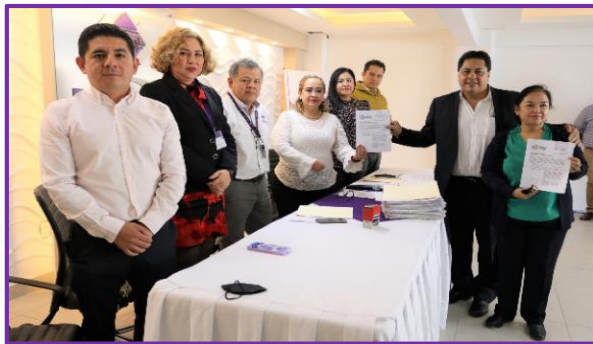
Entrega de solicitud para constituirse como partido político de la organización ciudadana Juntos Avanzamos, A.C.