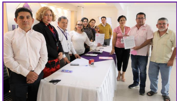
Entrega de solicitud para constituirse como partido político de la organización ciudadana Vamos con más Fuerza por Guerrero, A.C.