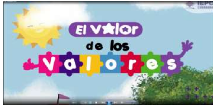
Presentación del nuevo video de la historieta "El Valor de los Valores"