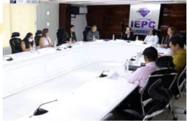
Firma del convenio de colaboración entre el Instituto Electoral y de Participación Ciudadana del Estado de Guerrero y Mujeres de Tlapa A.C.