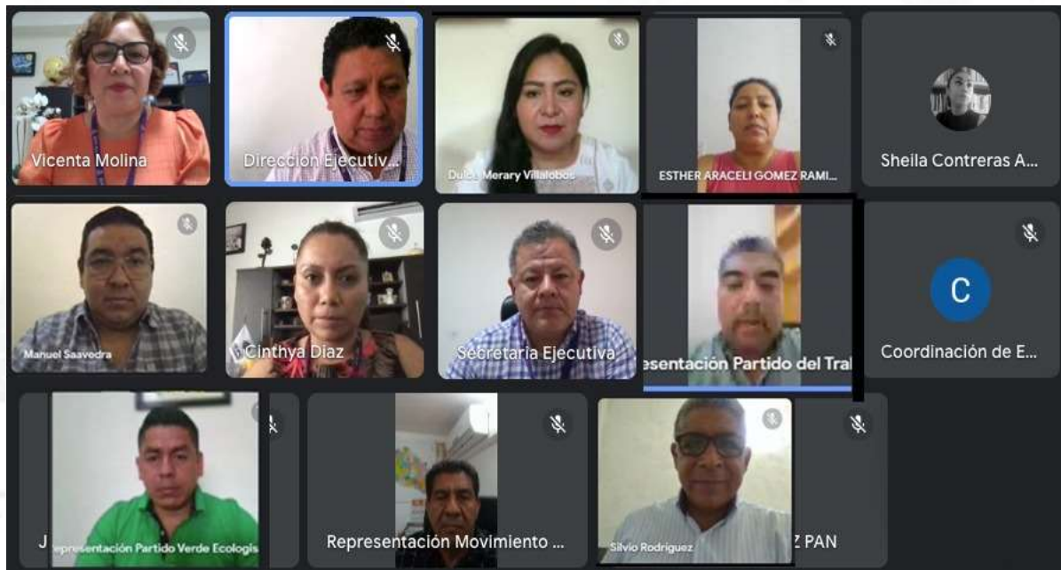
Sexta Sesión Ordinaria de la Comisión de Educación Cívica y Participación Ciudadana (19-junio-2023)