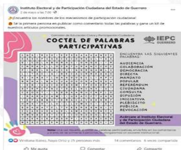
Juegos por la democracia participativa