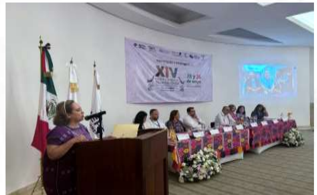
Organización del XIV Encuentro Nacional de Educación Cívica (ENEC) realizado los días 25 y 26 de mayo de 2023, en la ciudad y puerto de Acapulco, Guerrero.