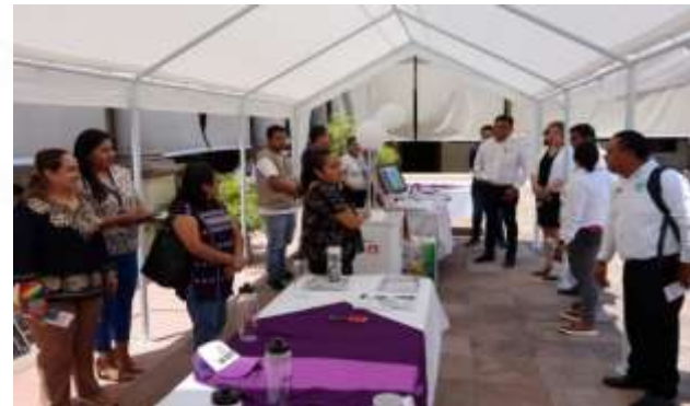
Primera feria de divulgación de la ciencia y la democracia, a invitación del consejo de ciencia, tecnología e innovación del estado de guerrero