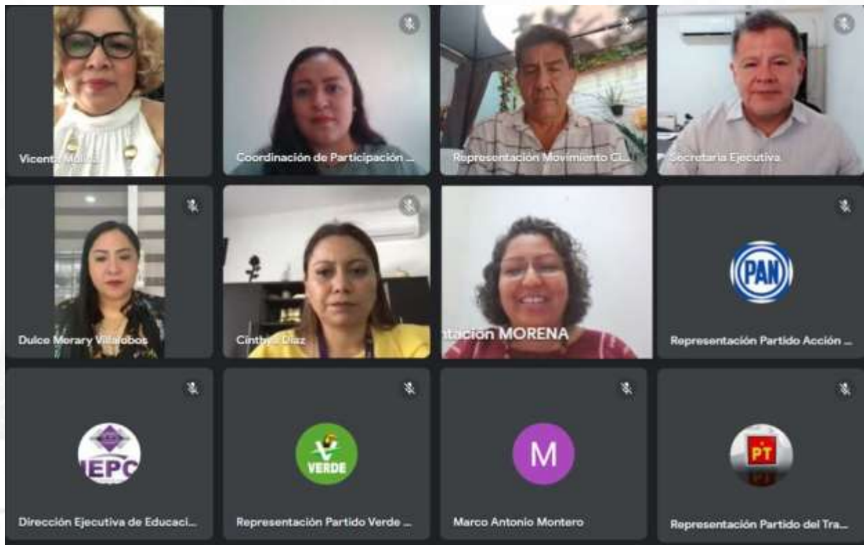
Segunda Sesión Ordinaria de la Comisión de Educación Cívica y Participación Ciudadana (16-febrero-2023)