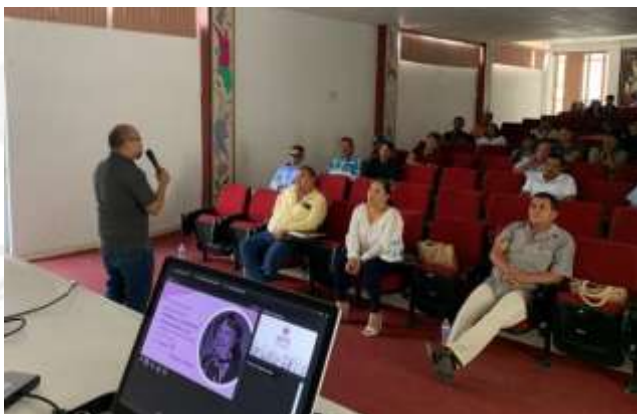
Impartición del taller "Yo decido"