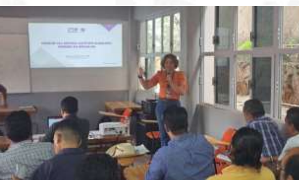
Capacitación al personal de H. Ayuntamiento de Taxco de Alarcón.