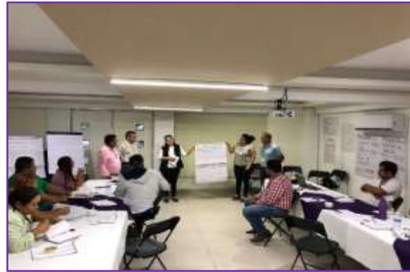
Taller de Formación de Facilitadores del Aprendizaje Impartido por la Coordinación General de Fortalecimiento Municipal al Personal del IEPC Guerrero