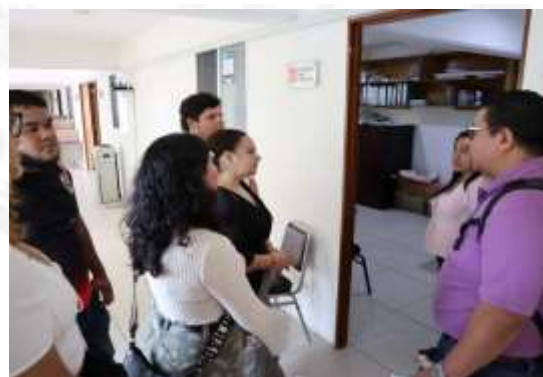
Visita guiada y plática en el IEPC guerrero para las y los alumnos de la Universidad Loyola del Pacifico de Acapulco de las Licenciaturas en Comunicación y Mercadotecnia