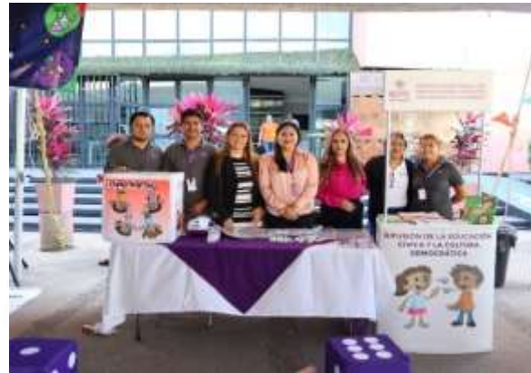
Primer Festival de Infancias y Adolescencias por la Paz.