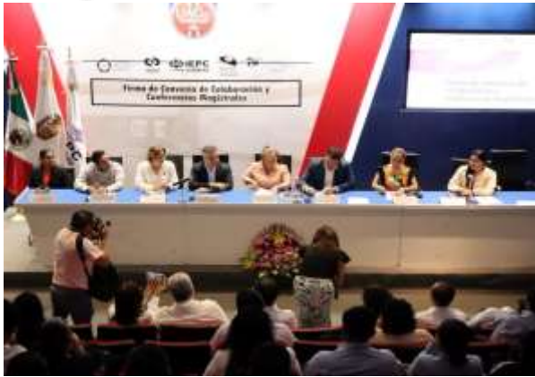
Firma de convenio entre el IEPC Guerrero y el Comité de Participación Ciudadana del Sistema Estatal Anticorrupción y dos Conferencias Magistrales.