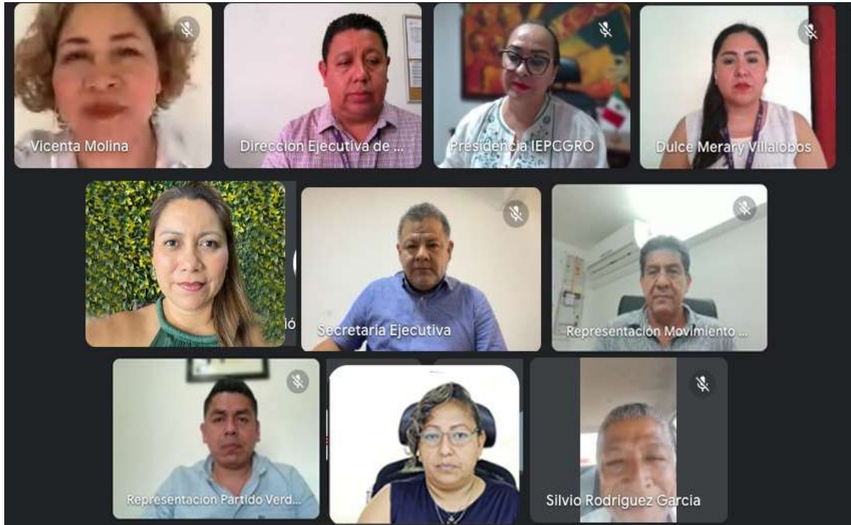
Quinta Sesión Ordinaria de la Comisión de Educación Cívica y Participación Ciudadana (22-mayo-2023)