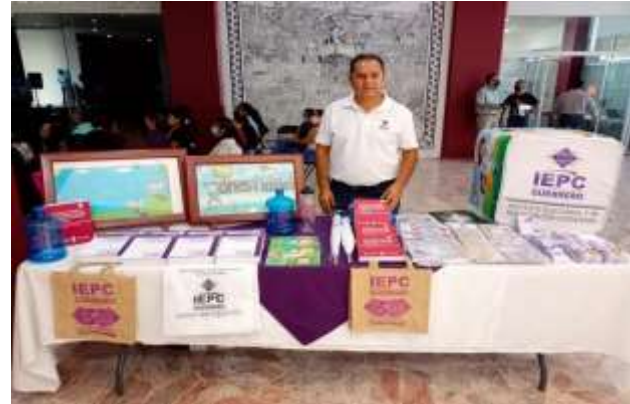
Stands informativos instalado durante la conferencia: "Atención y prevención de la violencia hacia las mujeres con énfasis al ejercicio de los derechos políticos" Chilpancingo, Gro.