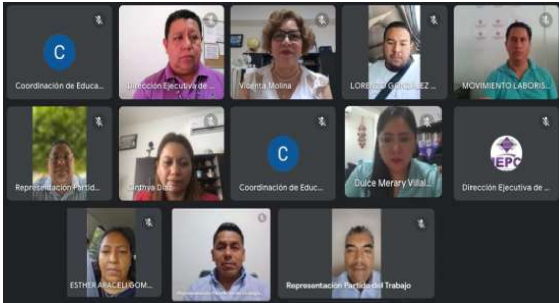
Séptima Sesión Ordinaria de la Comisión de Educación Cívica y Participación Ciudadana (12-julio-2023)