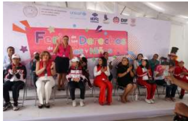
Feria de los derechos de las niñas, niños y adolescentes” convocada por el H. Congreso del Estado de Guerrero