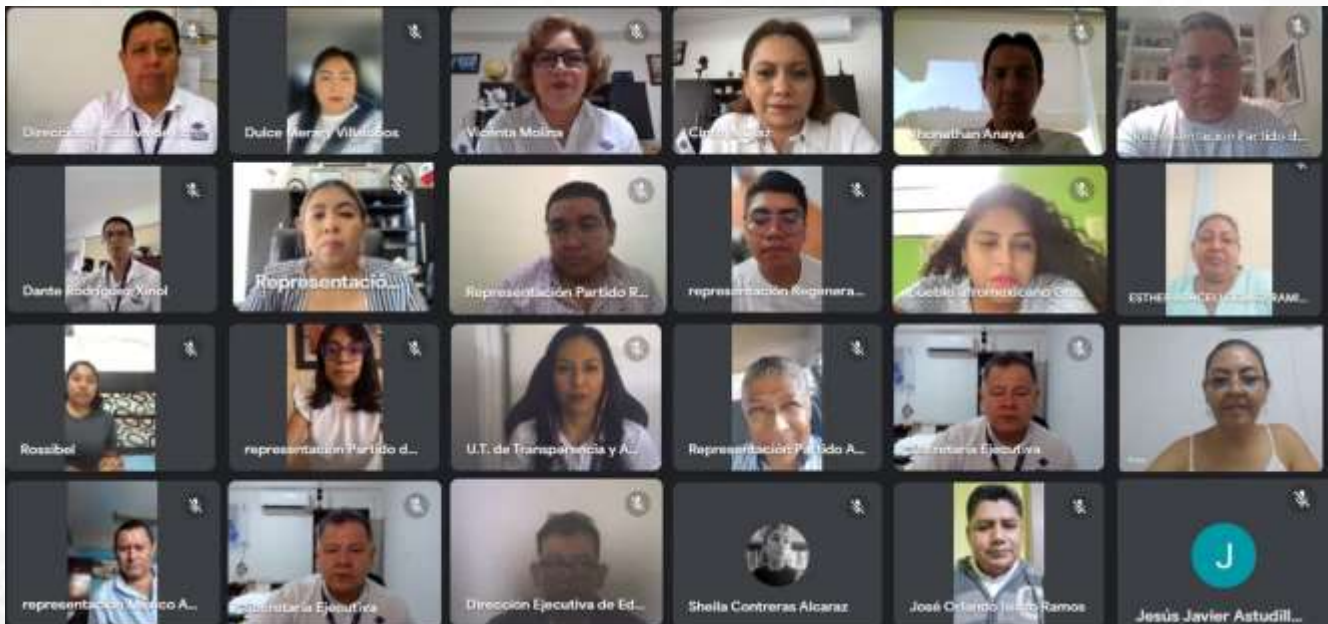
Décima Primera Sesión Ordinaria de la Comisión de Educación Cívica y Participación Ciudadana (27-noviembre-2023)