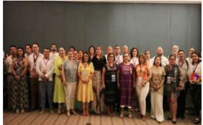
Mesa 4: La Educación Cívica y la Participación Ciudadana en los Procesos Electorales. 25 de mayo de 2023.