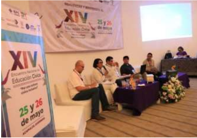
Mesa 1. La Educación Cívica y Construcción de Ciudadanía. 25 de mayo de 2023