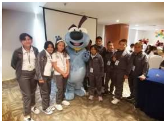
Actividades vinculadas con la junta local ejecutiva del INE en guerrero relacionada con el 12 parlamento de niñas y niños de México