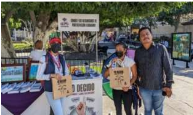
Colocación de stands informativos y dinámica de "Ruleta participativa"