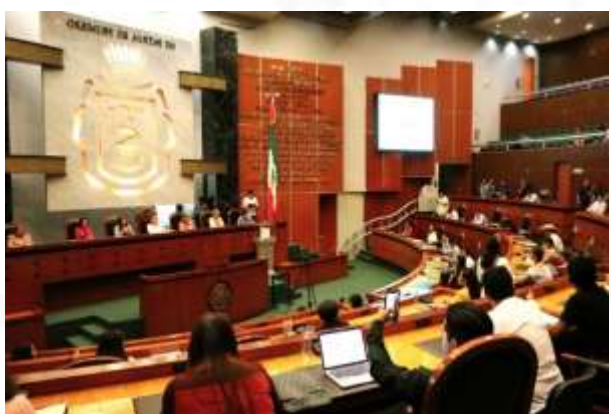
Parlamento Juvenil 2023.