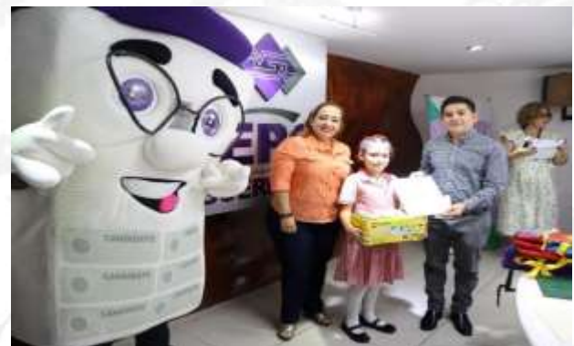
Segundo concurso de cuento infantil 2023.