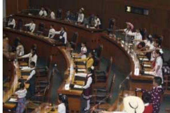
XV Parlamento Infantil 2023