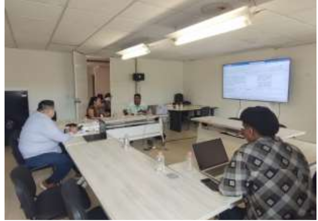
Apoyo técnico al congreso del estado de guerrero