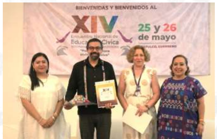
Presentación de la Publicación “Acciones afirmativas” En relación a la participación política de personas indígenas y afromexicanas en cargos de elección popular. 26 de mayo de 2023.