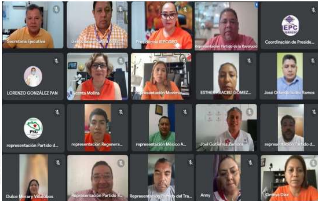
Octava Sesión Ordinaria de la Comisión de Educación Cívica y Participación Ciudadana (25-agosto-2023)