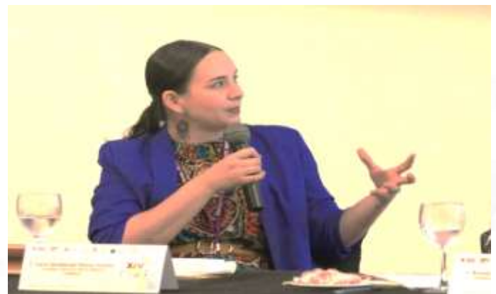
Mesa 5: Estrategias de Educación Cívica para la Atención a Grupos Prioritarios. 26 de mayo de 2023.