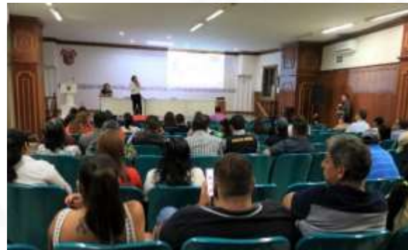
Actividades vinculadas al proyecto de Promoción de la Participación Ciudadana Incluyente