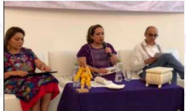
Conversatorio “Prospectiva y Desafíos del Proceso Electoral 2023-2024”