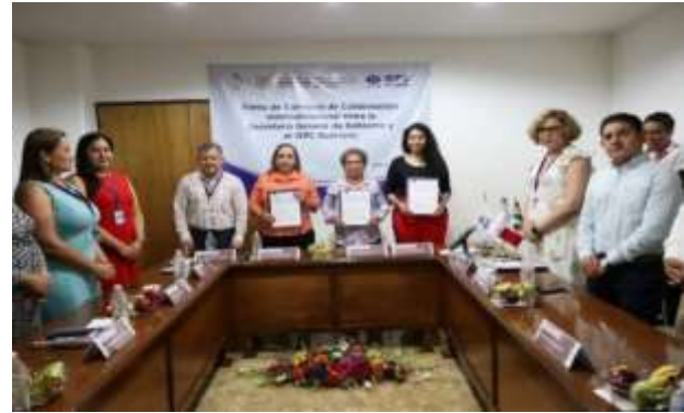
Convenio de colaboración ente el IEPC Guerrero y la Secretaría General de Gobierno, asistida por la Coordinación General de Fortalecimiento Municipal (FORTAMUN)