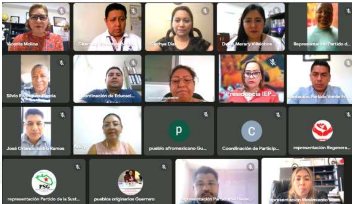
Primera Sesión Extraordinaria de la Comisión de Educación Cívica y Participación Ciudadana (29-septiembre-2023)