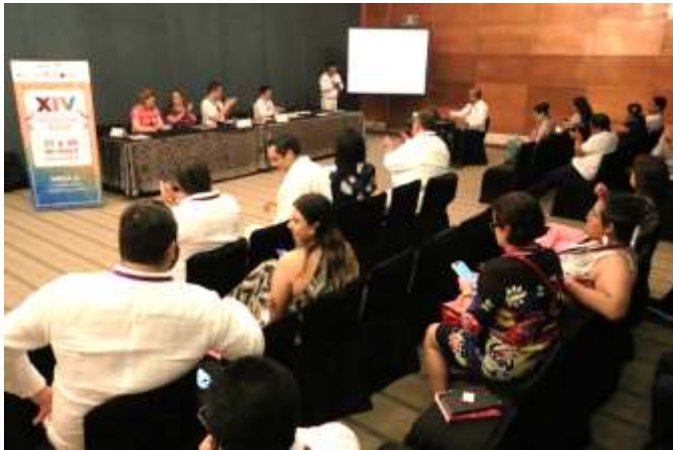
Mesa 2. Ciudadanía Intercultural. 25 de mayo de 2023.