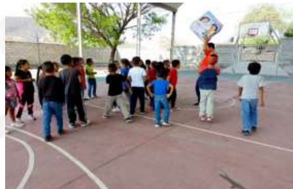
Taller: El Valor de los Valores