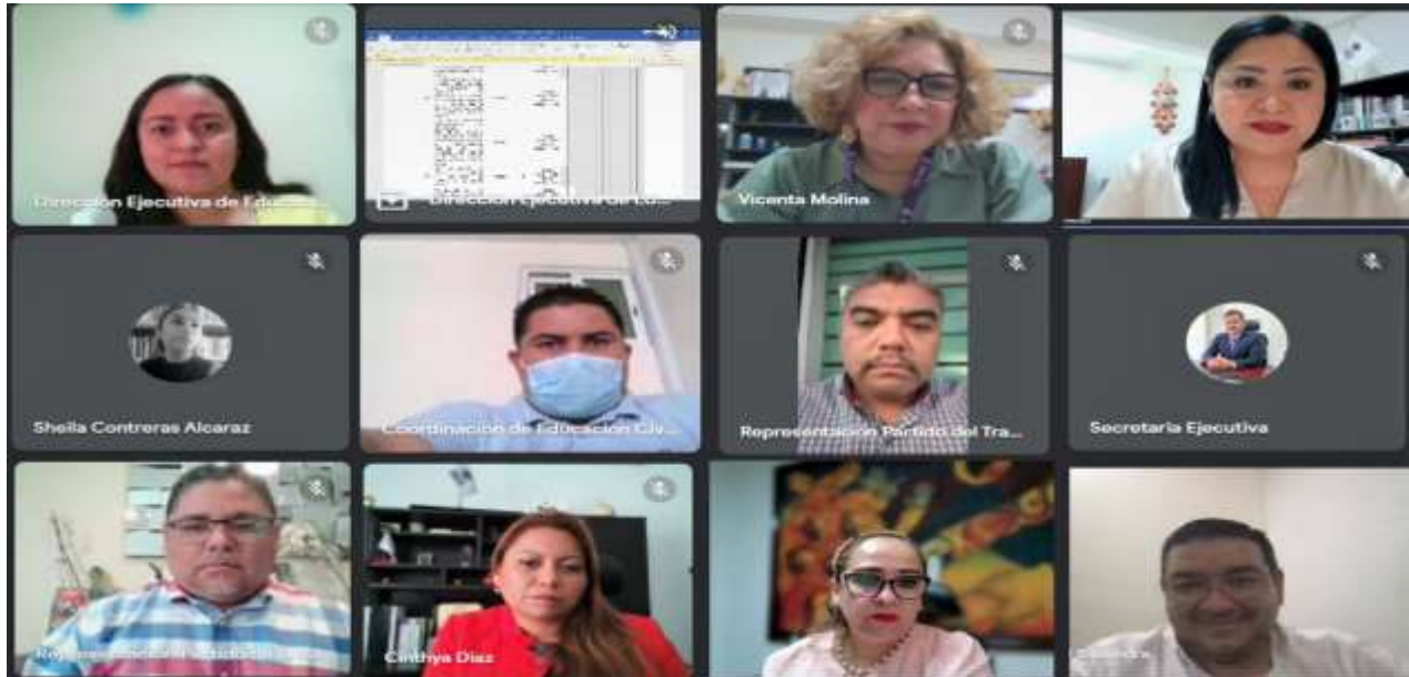
Primera Sesión Ordinaria de la Comisión de Educación Cívica y Participación Ciudadana (19-enero-2023)