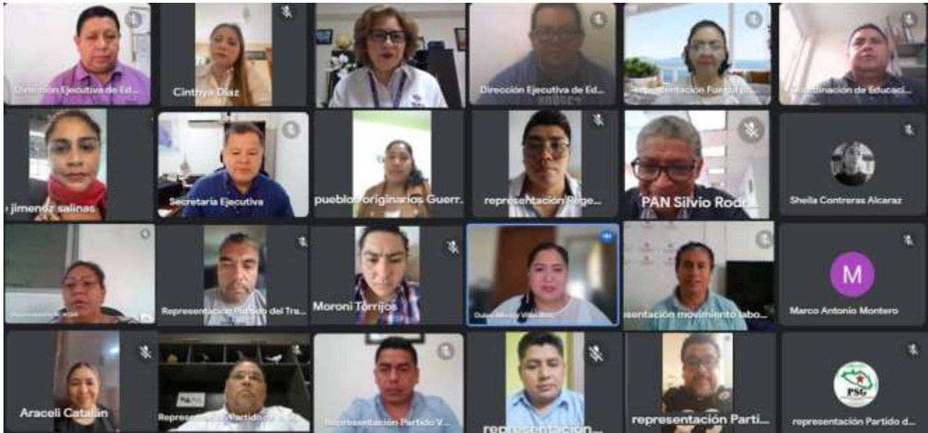
Décima Sesión Ordinaria de la Comisión de Educación Cívica y Participación Ciudadana (18-octubre-2023)