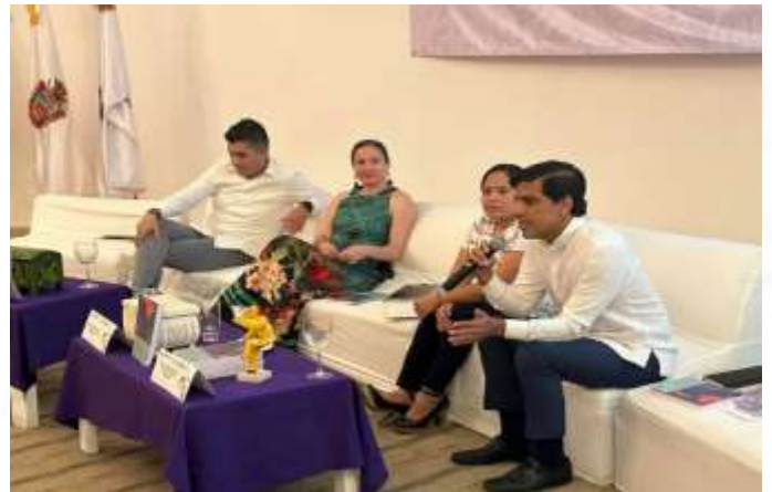
Presentación del Libro: “Innovación en Elecciones: Experiencias Internacionales”. 26 de mayo de 2023