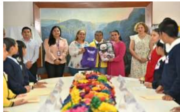
Instalación del cabildo infantil 2023 en coordinación con el Ayuntamiento de Chilpancingo de los Bravo