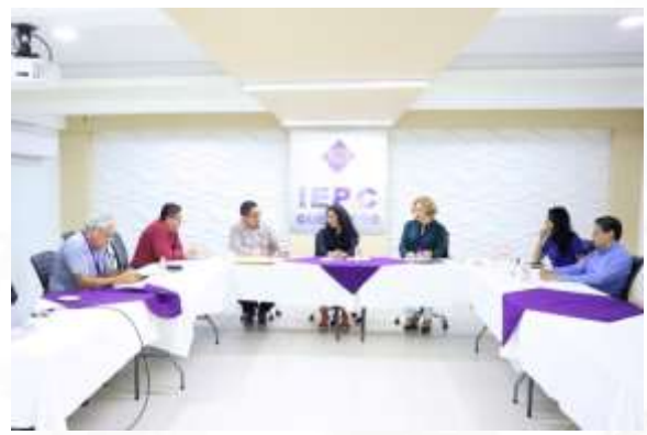
Construcción de la guía técnica para la elección de las comisarias municipales