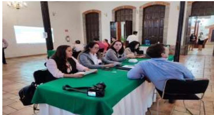
Participación en el 5° Taller Nacional de Participación Ciudadana, 20 y 21 de abril del 2023, Tlaxcala.