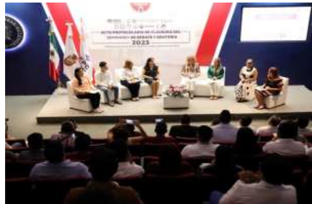
Seminario de Debate y Oratoria 2023.