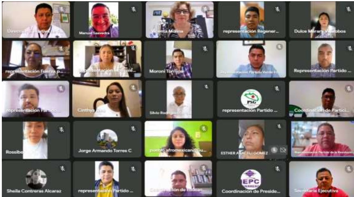
Novena Sesión Ordinaria de la Comisión de Educación Cívica y Participación Ciudadana (21-septiembre-2023)