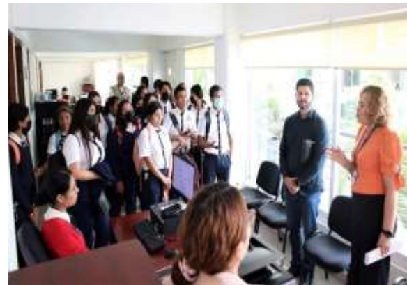
Visita guiada por el IEPC Guerrero, a las y los alumnos de la licenciatura en trabajo social de la Universitare Americne Mexique A.C. (UAM)