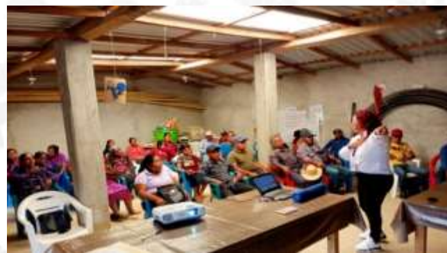
Talleres en materia de "prevención de la violencia contra las mujeres en razón de género en Copanatoyac, tlapa de Comonfort, Alpayeca y Acatepec