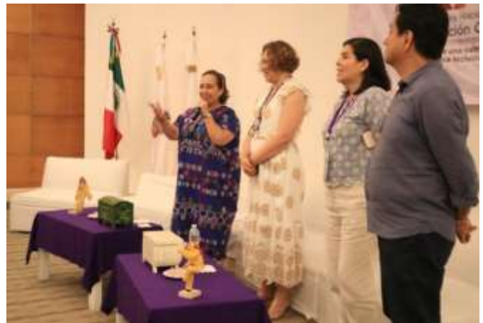
Reunión Plenaria. 26 de mayo de 2023