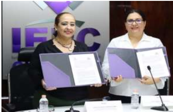
Firma de Convenio de Colaboración entre el IEPC Guerrero y la Facultad de Gobierno y Gestión Pública.