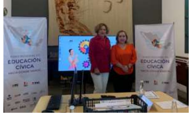
Actividades vinculadas con eventos nacionales en materia de Educación Cívica y Participación Ciudadana