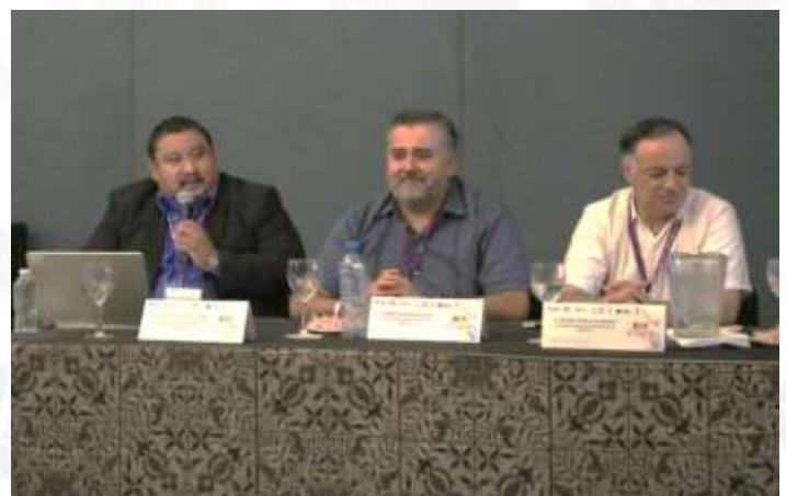
Mesa 6: Ejercicios Deliberativos de Participación Ciudadana. 26 de mayo de 2023.