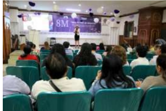
Conferencia: "Atención y prevención de la violencia hacia las mujeres con énfasis al ejercicio de los derechos políticos" Chilpancingo, Gro