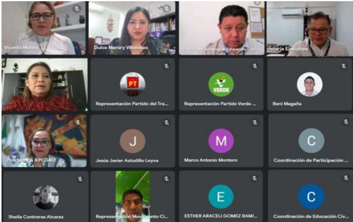
Tercera Sesión Ordinaria de la Comisión de Educación Cívica y Participación Ciudadana (16-marzo-2023)