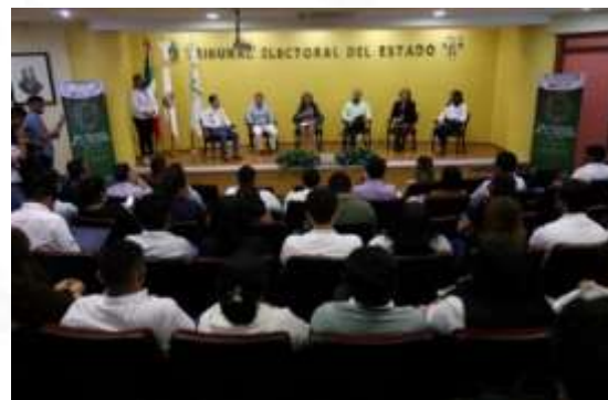
Participación en el día nacional de la oratoria