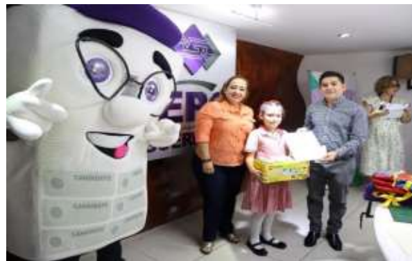
Segundo concurso de cuento infantil 2023