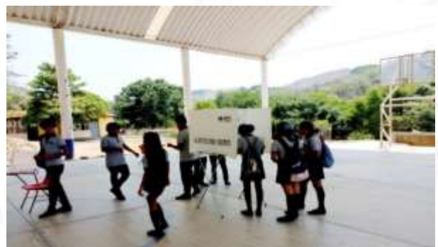
Taller: Forjadoras y Forjadores de la Democracia