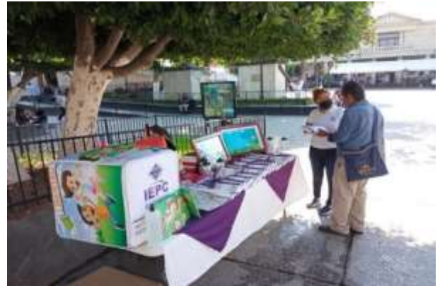
Semana Jurídica 2023