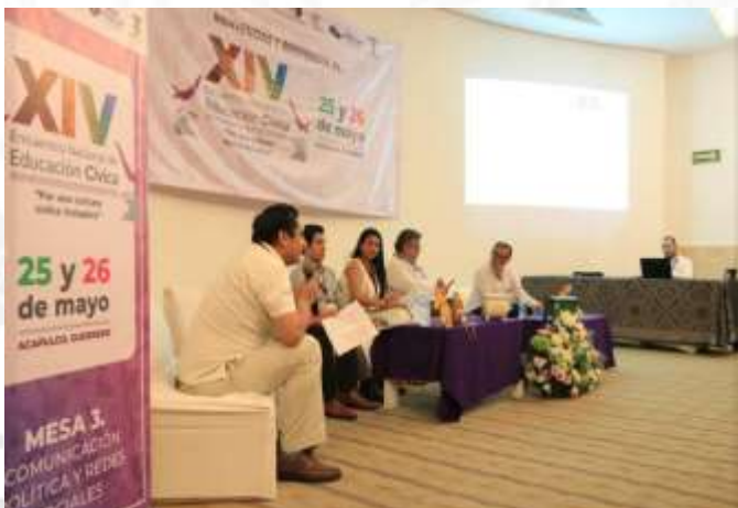
Mesa 3: Comunicación Política y Redes Sociales. 25 de mayo de 2023