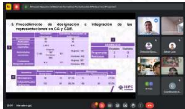
Primera Jornada de Capacitación a los Consejos Distritales Electorales