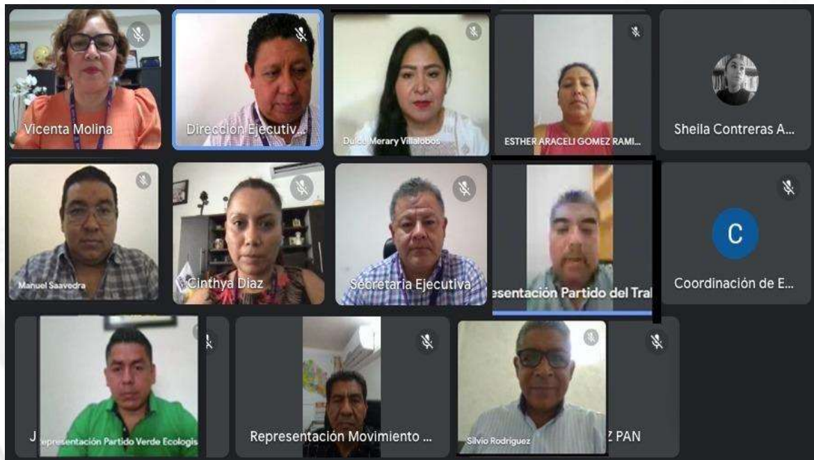
Cuarta Sesión Ordinaria de la Comisión de Educación Cívica y Participación Ciudadana (20-abril-2023)