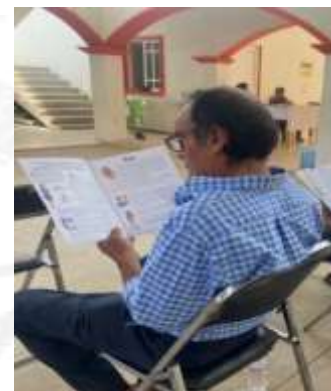
Elaboración del “Cuadernillo informativo para la consulta a pueblos y comunidades indígenas y afromexicanas en materia electoral 2023