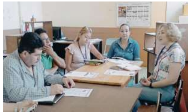
Gestiones para realizar el cabildo infantil en los ayuntamientos de Chilpancingo, Tixtla, Mochitlán y Quechultenango