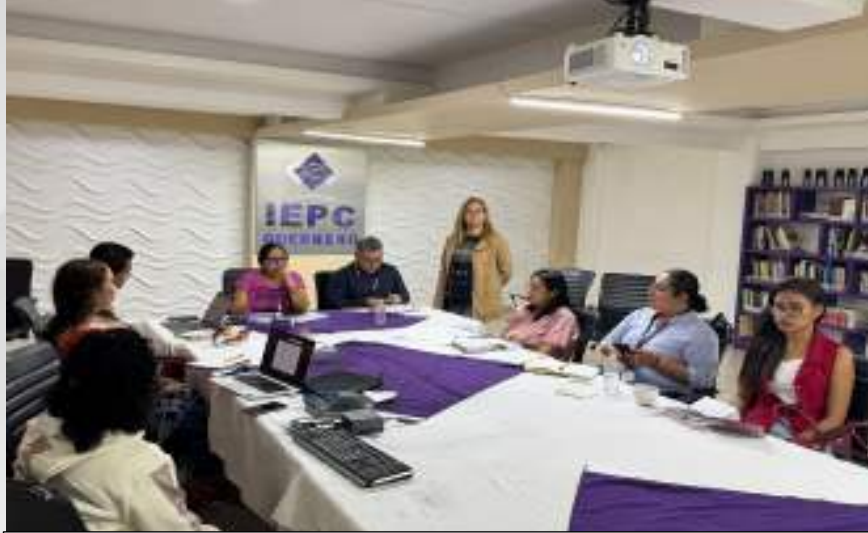
Reunión con las Comisión de Sistemas Normativos y Representante del Pueblo Afromexicano. 17 de febrero.