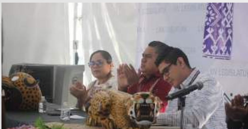
Cuarta Sesión del Diplomado en Justicia Electoral de los Pueblos. 08 de febrero.