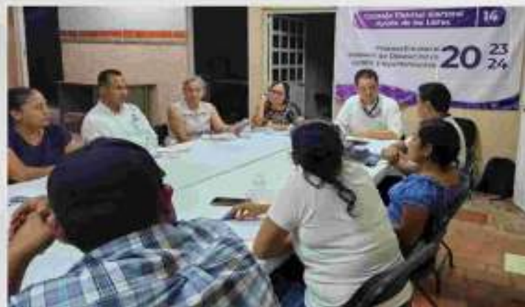
Recorrido a la bodega del Instituto, para adecuar y asignar espacios a las áreas de Organización Electoral, Archivo y Educación Cívica. 11 de enero.