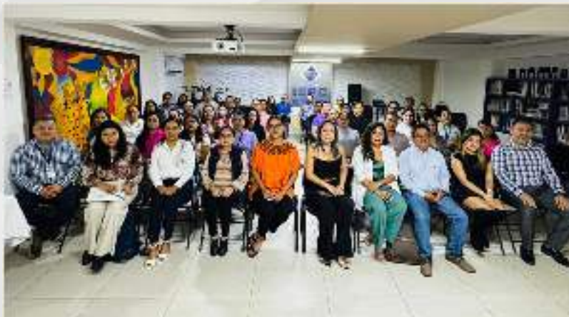
Capacitación “Nuevo Modelo de Reforma en Materia de Transparencia” 09 de diciembre.