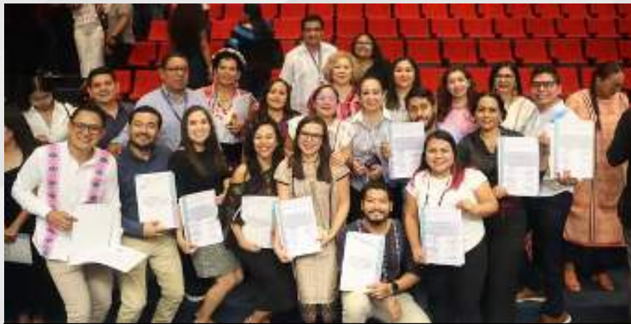
Clausura de Diplomado en Justicia Electoral, Participación Política y Representación de los Pueblos Indígenas y Afromexicano” 11 de abril.