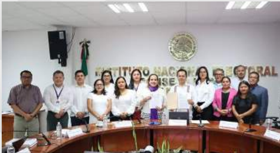
Firma de Convenio de Coordinación y Colaboración entre el INE y el IEPC Gro. 30 de enero.