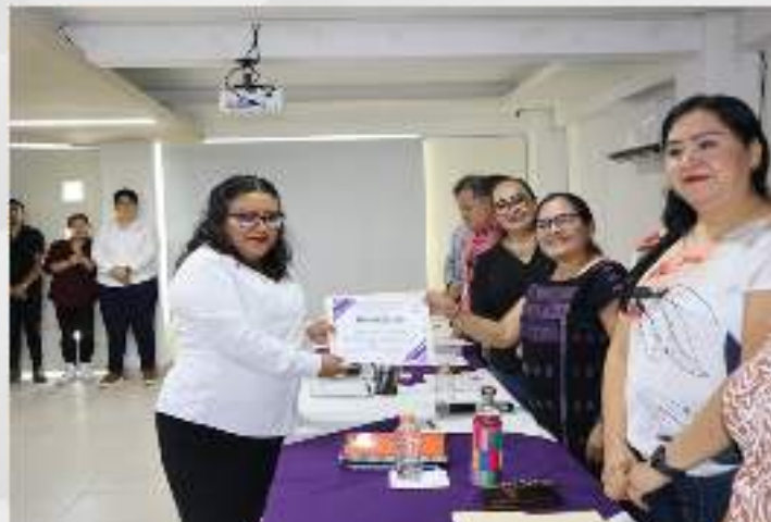
Entrega de reconocimientos a el personal que finalizó el curso de Office. 15 de julio