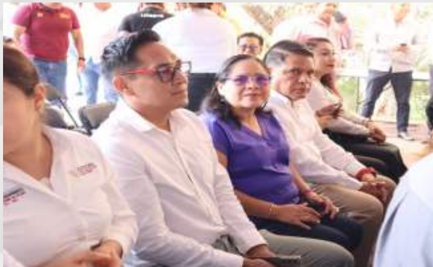
Inicio del Periodo de Declaración Patrimonial y de Intereses, por Modificación, 2024" 02 de mayo.