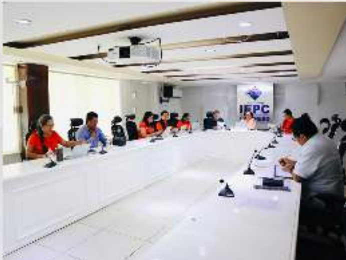
Reunión Previa a la Octava Sesión Ordinaria. 25 agosto.