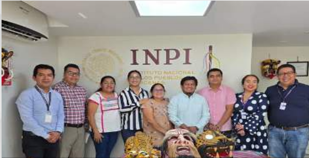
Reunión de trabajo con el INPI, para la colaboración en proyectos. 06 de abril.