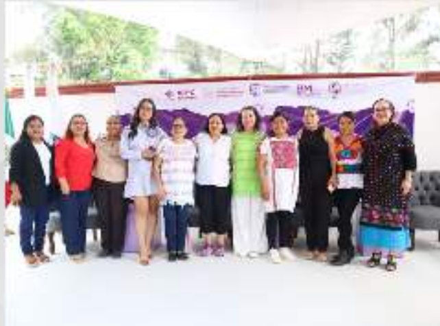
Sesión del Diplomado “Aurora Mesa Andraca”. 04 de diciembre.