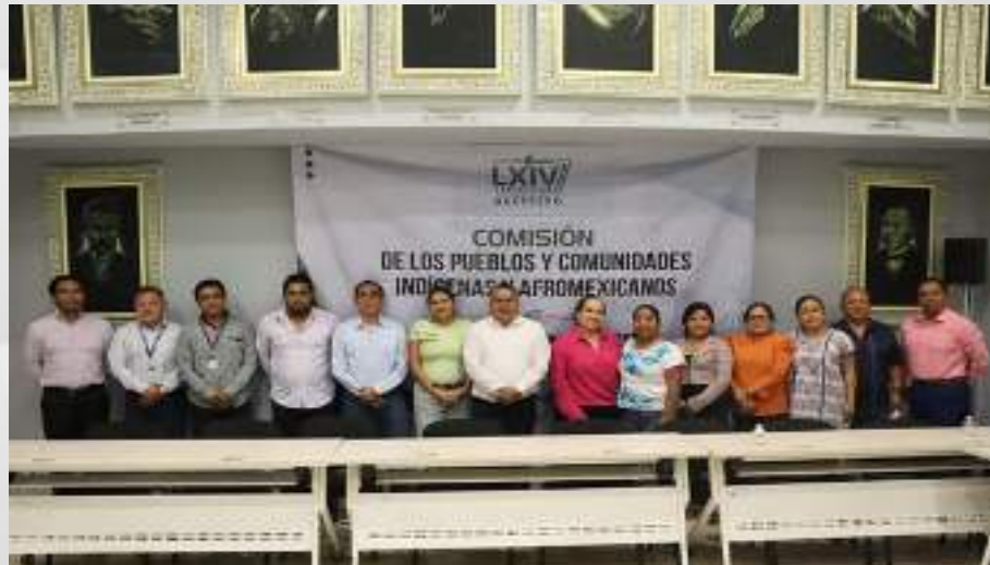
Reunión con la Comisión de Pueblos Indígenas y Afromexicanos del Congreso del Estado de Guerrero. 20 de febrero.