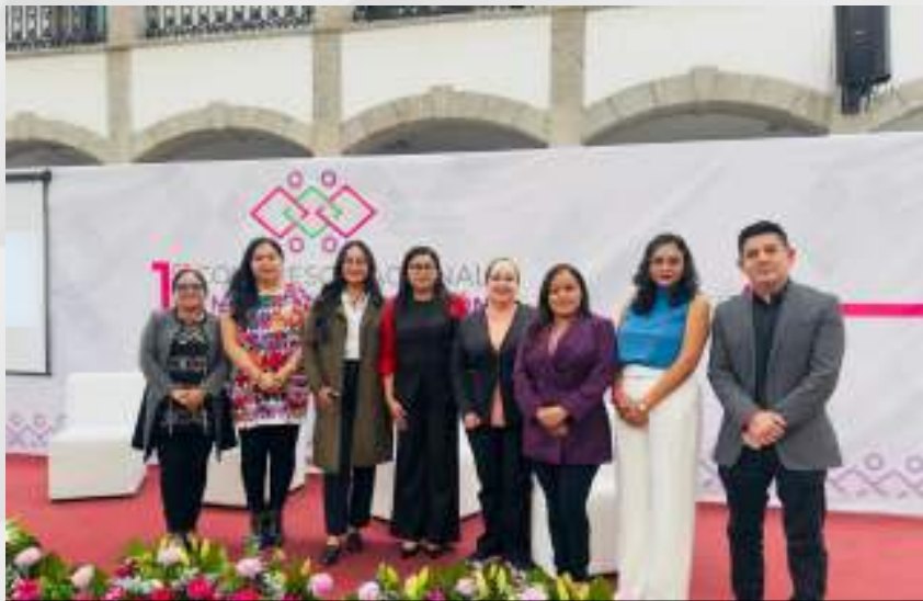
Primer Congreso Nacional en Materia de Inclusión Tlaxcala 2025. 16 y 17 enero.