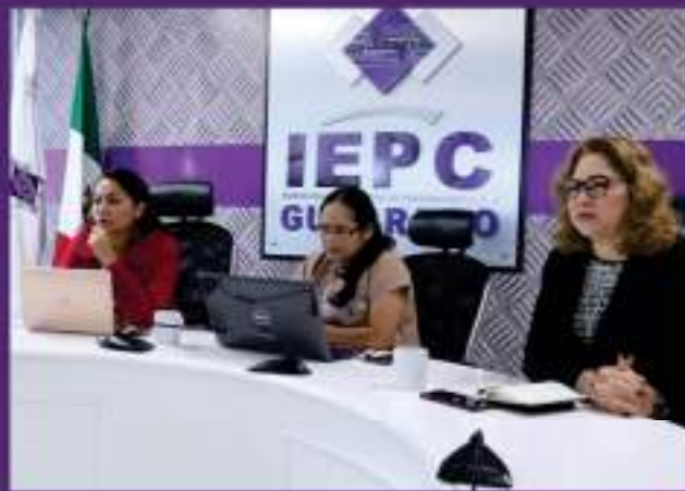
1º Sesión Ordinaria de la Comisión de Seguimiento al Servicio Profesional Electoral Nacional