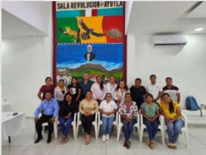
Organización de la Consulta de Ayutla de los Libres. 10 de septiembre.