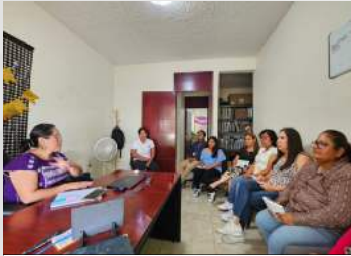
Reunión de trabajo con el personal de la Dirección y Coordinación de Sistemas Normativos Pluriculturales. 16 mayo.