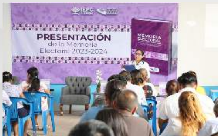
Presentación de la Memoria Electoral 2023 – 2024. 19 septiembre.