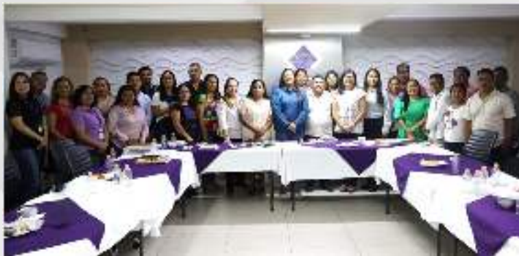
Reunión con el Concejo Municipal Comunitario de Ayutla de los Libres. 15 de agosto.