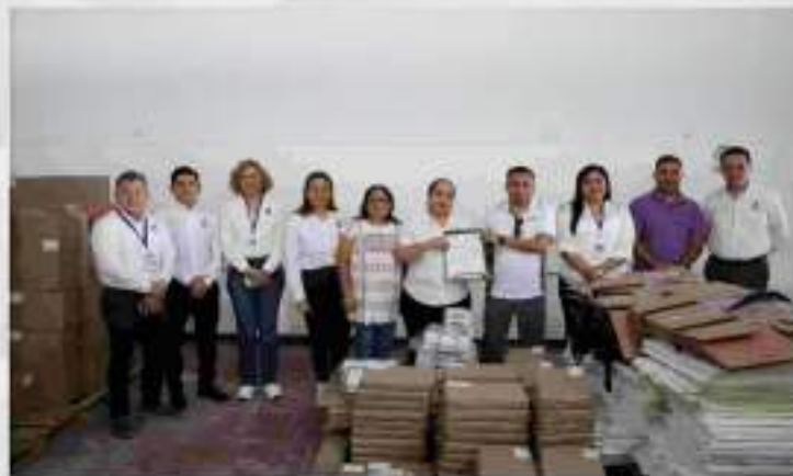
Visita a la bodega en coordinación con el INE para organizar el material que se entregará para el proceso electoral concurrente 2023-2024 28 de marzo 2024