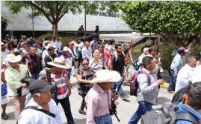
Día Internacional de los Pueblos Indígenas, 07 de agosto.