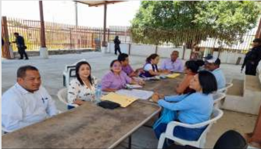
Difusión de la convocatoria para la elección de la Comisaría Municipal de Huehuetán, Guerrero 16 de abril.