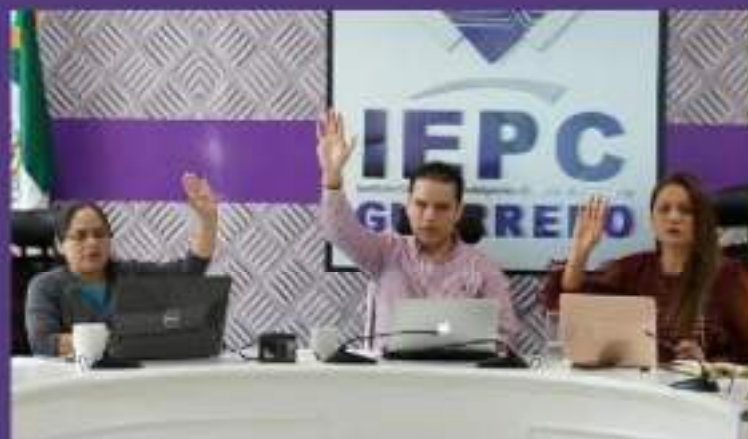
Novena Sesión Ordinaria de la Comisión Especial de Normativa Interna