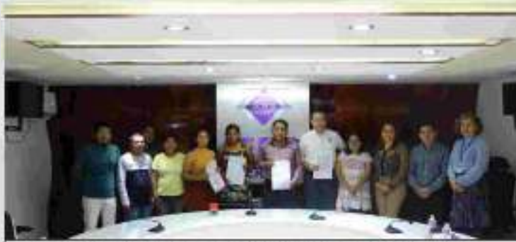
Reunión con integrantes del Comité de Gestión y Ayuntamiento Instituyente de Ñuu Savi 15 enero 2024