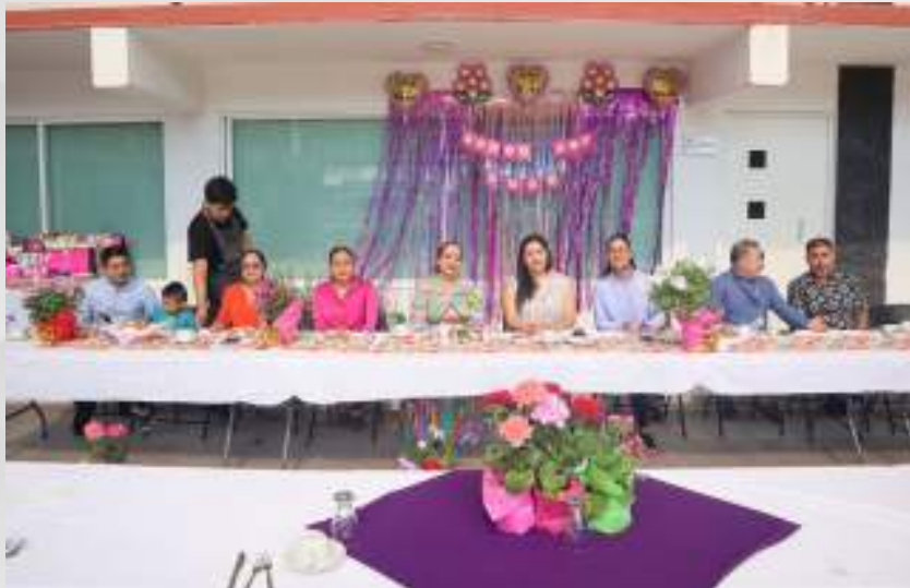
Desayuno del día de las madres. 09 de mayo.