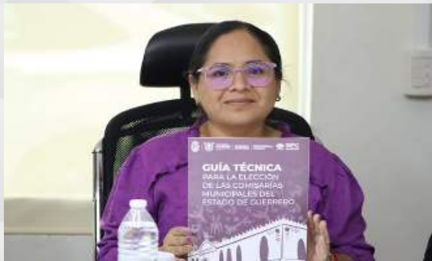
Presentación de la Guía Técnica para la Elección de las Comisarías Municipales del Estado de Guerrero. 21 de marzo.