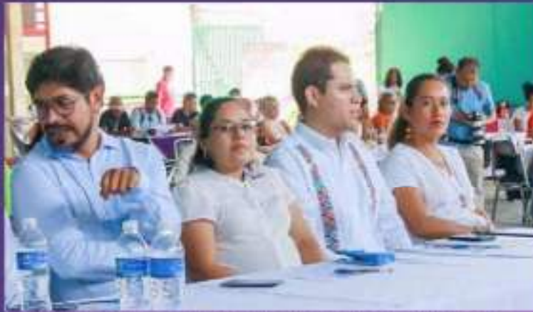
Diálogo sobre participación y representación política desde la perspectiva intercultural.