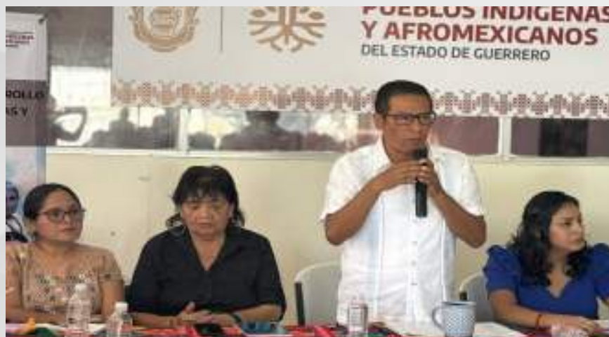
Día Mundial de la Cultura Africana y de los Afrodescendientes. 06 de febrero.