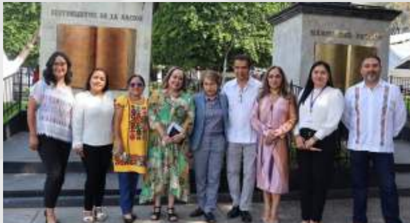
Cabildo Infantil 2025 14 de mayo.