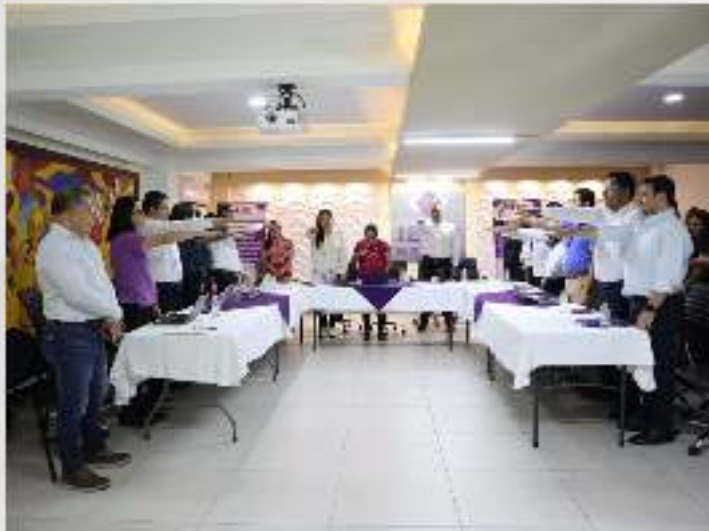
Instalación del Comité de Ética. 27 de junio.