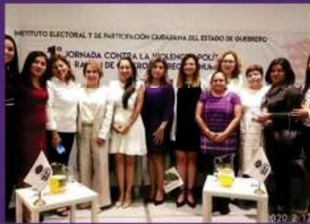
Primera Jornada contra la violencia política en razón de género y derechos humanos.