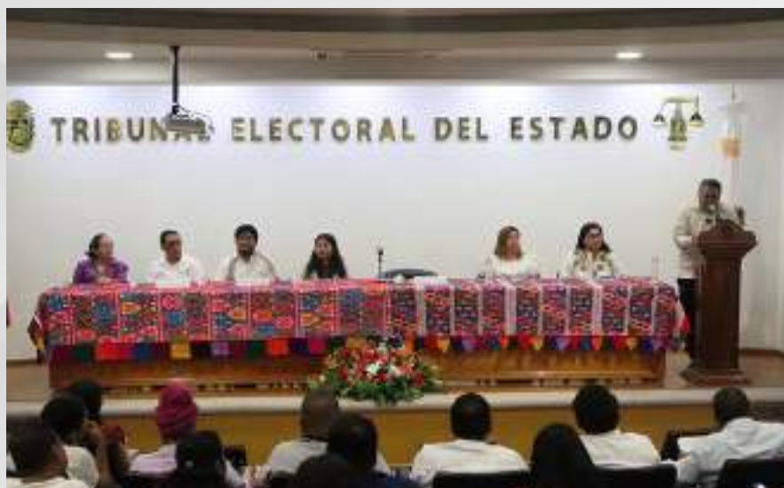
Octava Sesión del Diplomado, “Participación y representación política y comunitaria de las mujeres indígenas y afroamericana” 08 de marzo