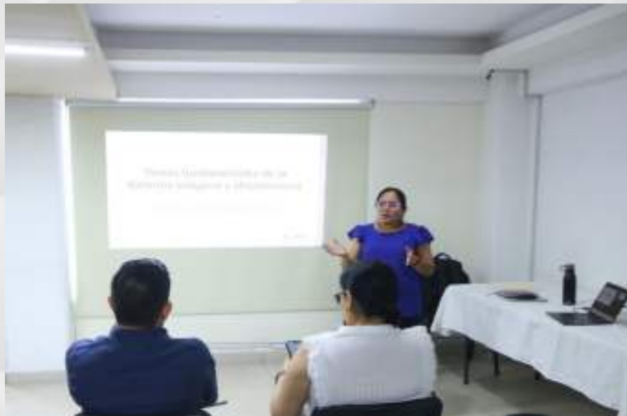
Plática informativa a las y los Titulares de las Direcciones Ejecutivas y Generales, Unidades Técnicas y Coordinaciones de este Instituto Electoral de temas fundamentales de la reforma en materia de pueblos y comunidades indígenas y del pueblo afroamericano. 06 de marzo.