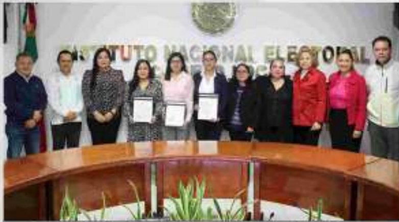
Entrega de Nombramientos a las Nuevas Consejerías del IEPC Guerrero. 27 de septiembre 2024