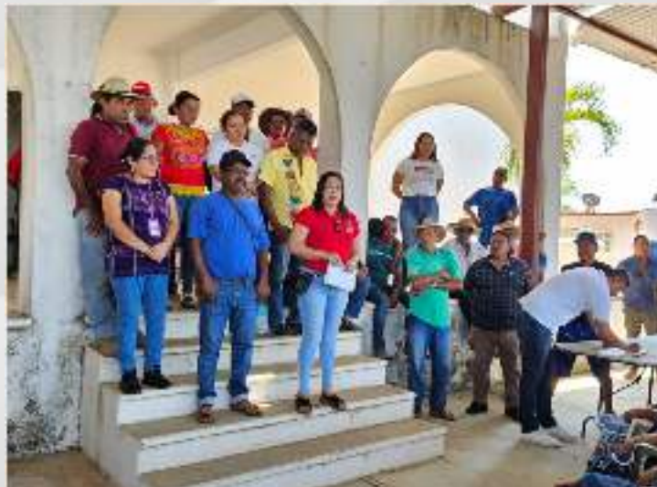
Asamblea Electiva de la Comisaría Municipal de Huehuetán. 18 mayo.