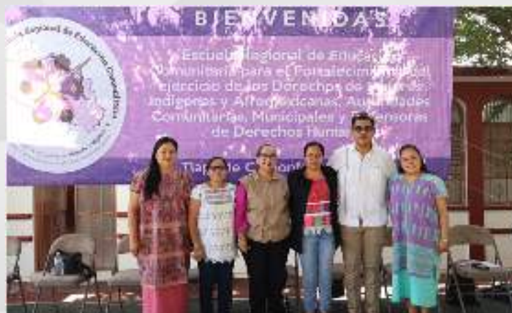
Inauguración de la Escuela Regional de Educación Comunitaria, en la Zona de la Montaña. 27 de septiembre.