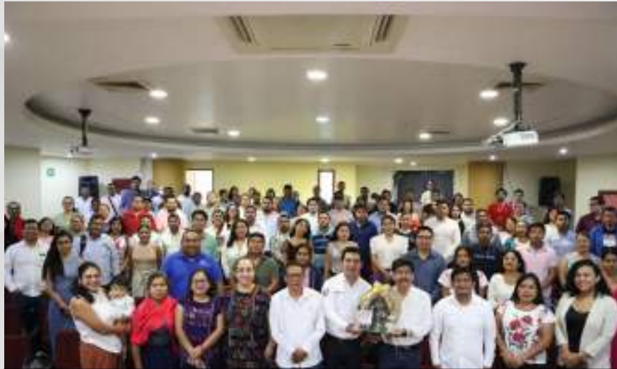
Inicio del Diplomado en Justicia Electoral, Participación Política y Representación de los Pueblos Indígenas y Afromexicano. 18 de enero.