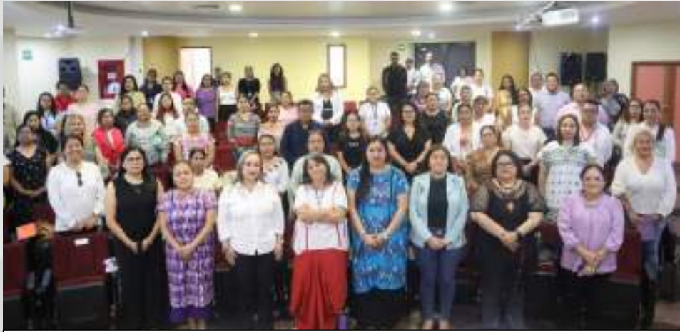
Conferencia “El reto de la representación política de las mujeres indígenas”. 03 de marzo. Conferencia “El reto de la representación política de las mujeres indígenas”