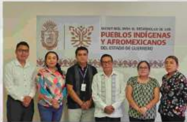
Reunión para realizar un convenio de colaboración con la SEDEPIA 20 de noviembre 2024