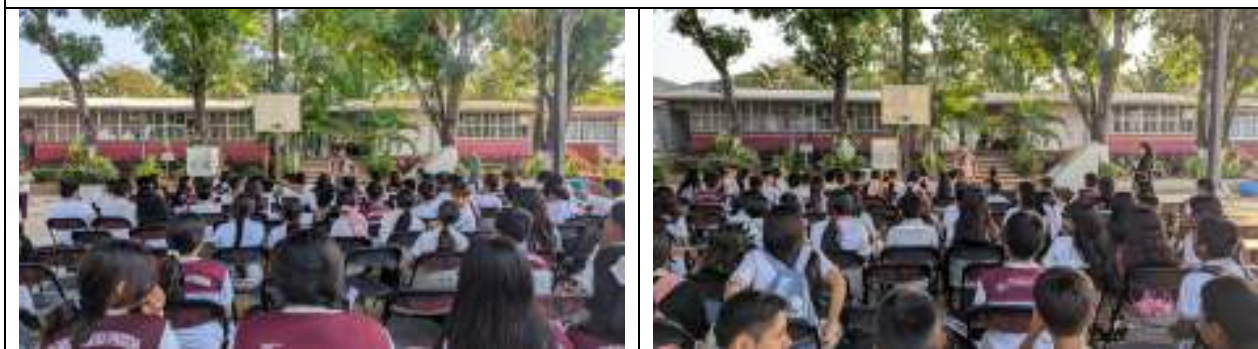
Alumnado de la Escuela Secundaria Técnica #97 “Juan del Carmen”

Se contó con la asistencia de 339 estudiantes, de los cuales 188 fueron mujeres y 151 hombres.