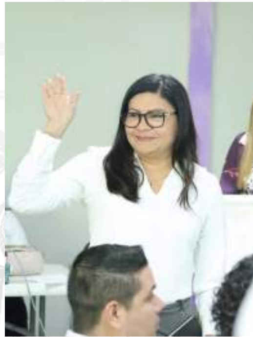
Fotos del Día Internacional de la Mujer y la Niña en la Ciencia 2026.