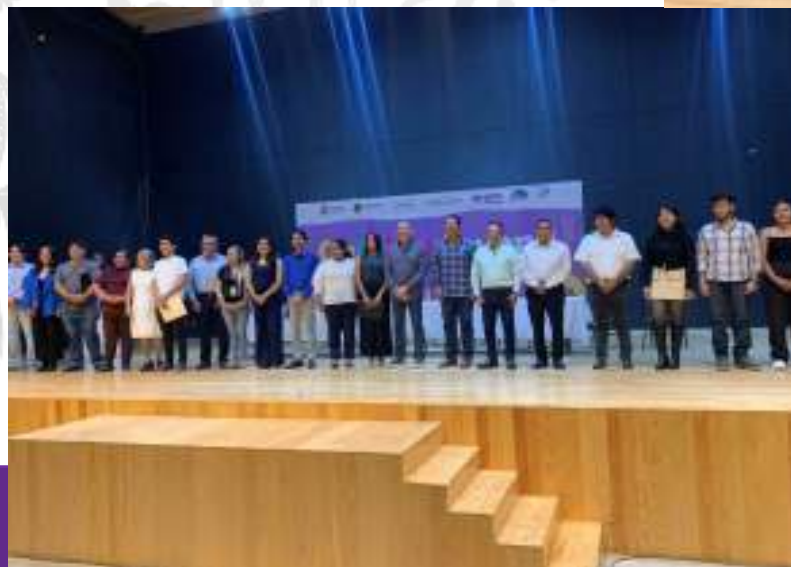
Evaluación de propuestas Cabildo Juvenil, 23 de enero del 2026.