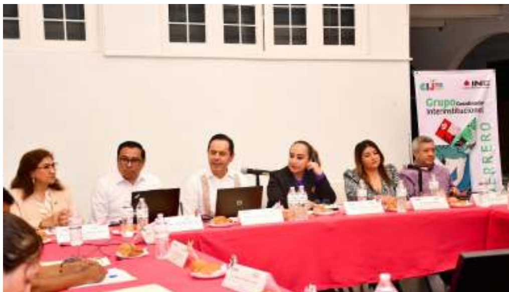
Reunión 23 de octubre del 2024, presentación de la CIJ, en la imagen la Consejera Presidenta.