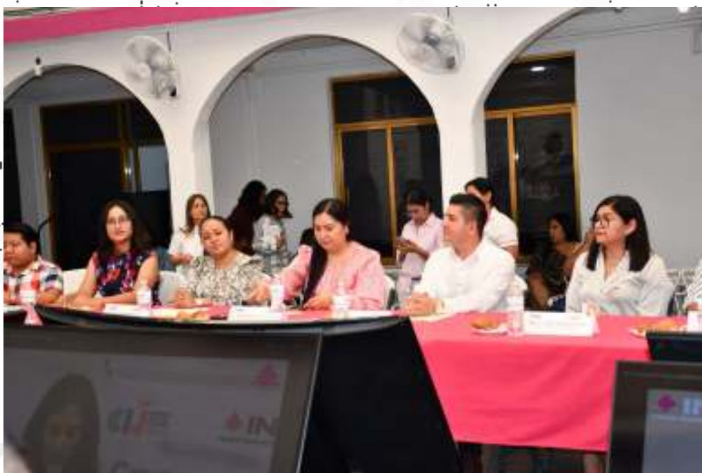
Reunión 23 de octubre del 2024, presentación de la CIJ, en la imagen las Consejeras Electorales y el Consejero Electoral.