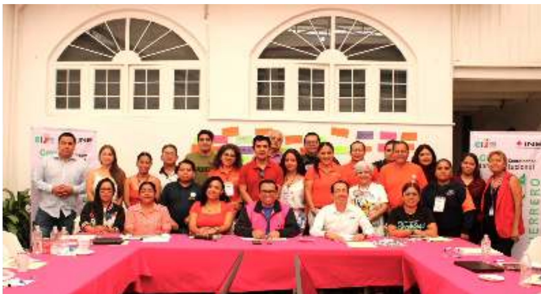
Capacitación 25 de octubre del 2024, en la imagen personal está el personal de la CEC.