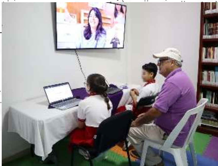
Actividades en la Ludoteca Infantil “El Valor de los Valores” proyección de la Historieta “El Valor de los Valores” y la emisión de opiniones en la Consulta Infantil y Juvenil 2024