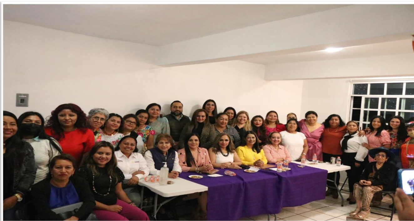
REUNIÓN DE TRABAJO, 16 DE ENERO DE 2023.

PRESIDENTA DE LA COMISIÓN ESPECIAL DE IGUALDAD DE GÉNERO Y NO DISCRIMINACIÓN