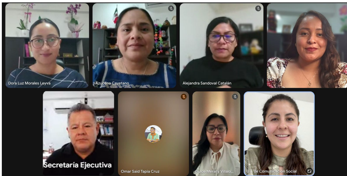
Cuarta reunión de trabajo con el Comité Editorial