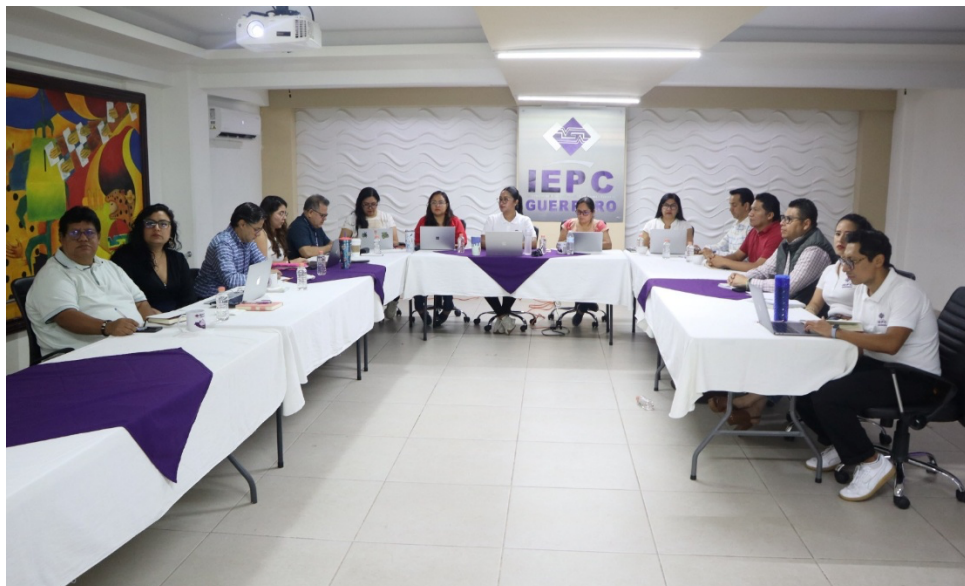
Segunda reunión de trabajo con el Comité Editorial