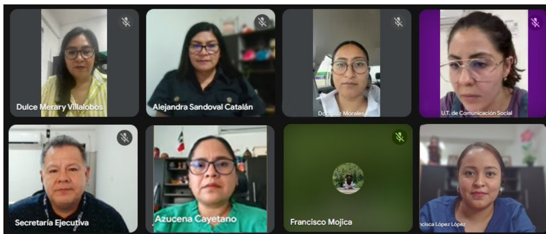
Tercera reunión de trabajo con el Comité Editorial