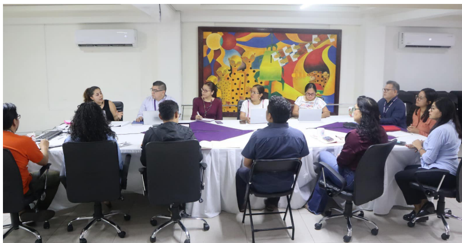
Primera reunión de trabajo con el Comité Editorial