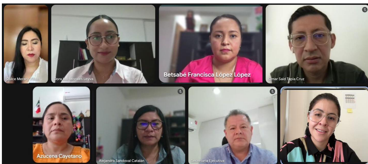
Quinta reunión de trabajo con el Comité Editorial