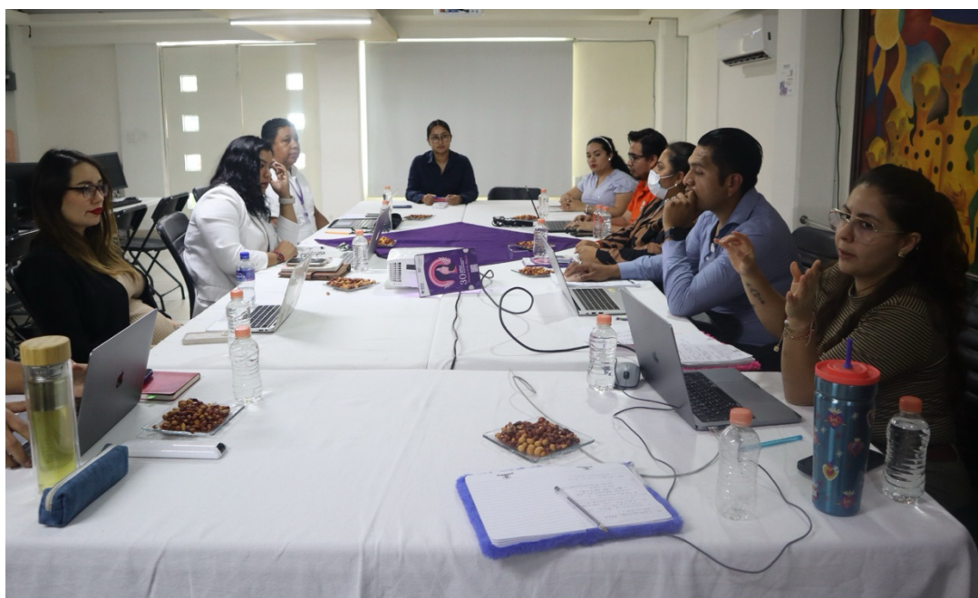
Segunda reunión de trabajo con el GTI