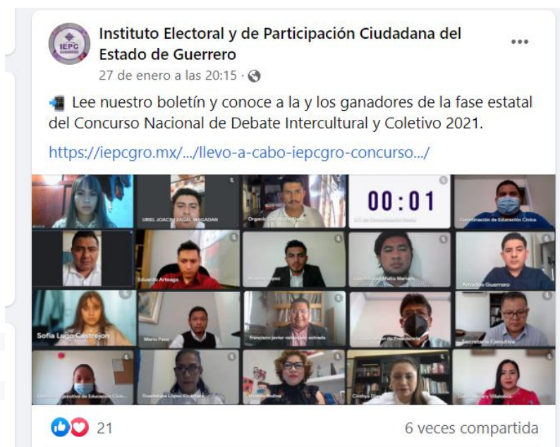
Imagen correspondiente al concurso en su fase estatal