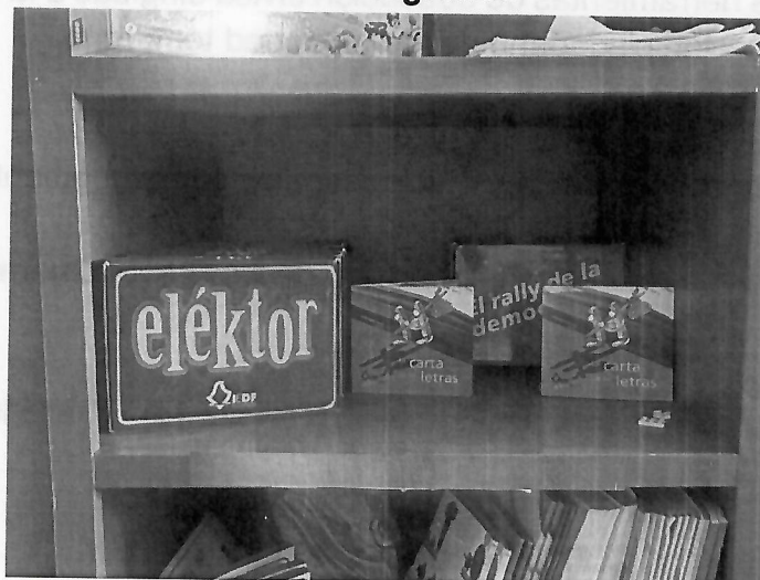
Material didáctico proporcionado por el Instituto Electoral de la Ciudad de México.