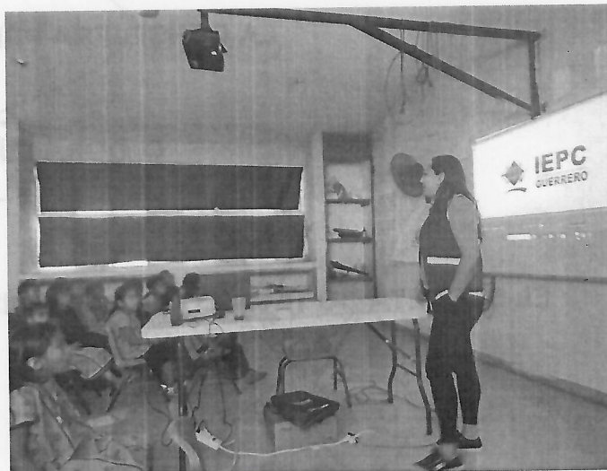
Escuela Primaria Bilingüe "Vasco de Quiroga", Zacualpan, Ometepec, Gro., 11 de marzo del 2025