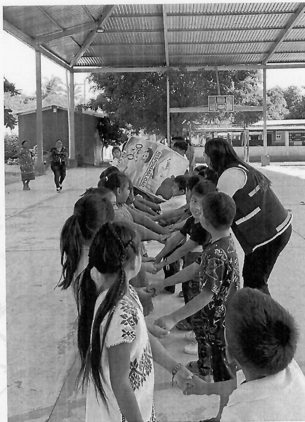
Escuela Primaria "Escudo Nacional", Guadalupe Victoria, Xochistlahuaca, Gro. 26 de febrero del 2025.