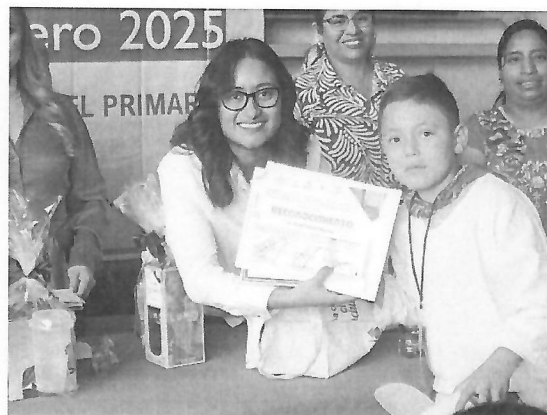
Toma de protesta a las y los parlamentaristas del XVII Parlamento Infantil, en la Sala de Plenos "Primer Congreso de Anáhuac el día 10 de abril de 2025.