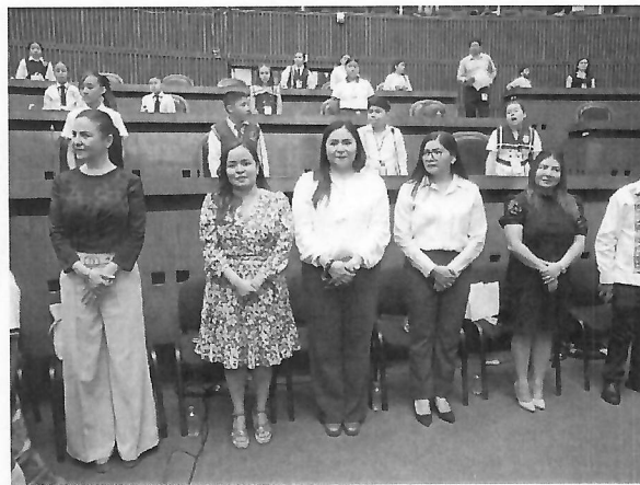
Apertura de los trabajos de del XVII Parlamento Infantil, en la Sala de Plenos "Primer Congreso de Anáhuac" el día 10 de abril del 2025.

(Handwritten blue mark resembling a stylized 'D' or 'A')