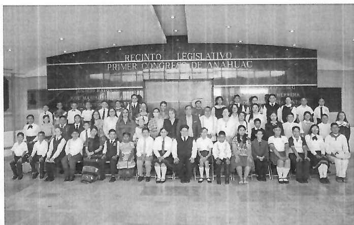
Toma de fotografía del XVII Parlamento Infantil en el Vestíbulo del H. Congreso del Estado, el día 10 de abril del 2025.