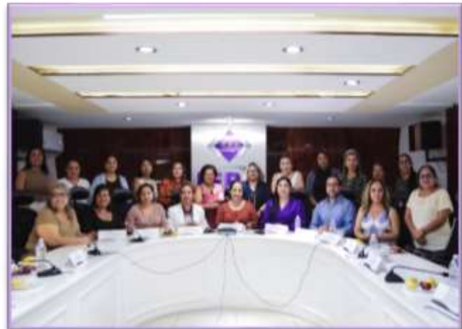
Primera Sesión Extraordinaria del Consejo General del Observatorio

Se informa a las y los integrantes de la Comisión de Igualdad de Género, Inclusión y No Discriminación, para conocimiento y efectos conducentes.