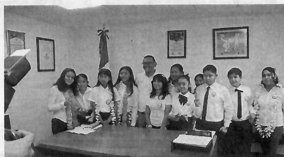
Visita a las Regidurías y Despacho Presidencial