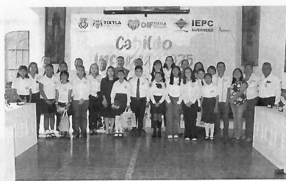
28 de mayo de 2025, toma de protesta e instalación del Cabildo Infantil 2025.