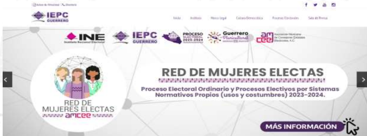
Carrusel de la página web del IEPC Guerrero

En el marco del Programa de la Red de Candidatas y en su caso la Red de Mujeres Electas en el Proceso Electoral Ordinario y los Procesos Electivos por Sistemas Normativos Propios (usos y costumbres) 2023-2024, se solicitó a la Dirección General de Informática y Sistemas de este Instituto Electoral incorporar un banner alusivo a la Red de Candidatas y en su caso la Red de Mujeres Electas con la finalidad de dar continuidad a la estrategia de difusión de dicha red y obtener un número mayor de participantes.