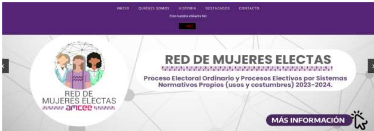
Carrusel del micrositio Derechos Políticos y Electorales de las Mujeres Guerrerenses

Al hacer clic en el banner direcciona al apartado en el que se visualiza la información relativa la Red de Mujeres Electas en el Proceso Electoral 2023-2024.