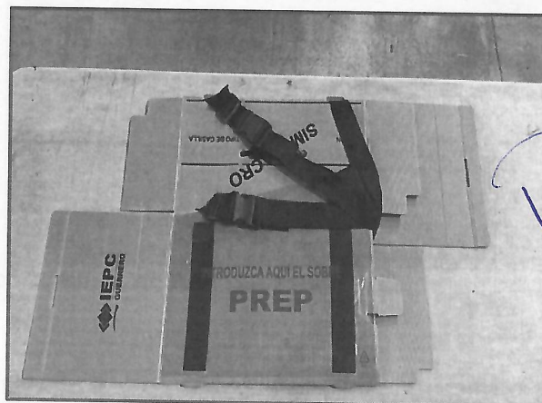
Clasificación de los materiales electorales para simulacros