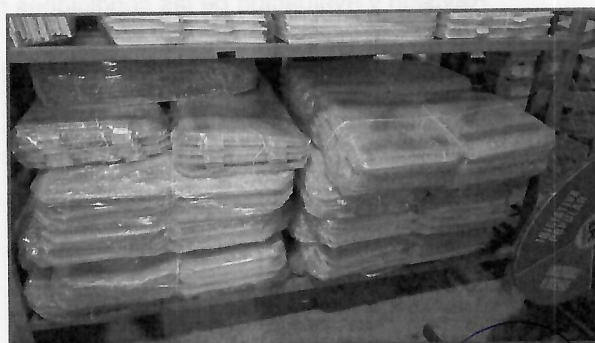
Bases porta urna y urnas almacenadas en la bodega electoral.