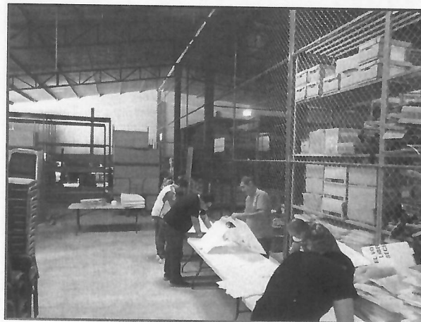
Revisión y evaluación de las condiciones físicas del material electoral para simulacros.