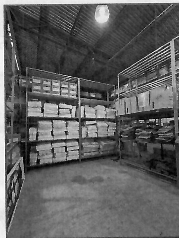
Vista panorámica de la bodega de la DEECyPC