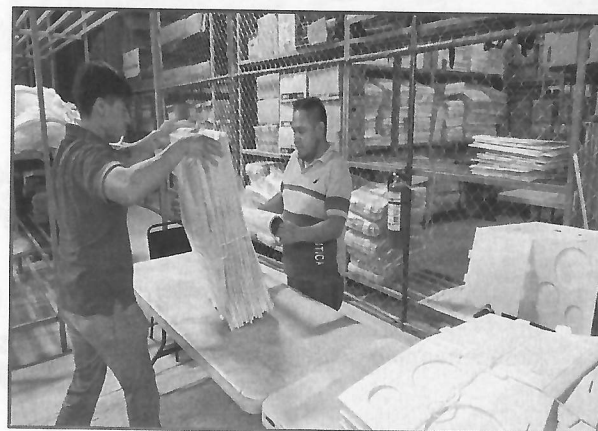
Proceso de limpieza y empaquetado de los materiales electorales para simulacros