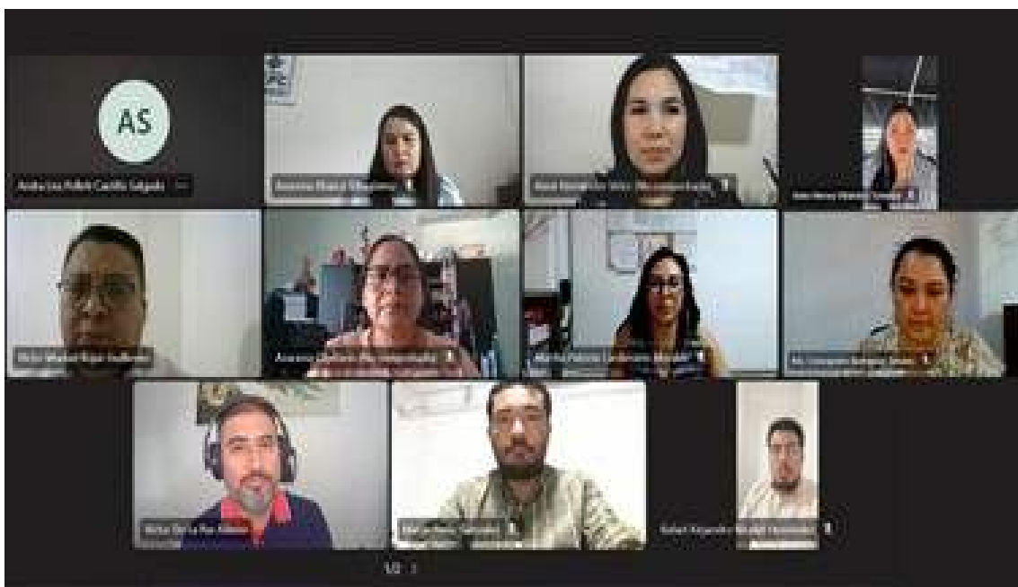
TERCERA SESIÓN EXTRAORDINARIA 30/09/2025