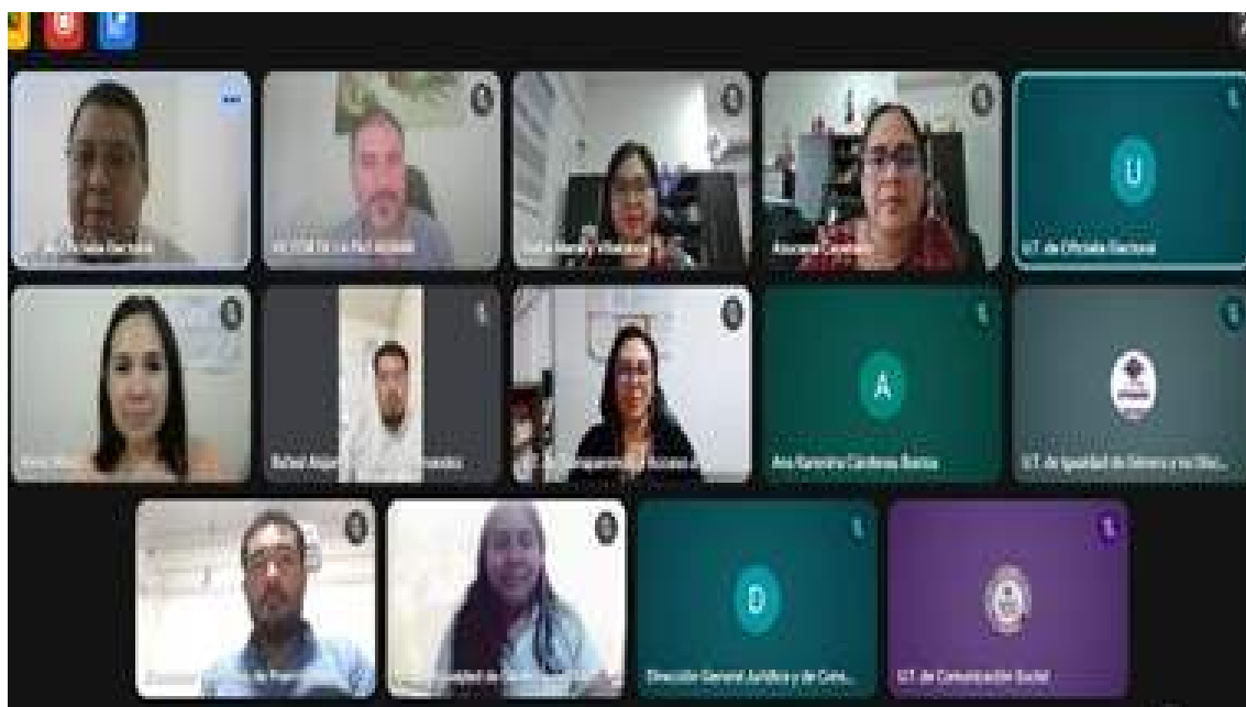
PRIMERA SESIÓN EXTRAORDINARIA 23/09/2025