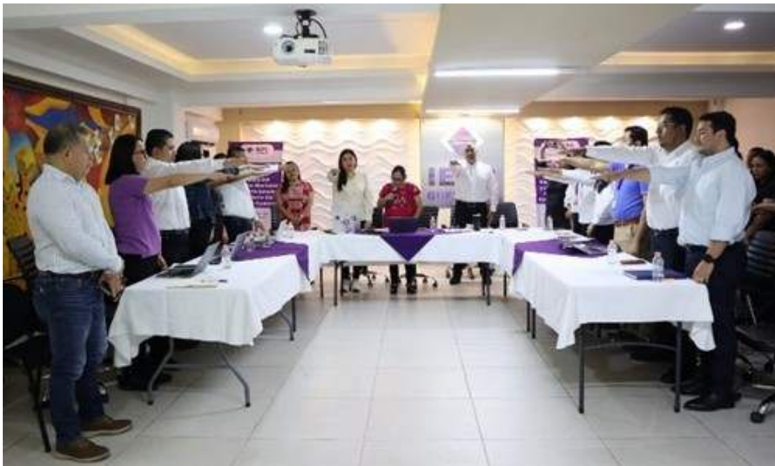
PRIMERA SESIÓN ORDINARIA 27/06/2025