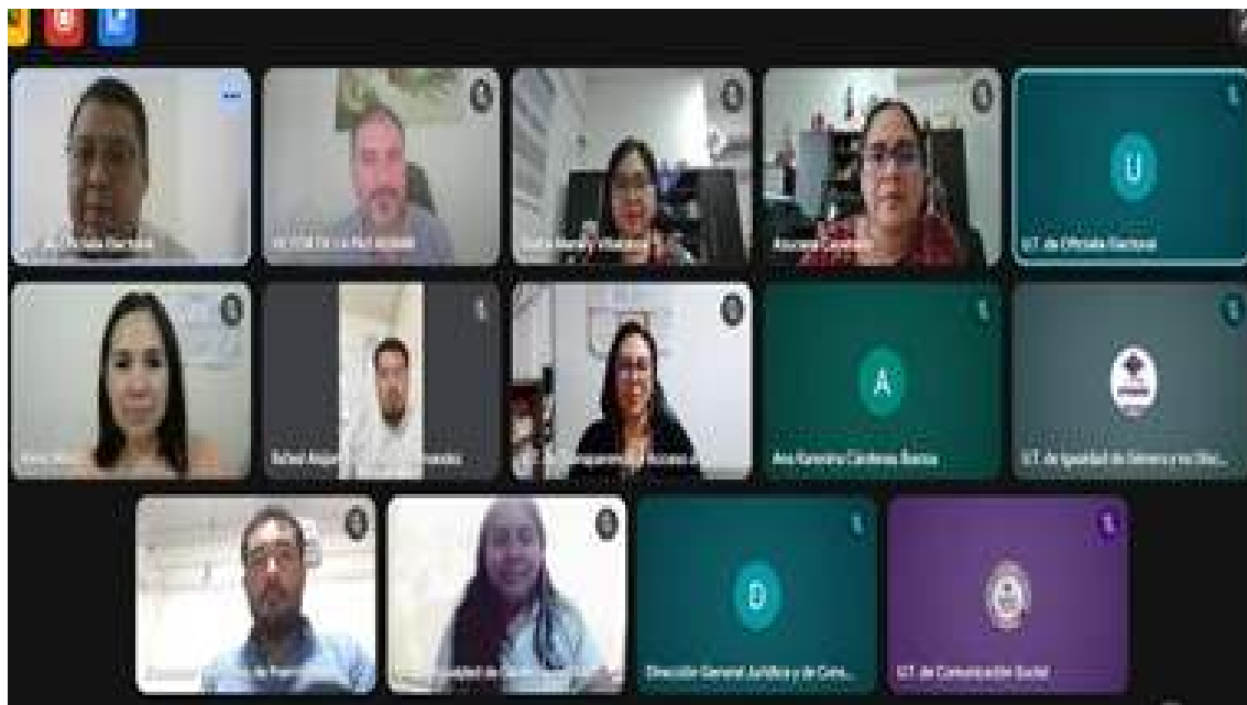
SEGUNDA SESIÓN EXTRAORDINARIA 25/09/2025