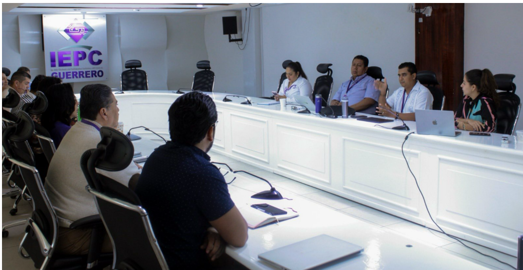
Tercer reunión de trabajo con el GTI