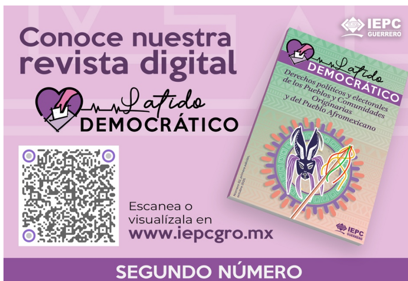
Banner de difusión