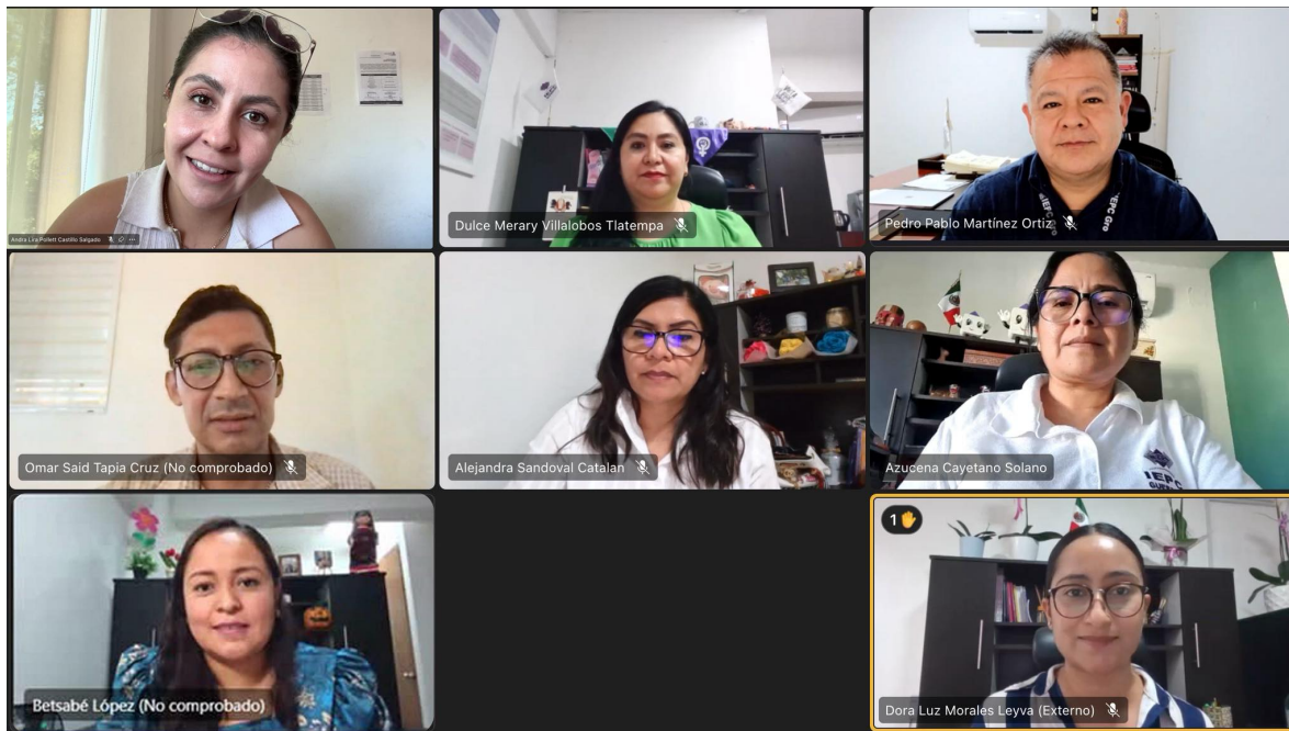
Tercer Sesión Ordinaria, 28 de noviembre de 2025.