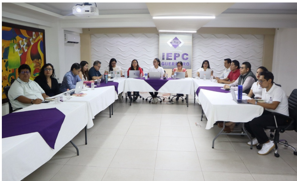
Segunda reunión de trabajo con el Comité Editorial