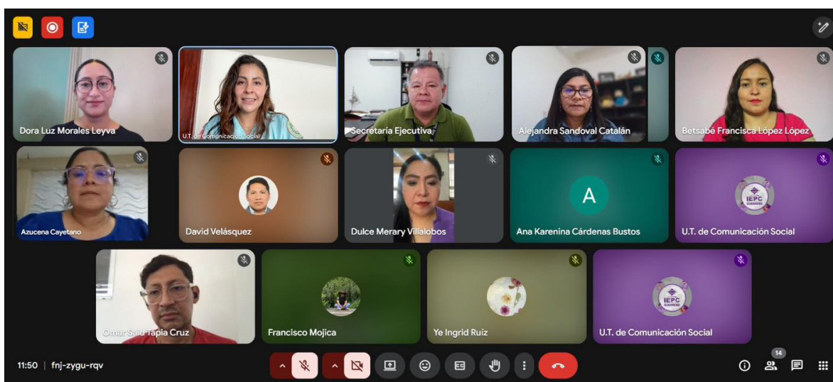
Primera Sesión Ordinaria, 29 de agosto de 2025.