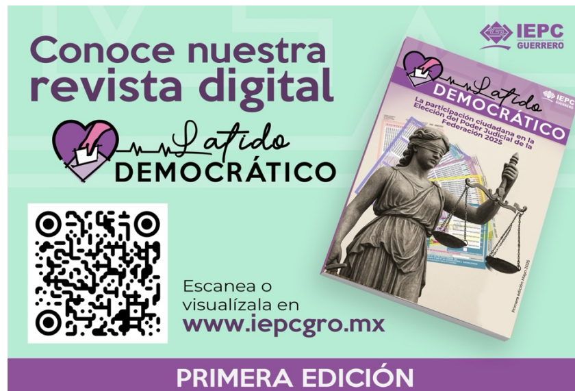
Banner de difusión