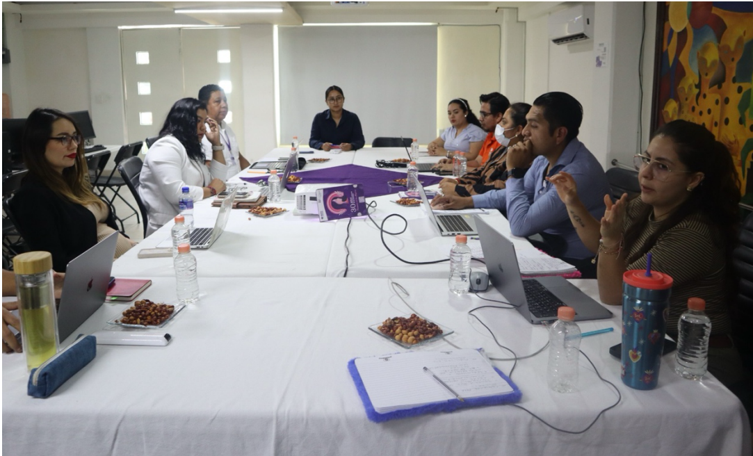
Segunda reunión de trabajo con el GTI