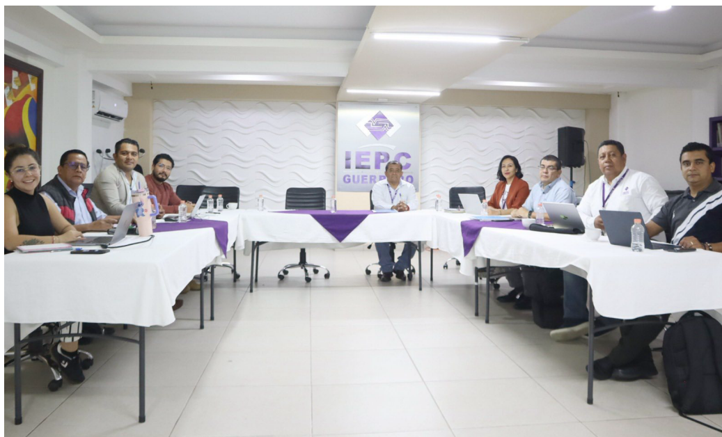
Cuarta reunión de trabajo con el GTI