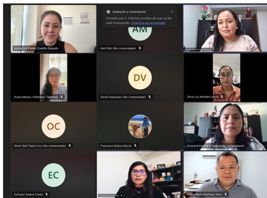
Cuarta Sesión Ordinaria, 28 de noviembre de 2025.