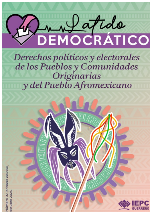
Diseño de portada de la revista