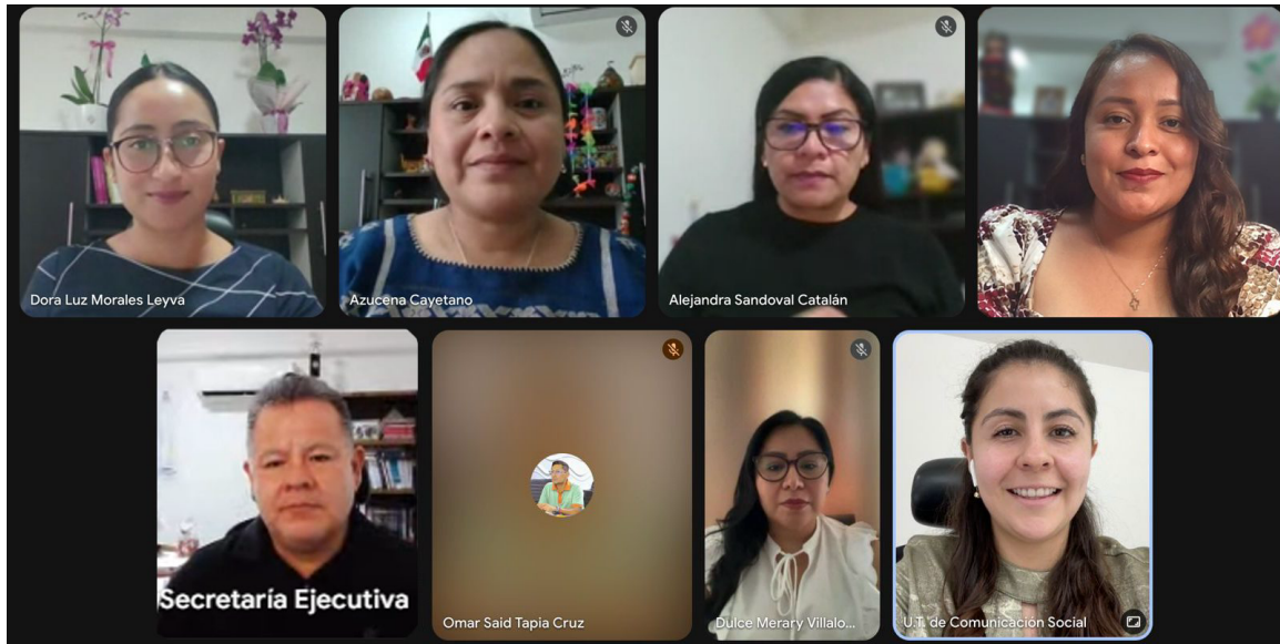
Cuarta reunión de trabajo con el Comité Editorial