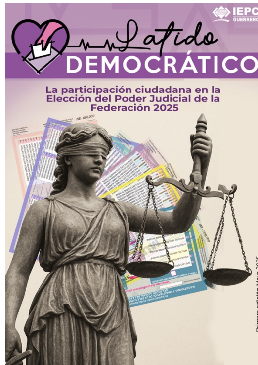
Diseño de portada de la revista