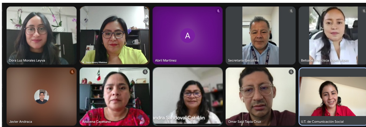
Segunda Sesión Ordinaria, 22 de septiembre de 2025.