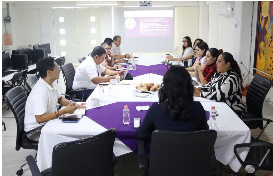
Primera reunión de trabajo con el GTI