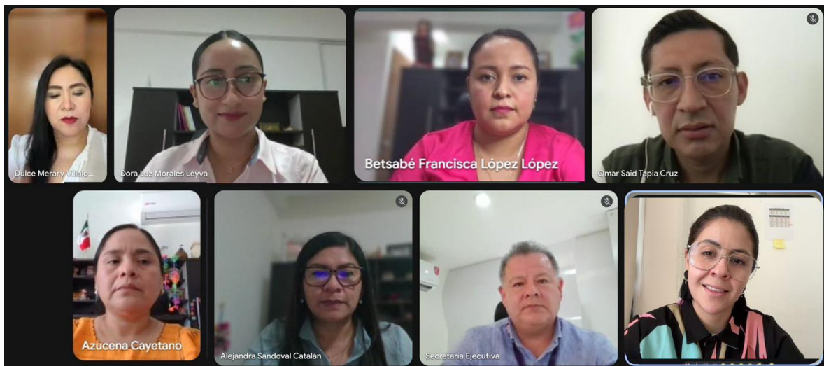
Quinta reunión de trabajo con el Comité Editorial